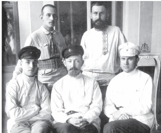
Харків. Літо 1920. Сидять зліва направо: Василь Манцев – начальник ЦУПНАДКОМу, Фелікс Дзержинський, Всеволод Балицький – заступник начальника ЦУПНАДКОМу

Русопятства я не замечал, да и жалоб не слышал. В области моей специальности – здесь обильный урожай. Вся, можно сказать, интеллигенция средняя украинская – это петлюровцы... Громадной помехой в борьбе – отсутствие чекистов-украинцев» 17 (прикметно, що виділені нами слова не увійшли до радянських 18 та сучасних російських видань, присвячених діяльності Ф.Е. Дзержинського 19 ).