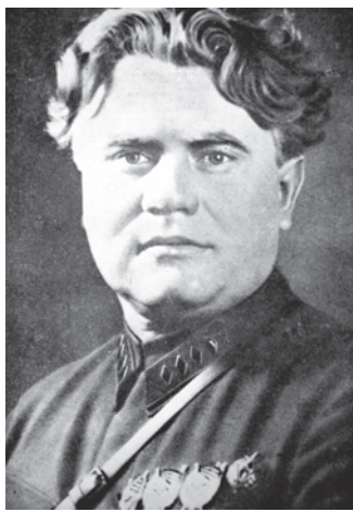
Всеволод Аполлонович Балицький (1932 р.)

Упродовж 1930-1931 років старший уповноважений секретного відділу Київського оперативного сектора ДПУ УСРР Соломон Брук був задіяний у каральній операції радянських органів державної безпеки проти військових спеціалістів – колишніх генералів та офіцерів Російської імператорської армії, які перейшли на