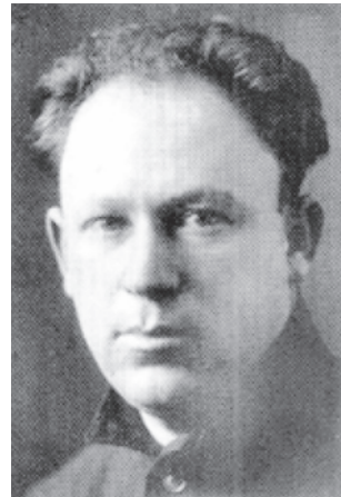
Володимир Юхимович Цесарський (1930-ті роки).