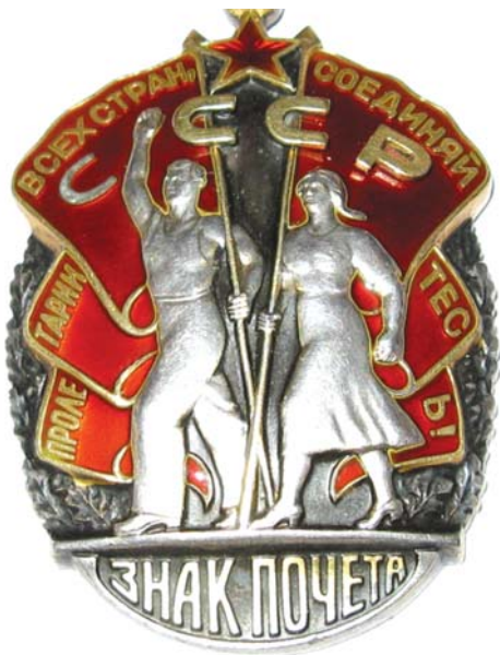
Орден «Знак Пошани»