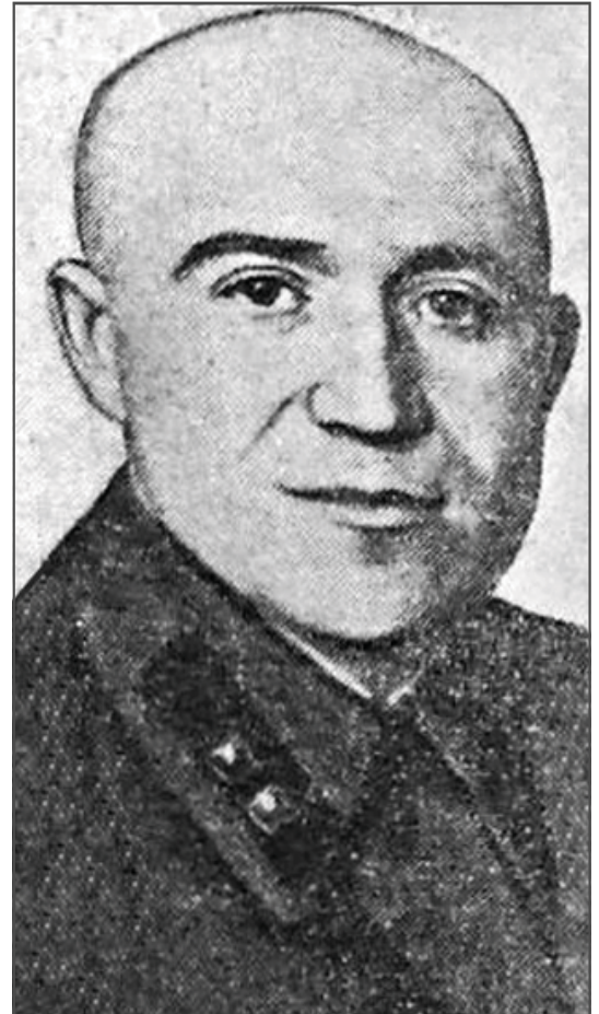
Л. С. Аксельрод, газетне фото, грудень 1937 р.

“Ви все рівно не витримаєте всіх цих катувань та побиття, які застосують до Вас, все рівно нас всіх розстріляють, і тому вигадайте яку-небудь легенду, дайте людей, чесних комуністів, які користуються авторитетом партійної організації, можливо цим самим ЦК швидше дізнається та надішле комісію на Україну”. Тут же він мені сказав, що він особисто дав свідчення на 60 осіб. Коли я у нього спитав: “Ці люди, на яких Ви дали свідчення, вони що, є ворогами?”, то Герзон відповів: “Це – чесні комуністи, але я не зміг витримати подальшого биття і вирішив писати все, що хотілося слідству”. Я став казати Герзону: “Якщо це так, як Ви говорите, що це – чесні люди, то ви – падлюка, негідник і Ви дійсно справжній ворог”. У цю ж ніч 11 травня Герзон, сидячи зі мною у камері, кінчав життя самогубством, перерізав собі вену, але був пійманий вахтером. Коли я спитав у Герзона: “Чому він це зробив?”, Герзон відповів, що “я лишив 1000 сиріт і вдів, мене це мучить і не хочу більше жити”» 127 .