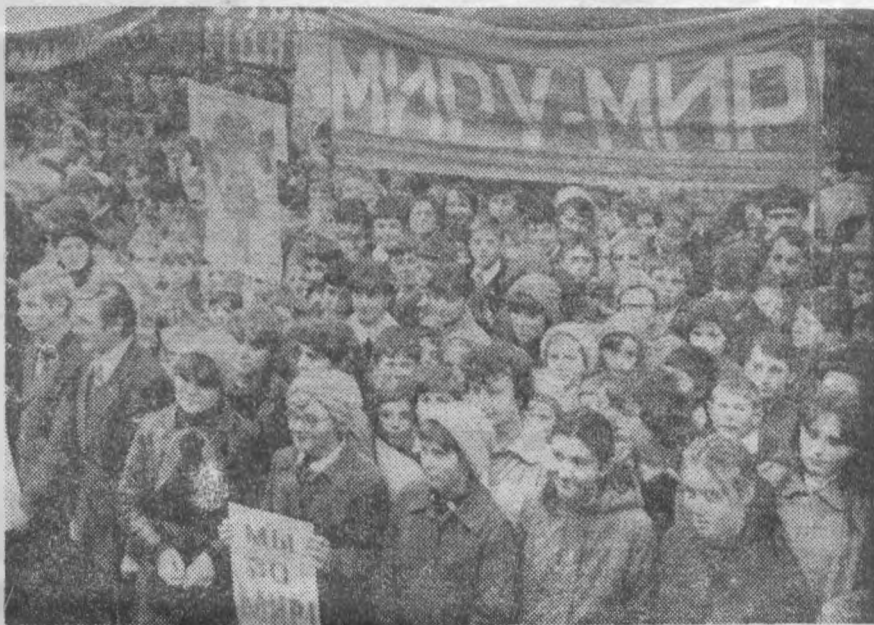
ШКОЛЯРИ ОБЛАСНОГО ЦЕНТРУ ГОЛОСУЮТЬ ЗА МИР НА ЗЕМЛІ.