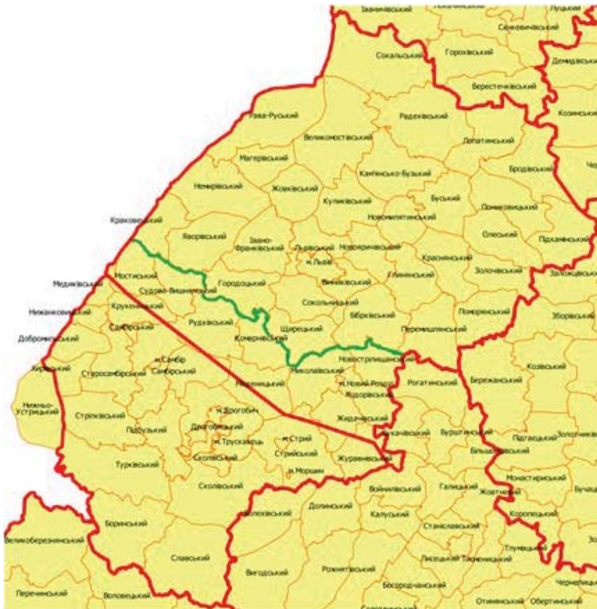
Невідповідність межі Львівської та Дрогобицької областей (червона лінія – хибна межа, нанесена програмістами, зелена – справжня межа).