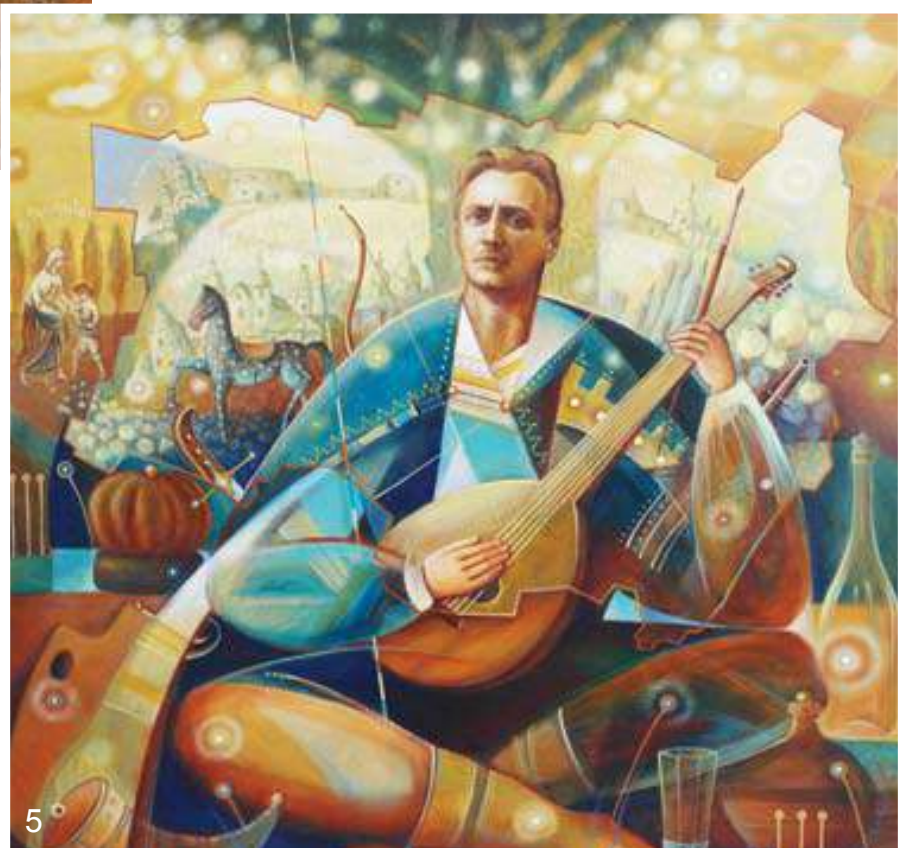
5. Микола Шевчук. Тербовлянський Мамай. 2015 р. ДСП, акрил