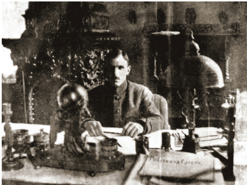
Військовий міністр УНР Олександр Жуковський (1918 р.)

Тим часом 27 січня (9 лютого за н. ст.) 1918 р. у Бересті (Бресті-Литовському) делегація Центральної Ради уклала з представниками Центральних держав (Німеччина, Австро-Угорщина, Болгарія, Туреччина) Мировий договір, а 30 січня (12 лютого) уряд УНР звернувся до німецької сторони з проханням ввести на терени УНР свої війська 9 . Тож невдовзі в Україну вступило 450-тисячне німецьке й австро-угорське союзницьке військо.