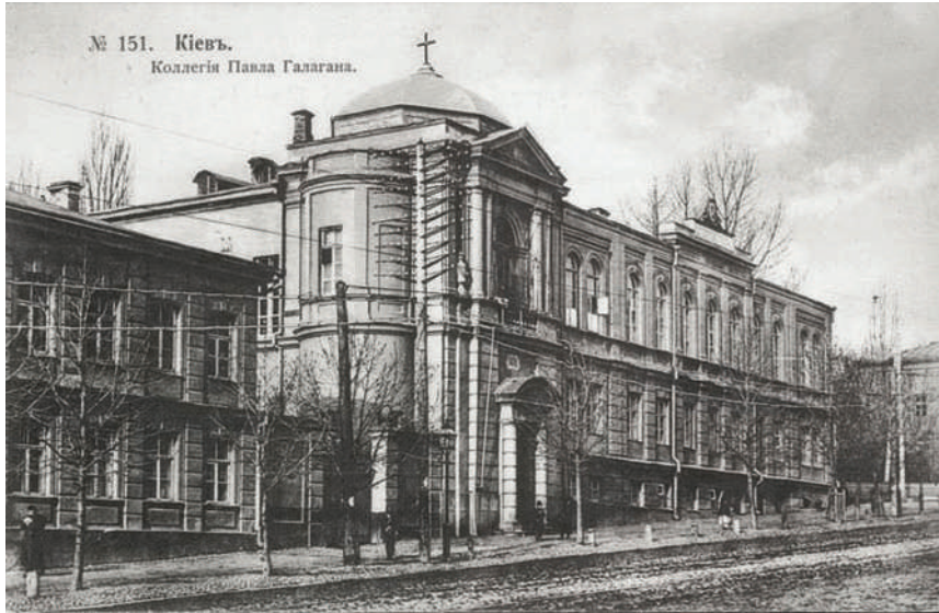
Будівля Військового міністерства УНР