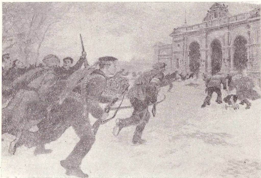
Бій червоногвардійців з гайдамаками. Взяття вокзалу (січень 1918 року.) (З картини художника Б. Муцельмахера).

В дні січневого повстання мені доручили видавати загонам Червоної гвардії зброю. За один день 14 січня видав щось 1500 гвинтівок, бо в нас уже на той час був свій «арсенал». Його створили робітники, що захопили зброю з військових складів на Миколаївському шляху. Зброя була нова, французького зразка. Привезли також чимало американських кулеметів системи Кольт.