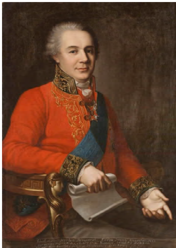
Рис. 2. Портрет Валеріана Стройновського. Невідомий художник XIX ст.