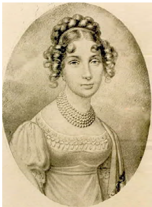
Рис. 9. Портрет княгині Іоанни Грудзінської.

Художник Валерія Тарновська, 1803 р. Національний музей у Варшаві.