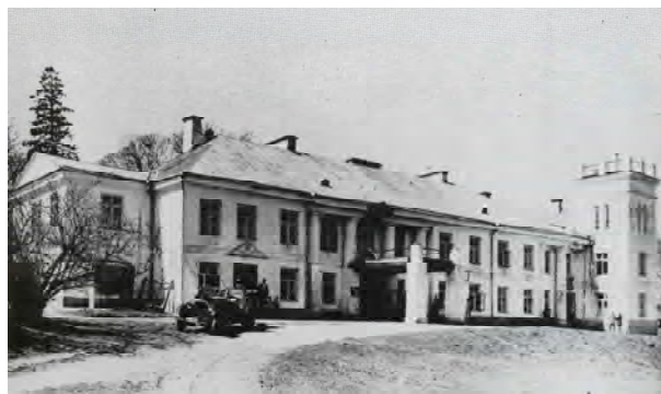
Рис. 6. Палац в Горохові після відбудови. Фотографія 1925 р.