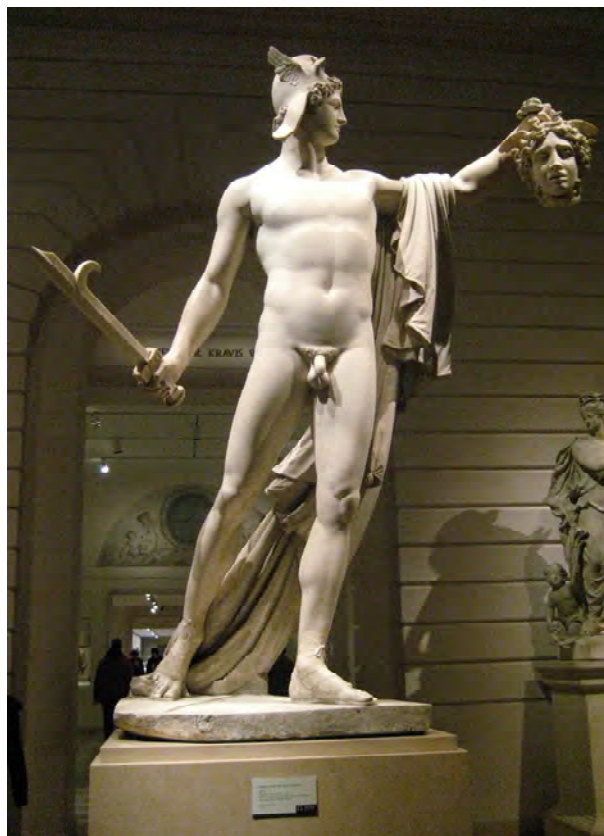
Рис. 9. Персей з головою Медузи. Скульптура Антоніо Канови. Музей Метрополітен, Нью-Йорк. З 1806 року прикршала палац В.Стройновського в Горохові.