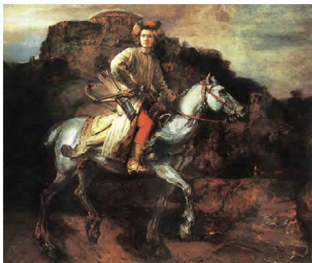
Рис. 7. Польський вершник. Картина Рембрандта, 1655 р.

З 1821 по 1834 рік картина була прикрасою картинної галереї палацу В.Стройновського в Горохові.