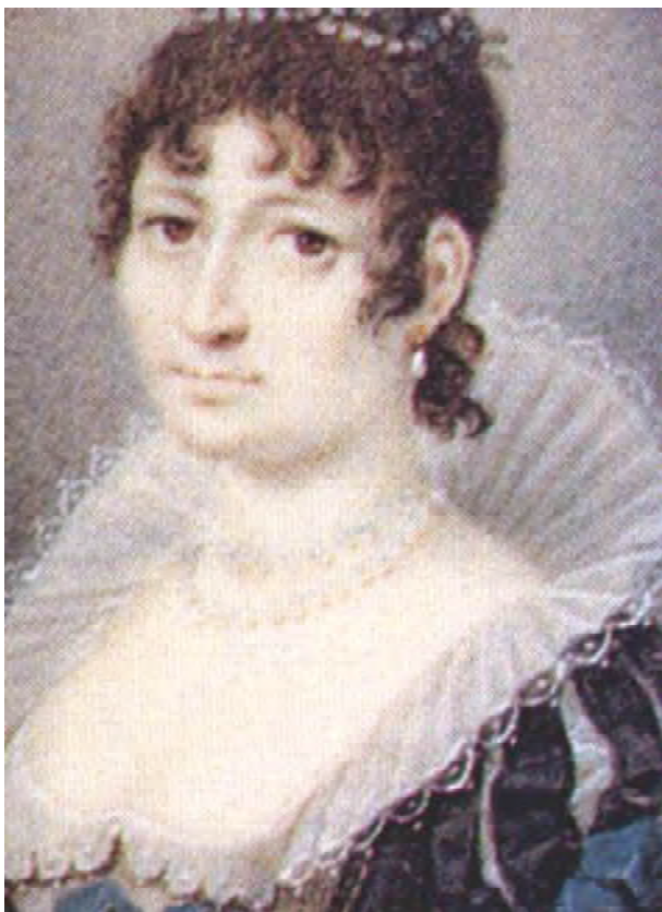
Рис. 10. Портрет графині Маріанни дель Кампо. Художник Валерія Тарновська.