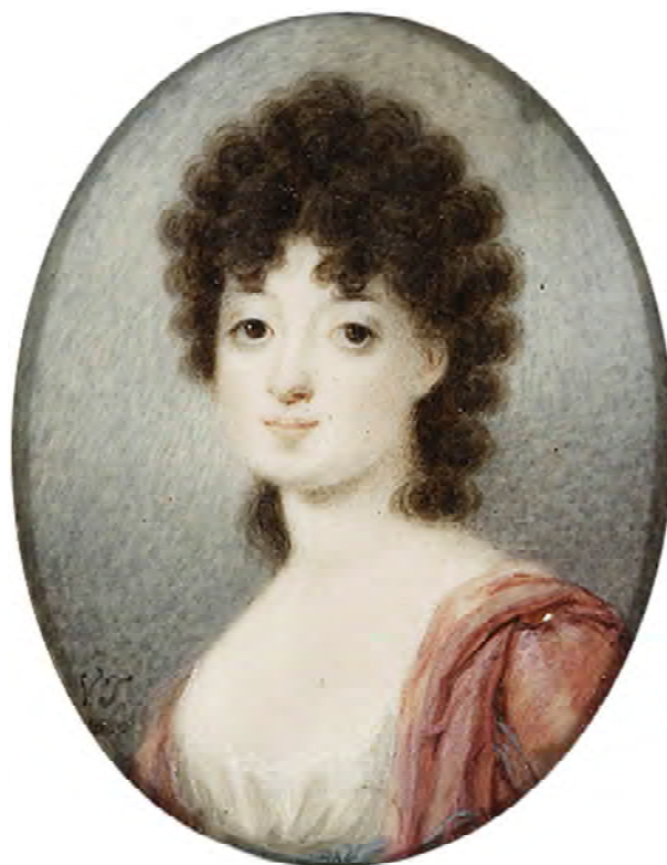
Рис. 8. Портрет княгині Софії Замойської (Чарторийської).

З 1821 по 1834 рік картина була прикрасою картинної галереї палацу В.Стройновського в Горохові.