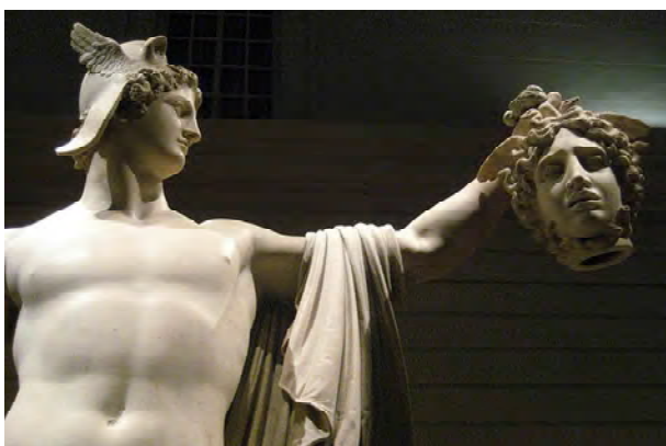
Рис. 10. Персей з головою Медузи. Скульптура Антоніо Канови.