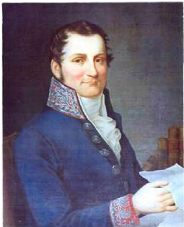
Рис.3. Ян Фелікс Тарновський. Портрет невідомого художника XIX ст.