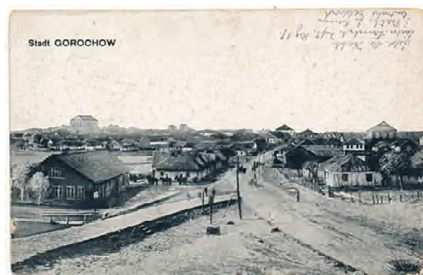
Рис. 4. Горохів. Вдалині зліва – костел, в центрі – лікарня, справа – синагога. Видано у 1917 р. Verlag Wehrmann, Bruckmann, 3