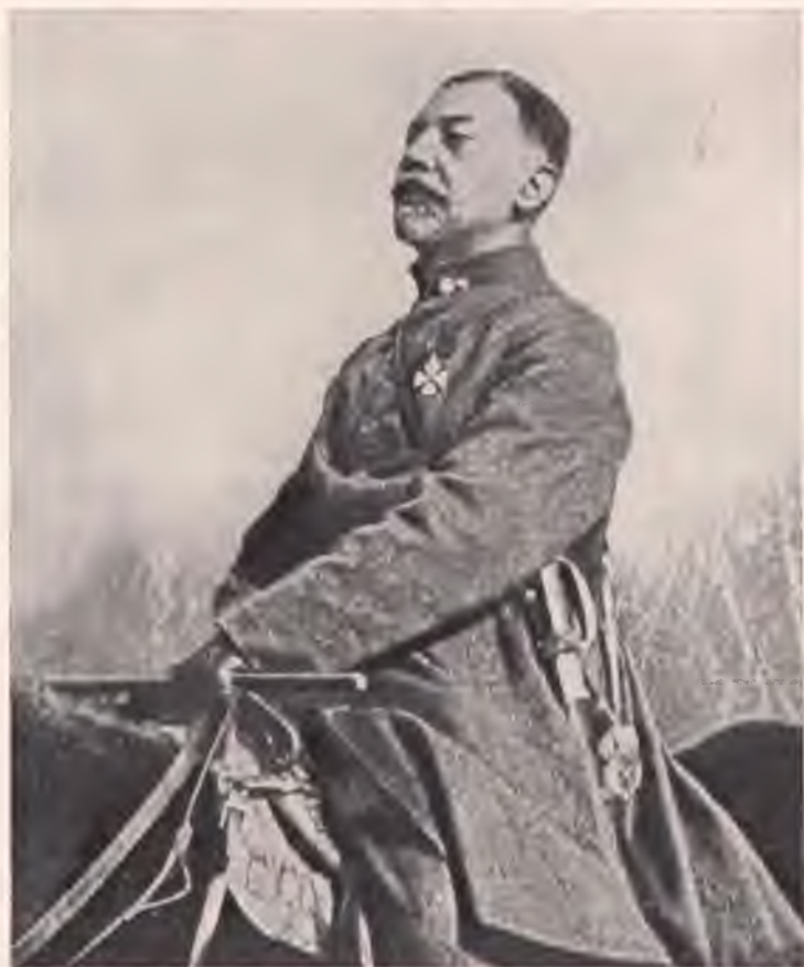
Командир Синьої дивізії генерал-поручник ЗЕЛІНСЬКИЙ на молебні в Києві після приходу дивізії в Україну.