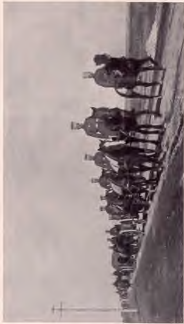
Артилерія СИНЬОЇ ДИВИЗІЇ в поході.