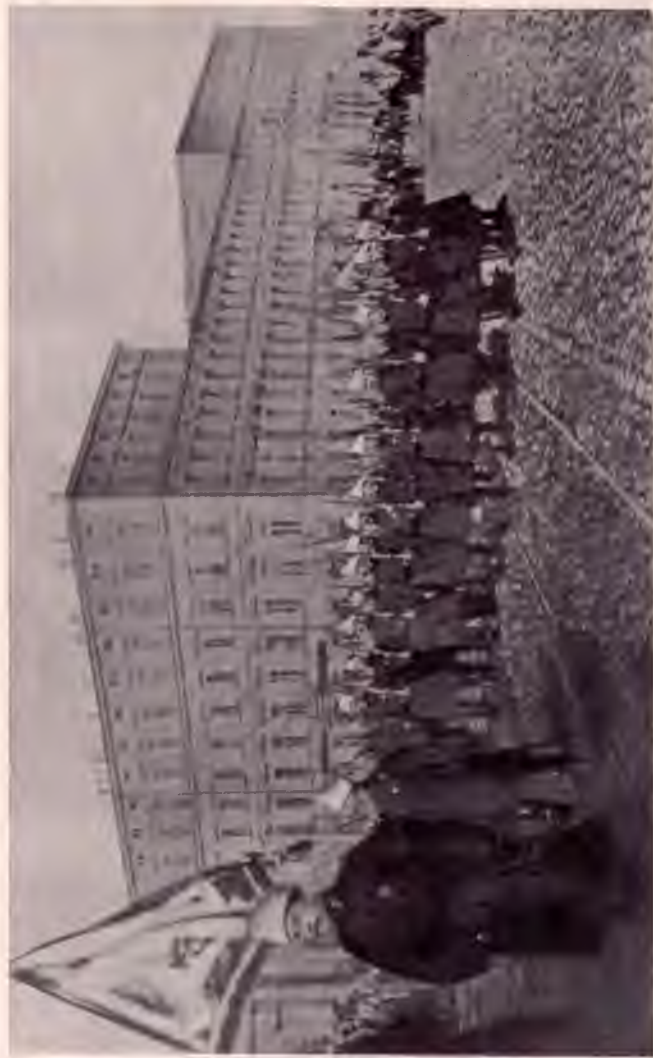
Дефілада СИНЬОЇ ДИВІЗІЇ в Києві після приходу її в Україну.