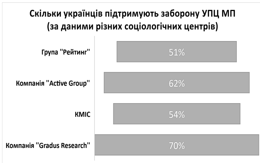
Рис. 2. Дані соціологічних досліджень, що стосуються підтримки заборони діяльності УПЦ МП