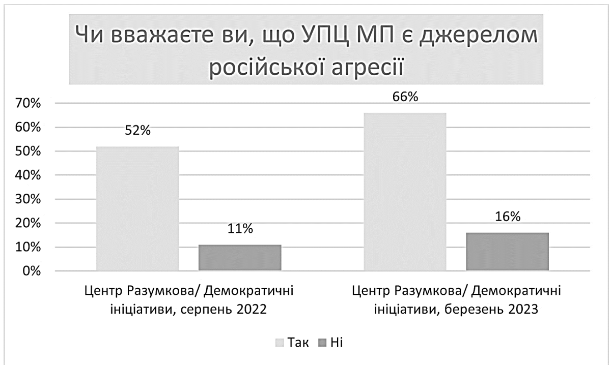
Рис. 3. Дані соціологічних опитувань щодо ставлення до УПЦ МП як до джерела російської агресії в 2022–2023 рр.

У березні 2023 р. Фонд «Демократичні ініціативи» та Центр Разумкова реалізували ще один спільний проєкт – «Символи, події та особистості, які формують національну пам'ять про війну з Росією». Респондентів, зокрема, запитали, чи погоджуються вони з тим фактом, що УПЦ МП сприяла російській агресії (рис. 3). Категорично ствердну відповідь на це запитання дали 40 % опитаних, іще 26 % вибрали опцію «скоріше згоден, ніж не згоден» 33 . Отже, сумарний показник становив 66 %. Наприкінці літа 2022 р. він був на 14 % меншим.