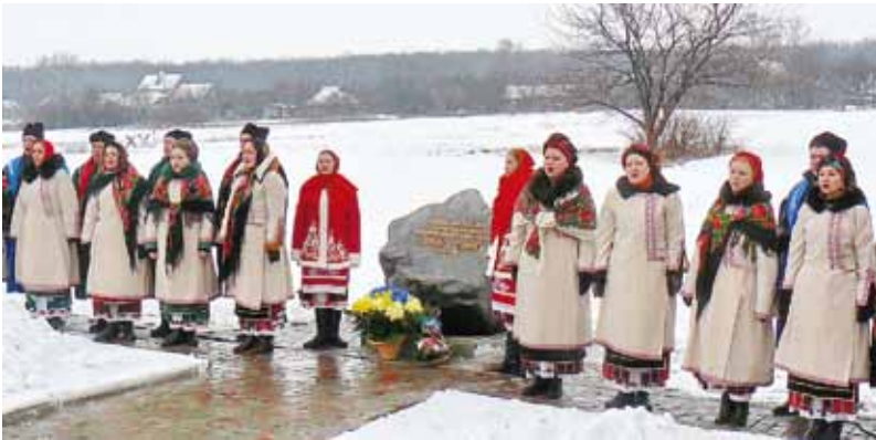
На вшануванні пам'яті Самійла Величка. Село Жуки. 2017.