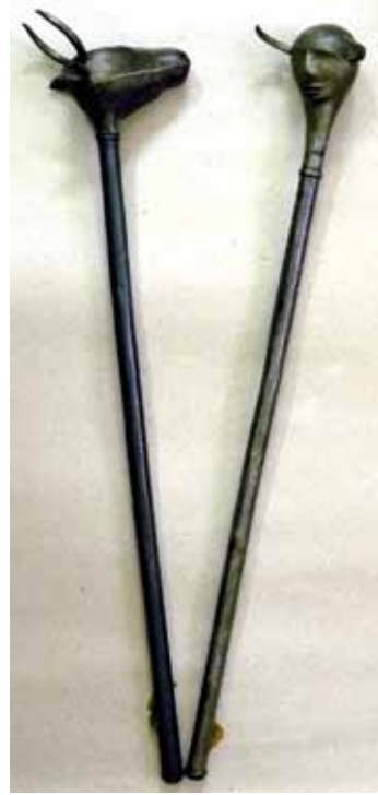
До статті Тамири Кондратенко, Наталії Кондратенко «Пернач і буздиган: зброя та інсигнії влади»: Булави у формі голів бика і шайтана. XVII–XVIII ст. Іран. Залізо.