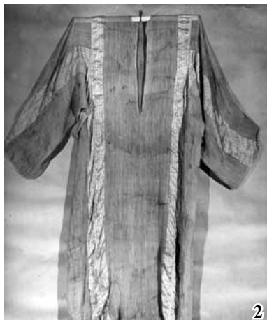
До статті Марини Кондратенко, Романа Прохватаїла, Ірини Тарасу « На- тільна сорочка В. Л. Кочубея (з історії одного унікального експонату) »: Рис. 1. Сорочка В. Л. Кочубея до реставрації. Рис. 2. Перед сорочки після реставрації.