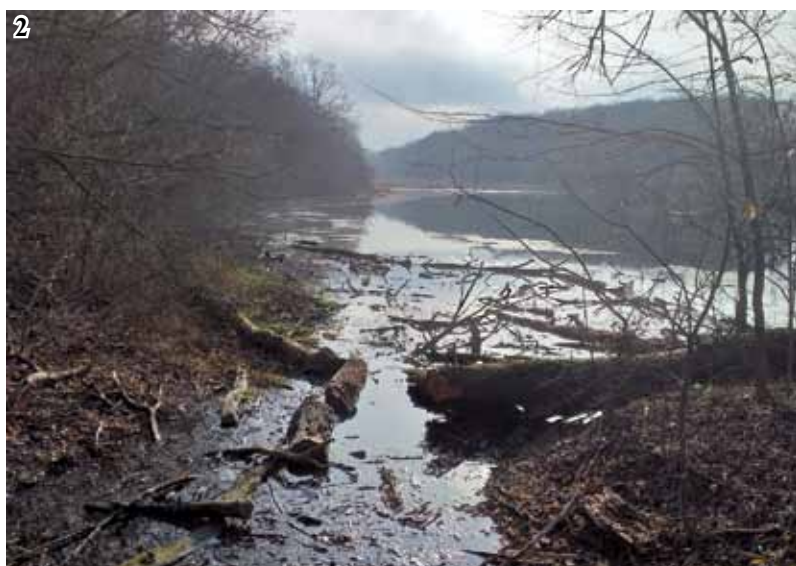
До статті Олени Шиян, Алли Лавріненко «Соколій байрак»: осінні сторінки польового щоденника (із природничих досліджень у с. Жуки): Рис. 1. Ставок № 1. Рис. 2. Ставок № 2. Листопад 2019 р.