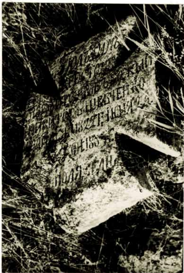
Хрести на козацькому цвинтарі в с. Шестерня.