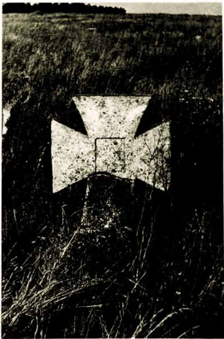
Хрести на козацькому цвинтарі в с. Шестерня.