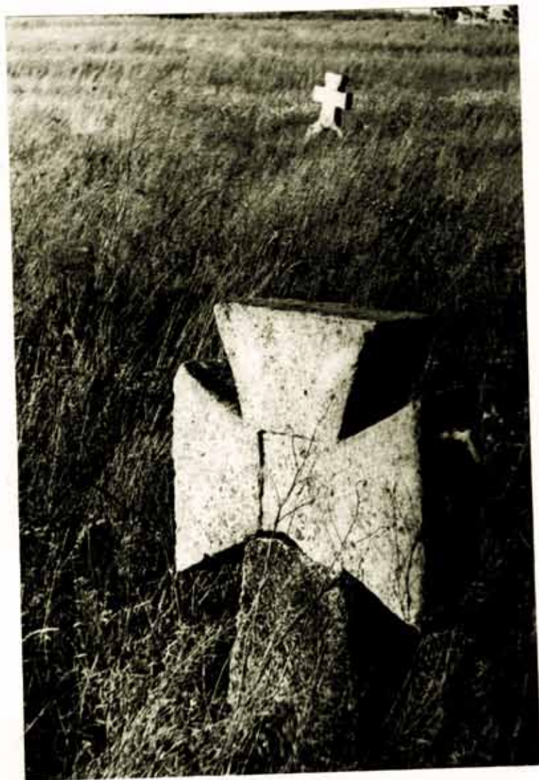
Хрести на козацькому цвинтарі в с. Шестерня.