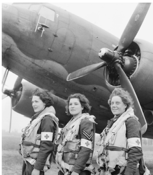
Рис. 24. Перші санітарки ЖДПС, відібрані для служби в повітряній швидкій допомозі на території Франції. 577

На початку 1943 р. кількість членкинь ЖДПС становила 16% від загальної кількості Королівських ВПС 578 . У липні 1943 р. в організації налічувалося 181 835 членів 579 . Багато з них здобуло відзнаки за зразкову службу 580 . Членкині ЖДПС не служили льотчицями. Лише механікині двигунів та обладнання могли здійснювати польоти для тестування, а також санітарки повітряних госпіталів (рис.24) 581 .