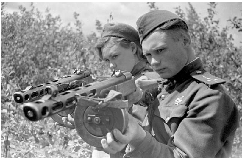
Рис. 11. Автоматники однієї з частин Калінінського фронту на вогневій позиції. 1941–1943 рр. 492 .