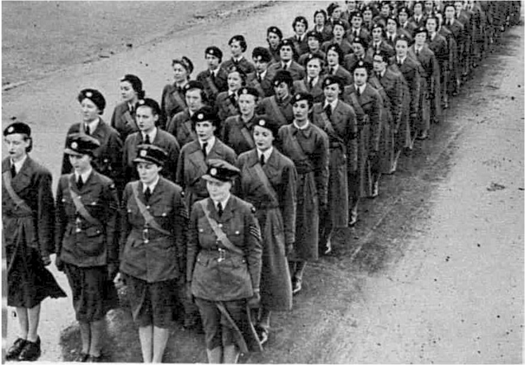
Рис. 21. Парад членкинь ЖДПС під час інспектування керівництвом 568 .

офіцерів ЖДПС на північному заході Англії, а також приватних розмов із командирами військових підрозділів, у яких служили жінки з допоміжних служб, лорд Р. Вінстер порушив у Палаті лордів питання щодо програми їхнього навчання. Вінстер зазначив, що, за його даними, вона є надто широкою й не відповідає основній цілі – підготовці фахівчинь для військових потреб. Він зазначив, що, згідно з публікацією в газеті про школу для офіцеров ЖДПС на північному заході Англії, там викладалися «... курси, що включали історичний розвиток у ХІХ та ХХ ст., мистецтво, літературу, музику...». У зв'язку з цим лорд поцікавився в заступника державного секретаря військово-повітряних сил, чи може він запевнити, що програми згаданої та решти шкіл із підготовки жінок до служби в збройних силах будуть переглянуті відповідно до цілей такої підготовки. На що отримав відповідь, що такі програми вже були схвалені компетентними органами. А курси, присвячені культурі, займають лише одну годину з 56-ти на тиждень, і такі «... предмети як мистецтво, ремесла, музика та історія мають на меті допомогти тим, хто хоче стати офіцерами, ладнати з підлеглими в найбільш ефективний спосіб. Мета полягає в тому, щоб показати їм, як вони можуть зацікавити підлеглих і виявити їхні найкращі риси» 569 .