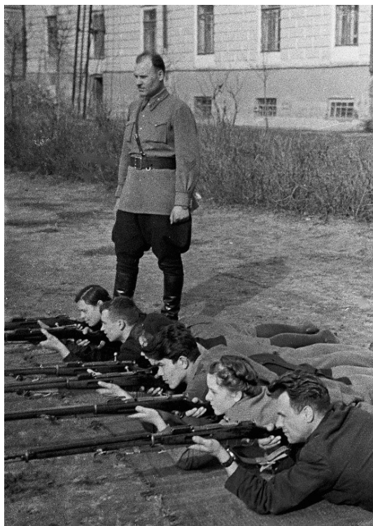
Рис. 1. Підготовка «Ворошиловських стрільців» 2-го ступеня в Харківському педагогічному інституті 310

У мирний час членкині ДТС мали пройти щонайменше 10 вишколів на рік та взяти участь в одному спеціальному польовому навчанні тривалістю 7–15 днів 311 . Платня добровольців становила 2/3 від оплати чоловіків на аналогічних посадах. Як зазначає К. Гарріс, на перших порах до ДТС не набирали громадянок інших держав, побоюючись, що серед них можуть бути шпигунки. Після початку війни від цього правила частково відійшли. Крім того, було заборонено приєднуватися до організації працівницям урядових установ, медсестрам Добровільних допоміжних загонів, жінкам, які служили в Цивільній групі протиповітряної оборони або мали досвід роботи в науковій, технічній сферах, були висококваліфікованими працівницями заводів 312 , позаяк вважалося, що більше користі державі вони принесуть під час виконання обов'язків на своїх місцях роботи чи служби.