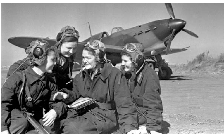
Рис. 29. Група радянських льотчиць на одному з військових аеродромів. 1942 р. 611 .