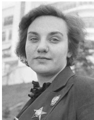
Рис. 33. Льотчиця В. Гризодубова. 1938 р. 616 .

Герой Радянського Союзу, В. Гризодубова (рис. 33) з березня 1942 р. керувала 101-м полком авіації далекої дії. Вона зробила значний внесок під час боїв за оборону Києва, доставивши в місто радіостанції для підпальників, які використали їх для підривної роботи під час окупації 615 .