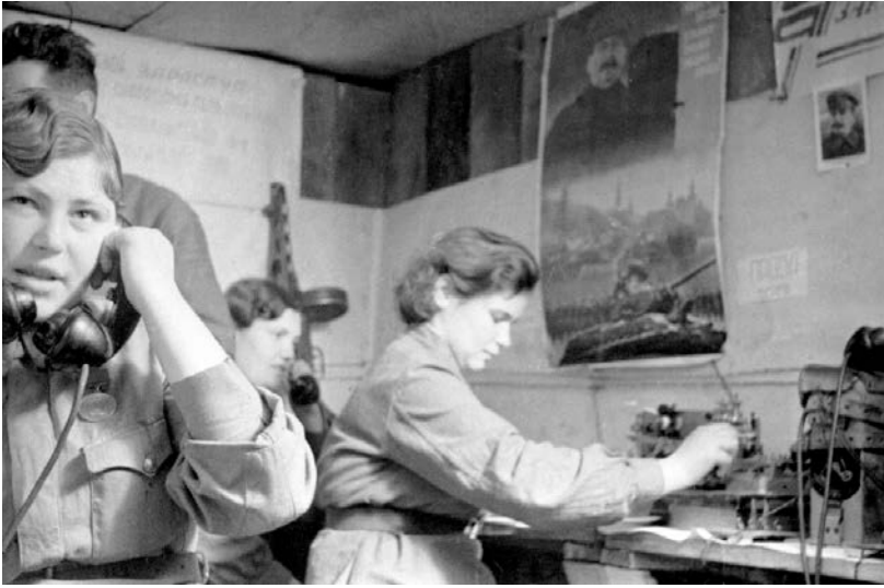
Рис. 18. Вузол зв'язку 62-ї армії. Сталінград. 1942–1943 рр. 532 .