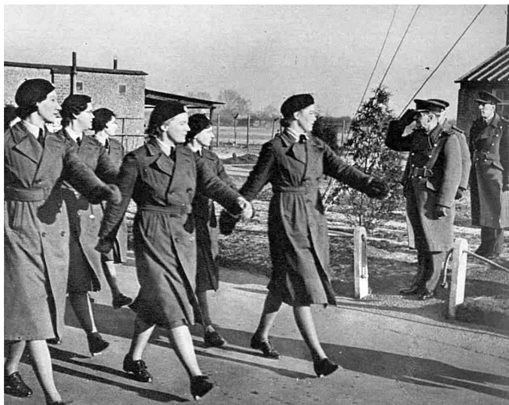
Рис. 20. Членкині ЖДПС марширують перед повітряним маршалом А. Лонгмором 567 .

Принагідно варто зазначити, що впродовж війни в суспільстві порушували питання щодо якості навчальних програм для підготовки жінок до служби в цій та інших організаціях у збройних силах Великої Британії. Так, на початку червня 1943 р., після виходу однієї зі статей щодо функціонування школи для