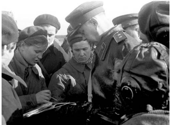
Рис. 26. Льотчиці 125-го жіночого бомбардувального авіаполку імені М. Раскової отримують бойове завдання на аеродромі Леонідово. 1943 р. 598 .

587-й жіночий полк бомбардувальників воював на пікірувальних бомбардувальниках Пе-2. За весь період німецько-радянської війни в полку на різних посадах служило 148 жінок (рис. 26) 597 .