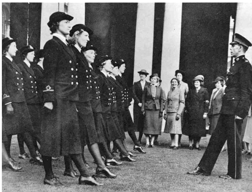
Рис. 35. Стройова підготовка офіцerek ЖКВМС сержантом військово-морської служби (Грінвіч) 621 .