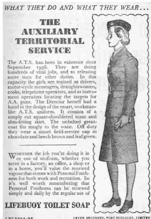
Рис. 48. Зразок замітки про членкинь ДТС 1066 .

Замітка про ЖДПС супроводжувалася зображенням жінки у формі цієї організації в повний зріст. У текстовій частині оповідалося про таке: «Жіночі допоміжні повітряні сили були засновані у 1939 р. До цього їхні членкині служили в компаніях Королівських повітряних сил при ДТС, що була створена 1938 р. Однак спеціалізований характер їхньої роботи призвів до створення окремої організації. Зараз ЖДПС є невід'ємною частиною Королівських повітряних сил. На початку війни в організації налічувалося тільки 5 посад для жінок. Зараз їх понад 60! Приваблива уніформа