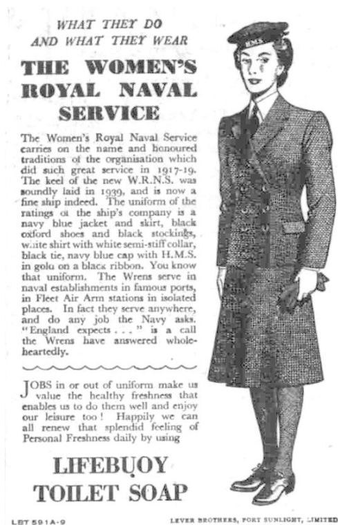
Рис. 50. Зразок замітки про членкинь ЖКВМС (1943) 1070 .

світлити вагомий внесок військовослужбовців та військовослужбовиць, у цьому матеріалі жінок називають «дівчатами з ДТС» («A.T.S girls»), а чоловіків, натомість, називають не «хлопцями» («boys»), а «чоловіками» («man»). Що саме по собі ставить жінок у субординовану позицію щодо їхніх колег чоловічої статі незалежно від посади та віку 1072 . На таке можна натрапити в британських газетах часів Другої світової війни доволі часто.