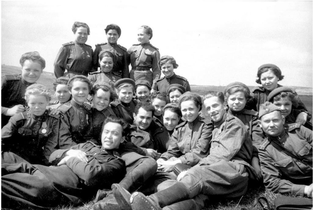
Рис.12. Снайперки 33-ї армії 2-го Білоруського фронту. Серпень 1944 р. 502 .