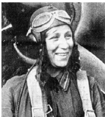
* Рис. 34. Льотчиця К. Зеленко, Герой Радянського Союзу (посмертно) 617.

Перший у світі повітряний «таран», здійснений жінкою, виконала заступниця ескадрильї 135-го ближньобомбардувального авіаполку К. Зеленко (рис. 34) 12 вересня 1941 р. Вона була збита при спробі посадити пошкоджений літак.