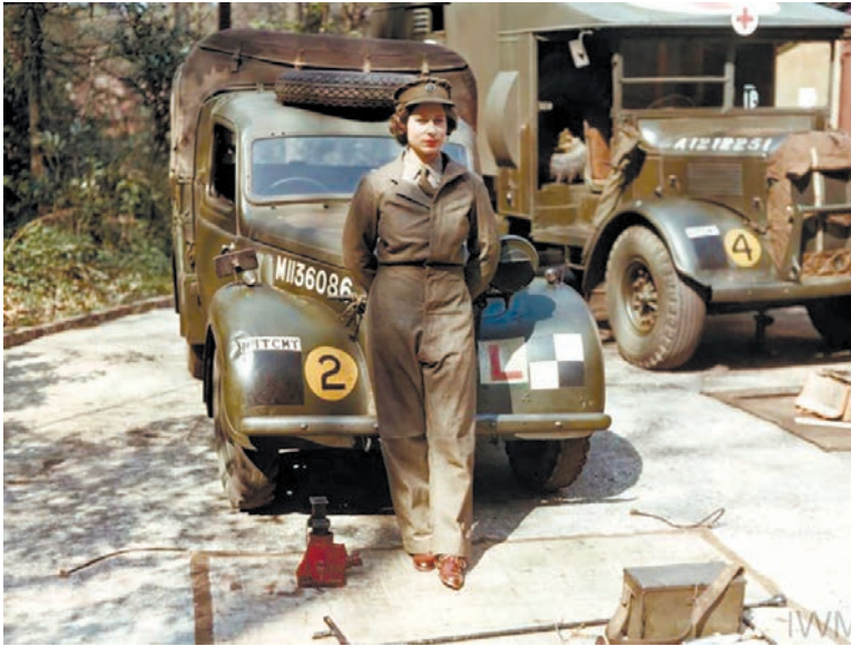
Рис. 46. Принцеса Єлизавета, друга субалтерн-офіцерка ДТС, під час навчання 737 .

силах: Діана – до Жіночої королівської військово-морської служби; Сара – до Жіночих допоміжних повітряних сил; Мері – до Допоміжної територіальної служби 736 . В останній служила і принцеса Єлизавета (нині – королева Великої Британії Єлизавета II) (рис. 46).