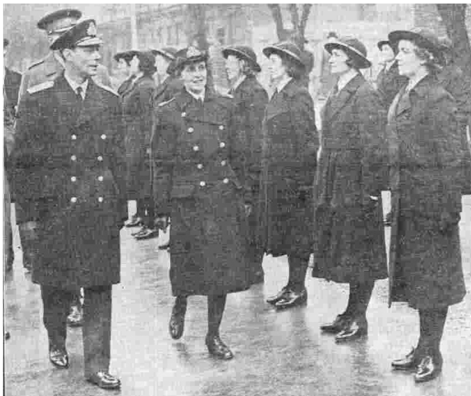
Рис. 47. Король оглядає представниць ЖКВМС під час візиту до казарми в Чатемі 21 лютого 1940 р. 957 .

Оскільки найменш привабливою в очах жінок виглядала служба в ДТС, де від початку створення почалися проблеми з організацією умов побуту її членкинь, уряд намагався підвищити її авторитет. Впродовж усієї осені 1939 р. в газетах публікувалися різні матеріали, а також фото зі служби жінок у ній – робочих моментів, на яких представлені доглянуті усміхнені британки, оглядин їхніх підрозділів представниками королівської сім'ї, відвідин парадів тощо (рис. 47) 956 .