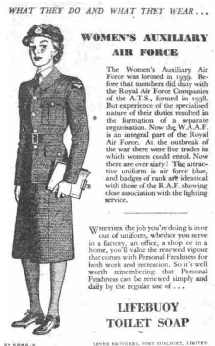
Рис. 49. Зразок замітки про членкинь ЖДПС (1943) 1068 .

синього кольору, а також розпізнавальні знаки є ідентичними до тих, що побутують у Королівських повітряних силах, і демонструють тісну асоціацію з належністю до бойової служби» (рис. 49) 1067 .