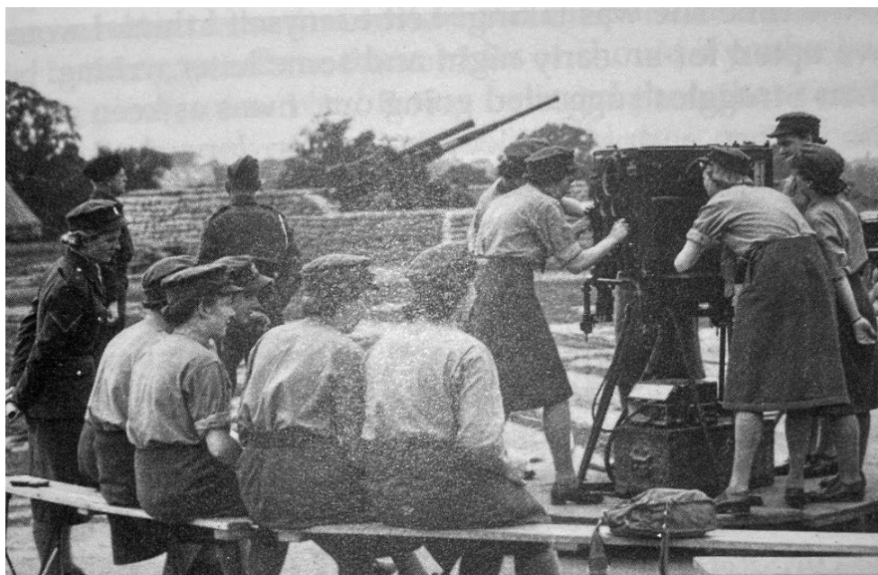
Рис. 8. Членкині ДТС під час навчання 442 .