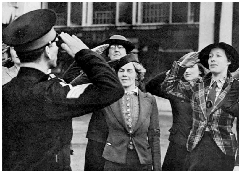
Рис. 36. Офіцери ЖКВМС на випробувальному терміні вчаться салютувати 622 .