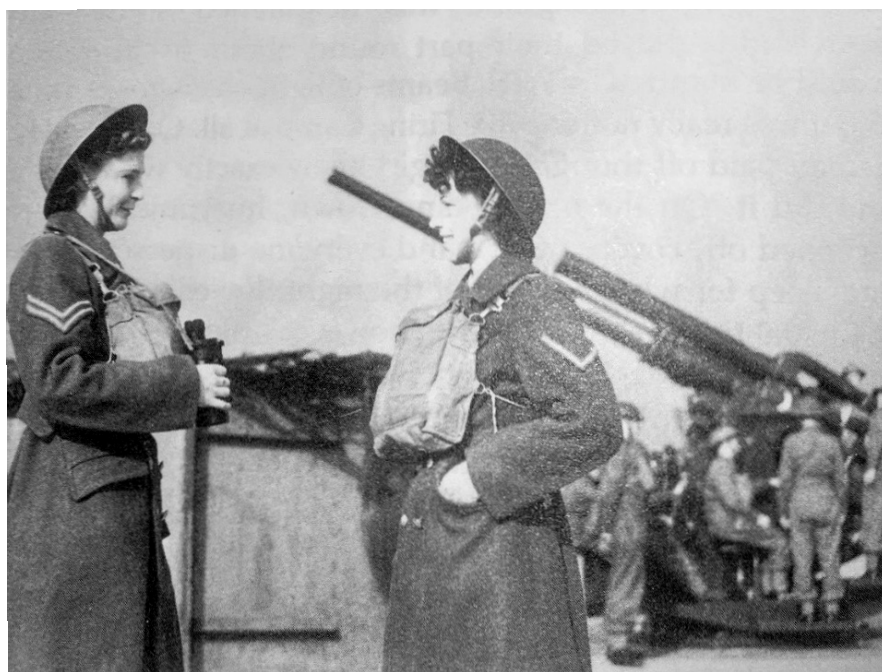
Рис. 9. Британські коригувальниці артилерійського вогню 443 .