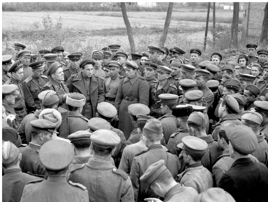
Рис. 45. Група демобілізованих радянських воїнів перед від'їздом додому. Закарпатська область. 1946 р. (праворуч у верхньому кутку – демобілізовані воячки Червоної армії) 702 .

Червону армію вчителями та викладачами всіх шкіл і навчальних закладів; в) студентів усіх вищих навчальних закладів другого і старших курсів (зокрема заочників), які не закінчили освіти у зв'язку з призовом до Червоної армії в період Великої Вітчизняної війни; г) які зазнали трьох чи більше поранень у Великій Вітчизняній війні; д) призваних на військову службу в 1938 р. і раніше й таких, що перебувають безперервно в Червоній армії 7 і більше років; е) всіх жінок рядового та сержантського складу, крім жінок-спеціалісток, які виявили бажання залишитися в Червоній армії на посадах військовослужбовців» 701 . Ця черга була демобілізована до кінця 1945 р. Наступні демобілізації тривали з 1946 до 1948 рр. і базувалися насамперед на віковій ознаці. Під них потрапляли й жінки, які з тих чи інших причин не були демобілізовані у 1945 р. (рис. 45).