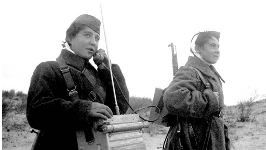
Рис. 17. Радистки однієї з частин 4-ї гвардійської стрілецької дивізії 21-ї армії Південно-Західного фронту на зв’язку. Жовтень-листопад 1942 р. 531 .

Значна кількість радянських жінок перебувала в складі військ зв’язку; вони становили 12% від загальної кількості їхнього кадрового складу 528 . Загалом до частин зв’язку мобілізували 41 886 жінок 529 . Вони активно заступали чоловіків у цьому роді військ. Навчали майбутніх фахівчинь для фронту в СРСР у військових училищах зв’язку, які діяли в Києві, Ленінграді, Куйбишеві, Сталінграді, Муромі, Орджонікідзе, Ульяновську, Воронежі. Також їх могли навчати в окремих запасних полках зв’язку, радіошколах, курсах радіофахівців. Як зазначає Ю. Іванова, «лише в комсомольсько-молодіжних підрозділах бійців-фахівців Всеобуча при наркоматі оборони було підготовлено 49 509 зв’язківців» (рис.17–19) 530 .