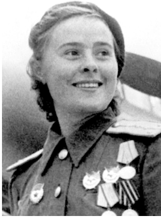
Рис. 27. Герой Радянського Союзу льотчиця М. Доліна. 599

Особовий склад цього полку виконував завдання вдень, зокрема, знищував оборонні споруди, вогневі точки, техніку, живу силу ворога. Одна з найвідоміших авіаторок цього полку – Герой Радянського Союзу М. Доліна (рис. 27). Впродовж війни здійснила понад 200 бойових вильотів, втративши лише одну бойову машину. У червні 1944 р. їй вдалося на пошкодженому літаку завершити завдання й долетіти до аеродрому, не втрачаючи місця в строю.