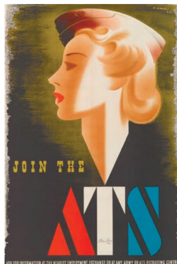
Рис. 3. Один із плакатів із закликом приєднатися до ДТС, розроблений А. Геймсом та випущений у 1941 р. Яскравий образ членкині ДТС породив чимало критичних зауважень та обвинувачень у невідповідності цього образу реальним завданням, що стояли перед членкинями організації 345 .