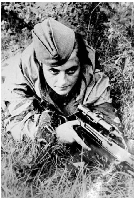
Рис.13. Снайперка Людмила Павличенко на позиції 503 .