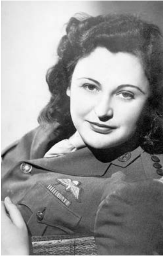
Рис. 41. Світлина Ненсі Вейк, зроблена у 1945 р. 672 .

Пізніше, у жовтні 1941 р., вона продовжила свою діяльність у Швеції. Там вона завербувала нових агентів і відновила зв'язок із фінською розвідкою, втрачений після радянсько-фінської війни (1939–1940) 674 .