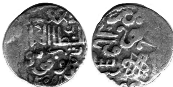
Рис. 2. Фотозображення данга хана Тимур-Кутлука, Орду ал-Джедіда, 800 р.х.

На Рис. 2 наведено фотозображення такого ж данга з краще видимою лівою частиною реверсу. Необхідно відзначити, що літери \text{و} та \text{د} в центрі написані в лігатурі, слово \text{سنة} розташоване над \text{يد} , у самому низу реверсу розміщено позначення року \text{٨٠٠} .