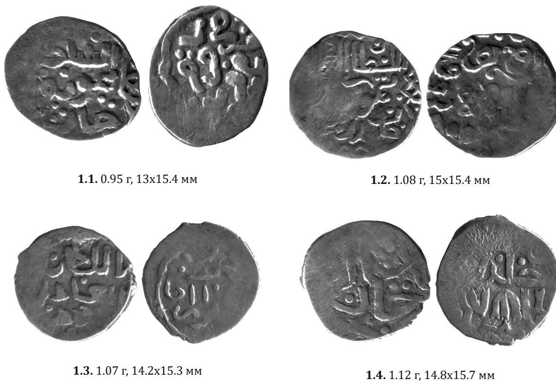
Рис. 1. Данги ханів Тимур-Кутлука та Пулада, знайдені під Богодуховом

Данги комплексу репродуковані на Рис. 1 , там же наведено їх вагові дані та розміри.