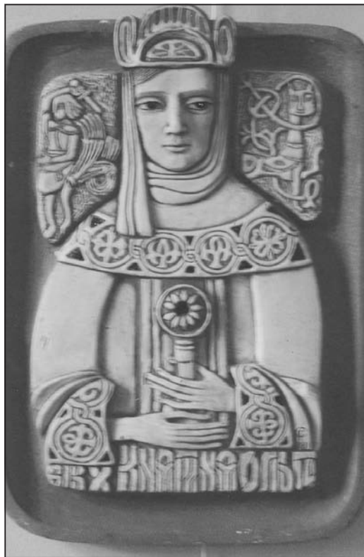
Галина Севрук. Княгиня Ольга. Кераміка. 1981

лення. Цитую за оригіналом для особливо «обдарованих» в Україні: «Українці бояться розстворитися в руском, и, определяясь со своей национальной идентичностью, делают резкие движения. Русская культура имеет мощное влияние на украинскую, и этого нельзя отрицать. (Послушайте, який надвагомий аргумент наводиться! — П.М.). Ведь на украинском книжном рынке, к примеру, русский язык доминирует».