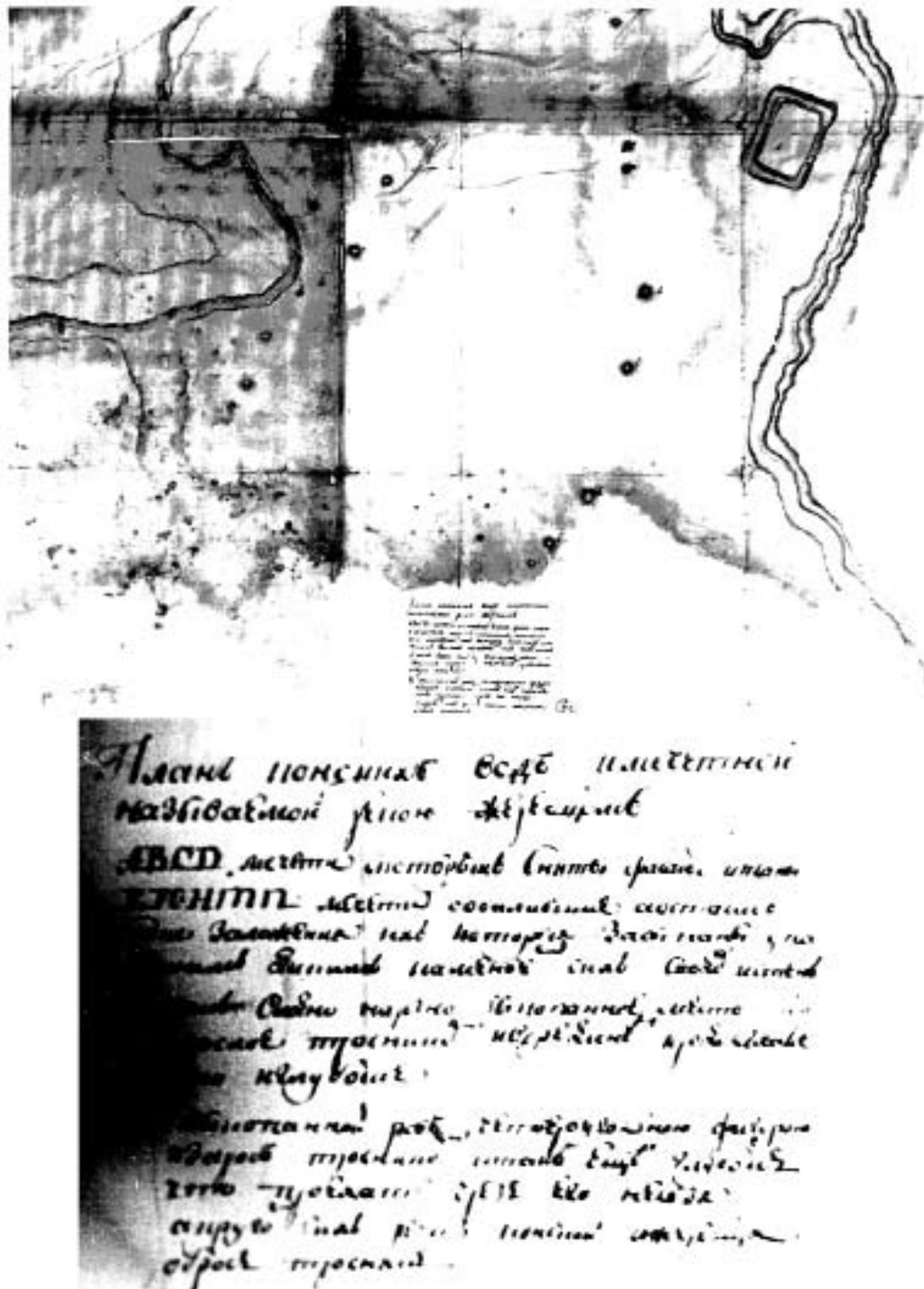
Рис. 3. Карта «План Конских вод и Мечетной, называемой речкой Жеребец» (перерисовка, ЦГВИА, ф. ВУА, № 23897)

Если на первом плане показано 38 мечетей, для четырех из которых, как указывается в экспликации, еще были составлены планы расположения постройки и сделаны зарисовки общих видов их фасадов, а основания стен шести обвалившихся мечетей были засыпаны упавшим битым камнем со сводов и со стен, то в 1770 году против заложенной там крепости, отмечалось надписью только «пять мечетей» (10), а после переноса места возведения Никитинской крепости на новое