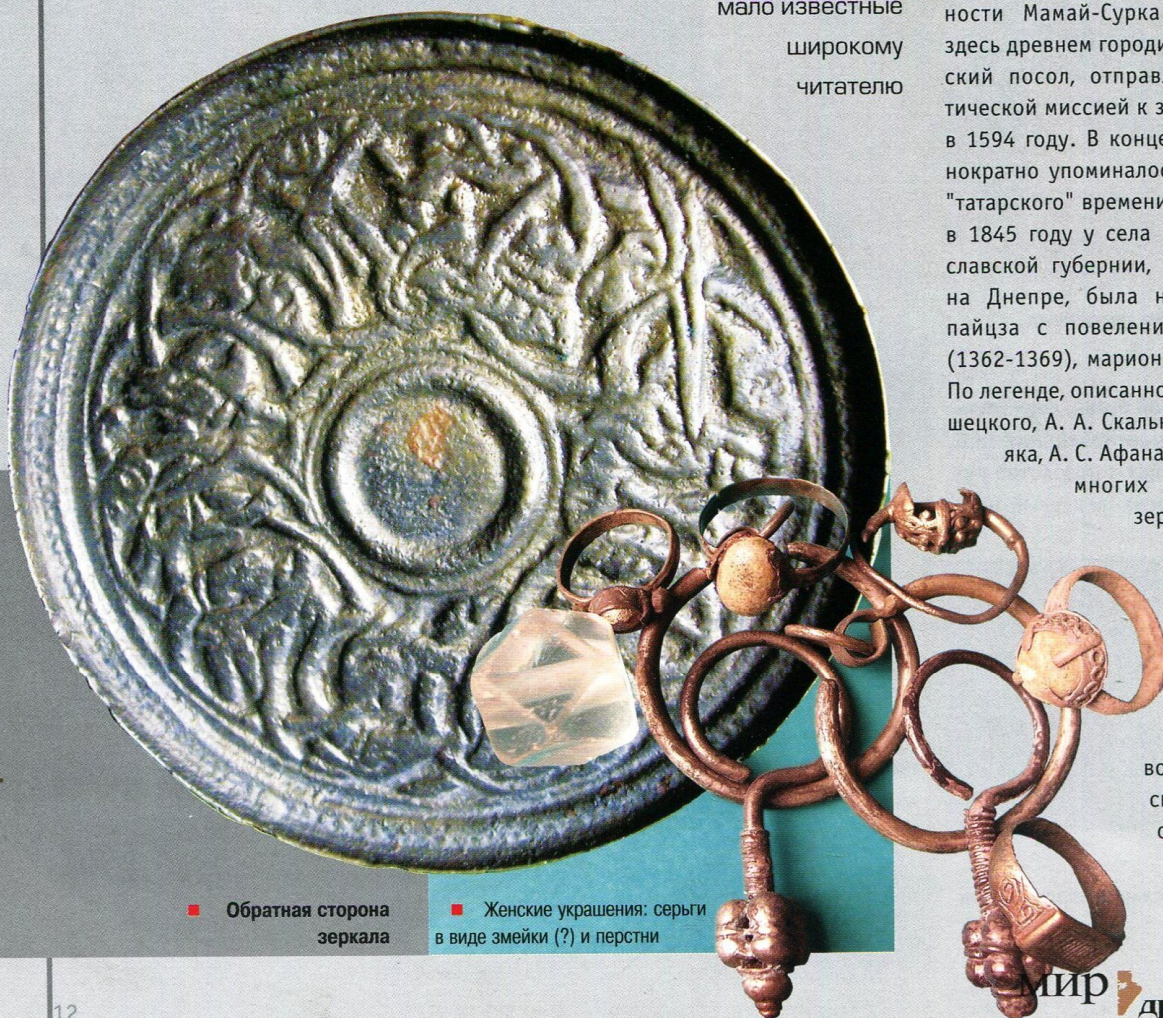
■ Обратная сторона зеркала

Первые письменные упоминания о местности Мамай-Сурка и расположенном здесь древнем городище оставил австрийский посол, отправленный с дипломатической миссией к запорожским казакам в 1594 году. В конце XVIII-XIX вв. неоднократно упоминалось о находках вещей "татарского" времени в этом регионе. Так, в 1845 году у села Грушевка Екатеринославской губернии, во время половодья на Днепре, была найдена серебряная пайцца с повелением хана Абдуллаха (1362-1369), марионетки темника Мамаю. По легенде, описанной в работах С. И. Мышецкого, А. А. Скальковского, Н. Вертильяка, А. С. Афанасьева-Чужбинского и многих других, на Белозерском лимане некогда находился цветущий город, которым правила "франкская" царица-христианка Сурка-Белозерка. Пришедший с востока хан Мамай просил ее руки, но Сурка отказав ему, под покровом ночи на кораблях уплыла вниз по Днепру. Мамай