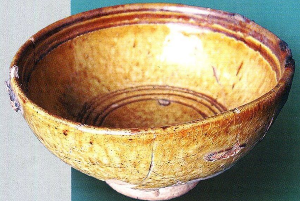
■ Миска на кольцевом поддоне