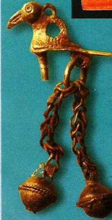
■ Шумящая подвеска