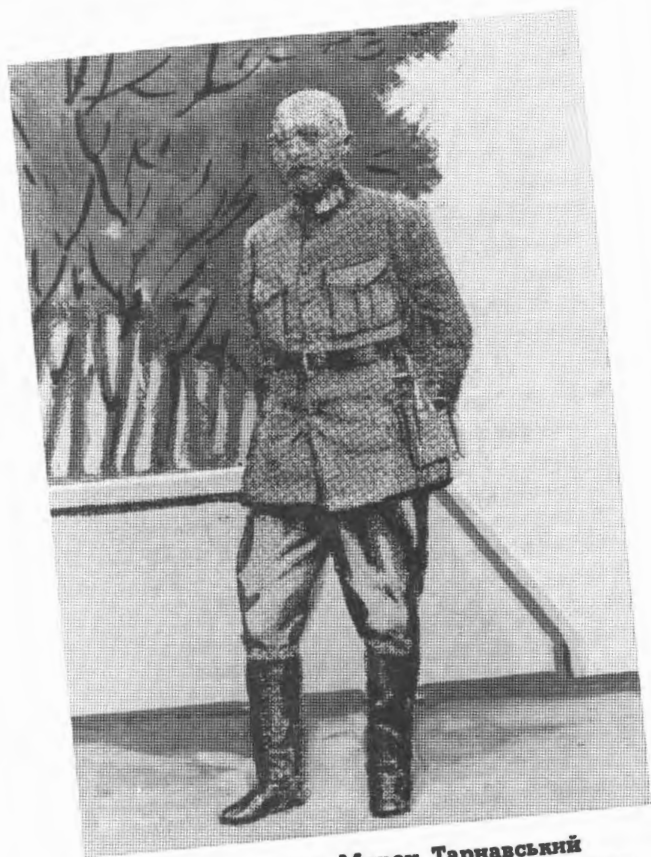
Генерал-четар Мирон Тарнавський під час походу на Київ у серпні 1919 року.