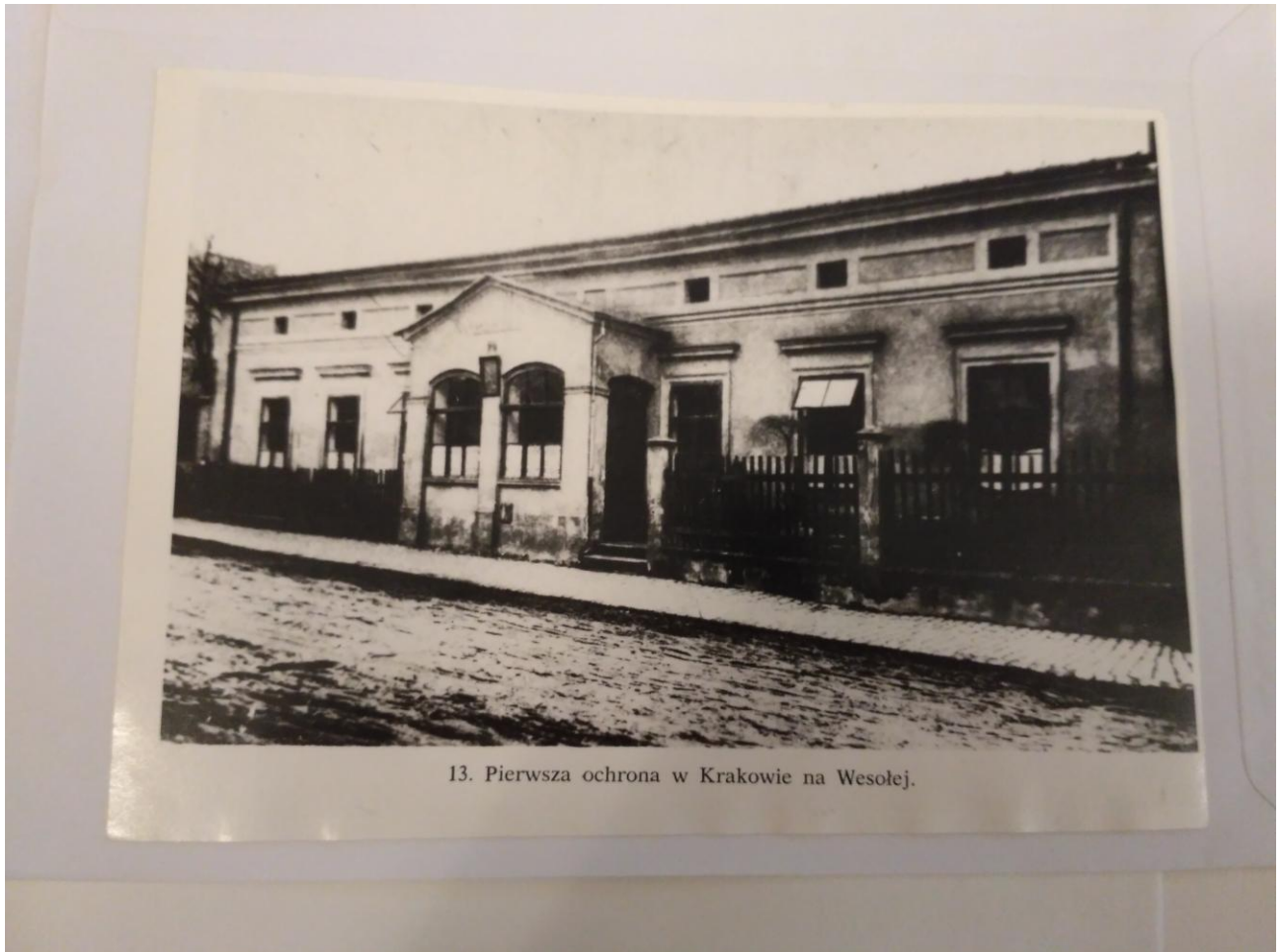
13. Pierwsza ochrona w Krakowie na Wesolej.