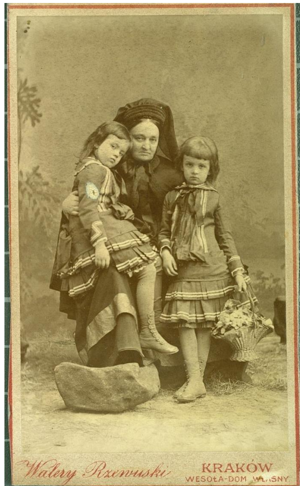
Катажина Потоцька з онуками, XIX ст.