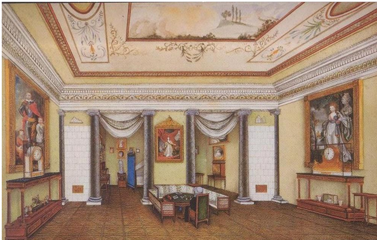
Палац Браницьких у Любомлі, 1837 рік.