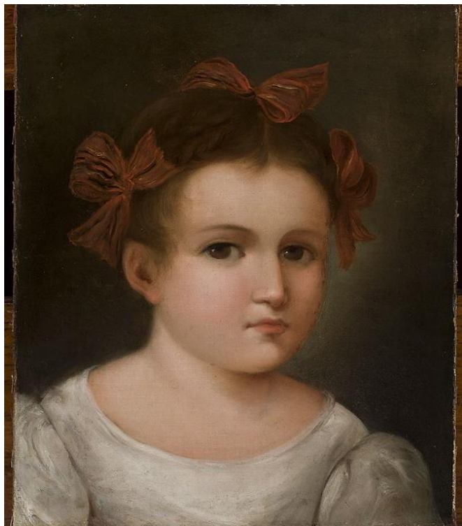
Катажина Потоцька в дитинстві, пер.пол. XIX ст.