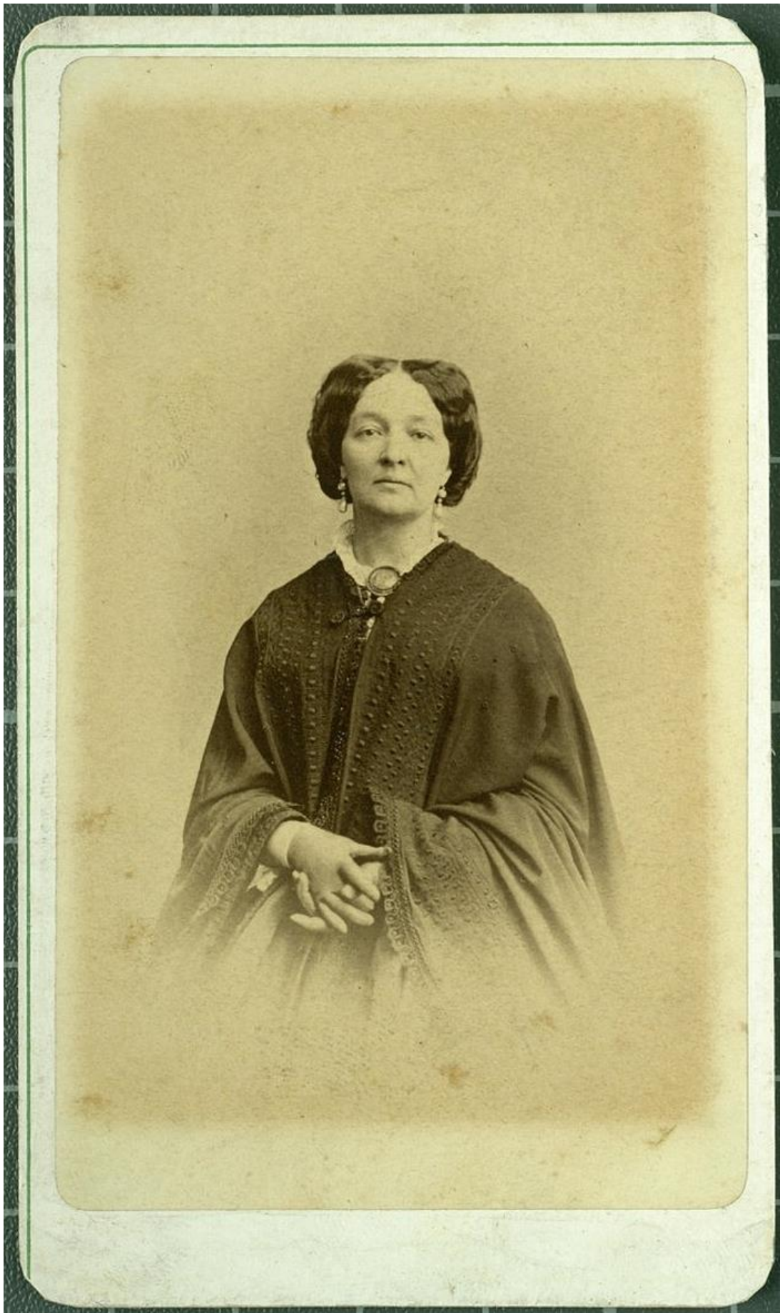
Катажина Потоцька, ХІХ ст.