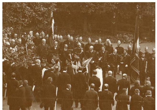
Похорон Катажини Браницької, м. Кшешовіце (сучасна Польща), вересень 1907 року.