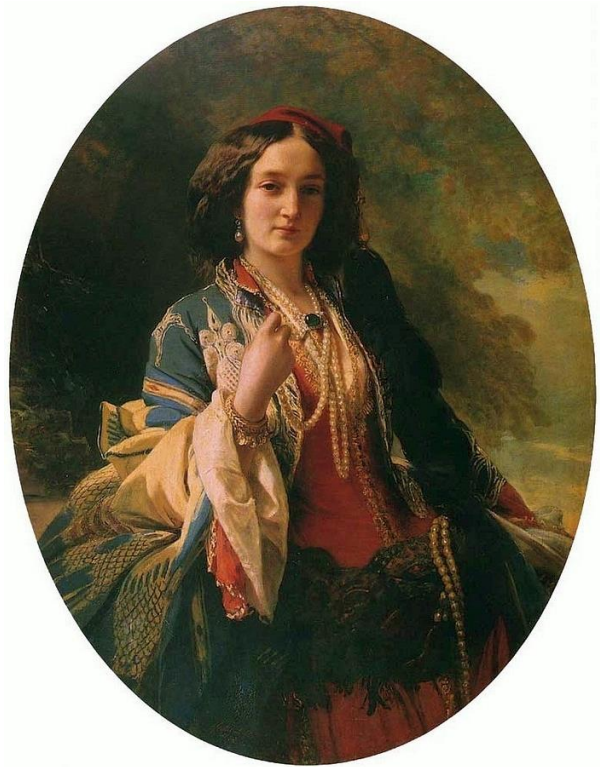
Катажина Потоцька, 1854 р., автор Франц Ксавер Вінтерхальтер