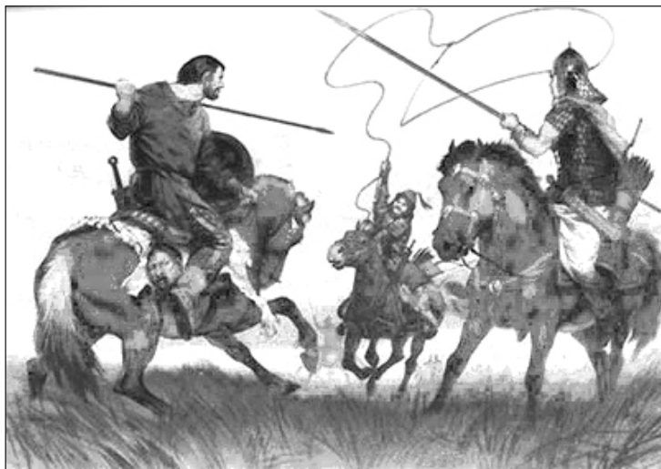
Мал. 3. Гунський воїн кидає ласо. Сучасний малюнок

Золоті накладки від них були знайдені протягом другої половини ХХ ст. в гунських елітних воїнських похованнях у Якушовицях, Печ-Усьозі й Багасеці (Угорщина). Аналіз цих знахідок подають Дж. Харматта [71, с. 111-118], Г. Ласло [75, с. 39-43], І. Ковриг [48, с. 7-10]. Зброєю ближнього бою гунам слугували мечі. Їх у