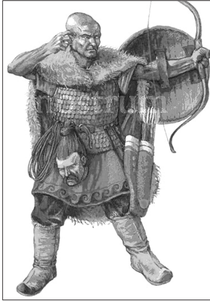
Мал. 2. Гунський воїн епохи Гуно-римської війни. Сучасна реконструкція

ефективна – 50-150 м [58, с. 279]) сприяли становленню тактики дистанційного бою. Означену тактику широко використовували в середині V ст. саме західні гуни. Вчені-археологи, зокрема Дж. Лаїнг [74, с. 130] та Р. Ледлоу [73, с. 98], довели, що луки гунів могли пробивати обладунки з відстані у 100 м.