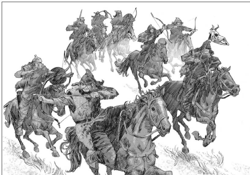
Мал. 8. Гунська кавалерія в атаці. Сучасний малюнок

складався не на користь гунів [17, Get. 198]. Амміан Марцеллін [3, XXXI, 8.4] подає детальний опис їхніх дій на полі бою. З його повідомлення можна виділити дві основні фази характерної тактики гунів: 1. початкова атака глибокою розсипною лавою, іноді – „клином” („ cuneatim ”), під звуки бойового кличу і з веденням інтенсивного обстрілу противника з луків; 2. рукопашний бій, коли гуни, швидко пересуваючись по всьому полю битви, рубалися мечами, а при нагоді накидували на ворожих воїнів аркан. Інші пізньоантичні автори (Клавдіан [10, Eutrop. II, 338], Зосима [38, IV, 34.3], Єроним Стридонський [12, Epist. 107.5], Агафій Міринеїський [2, IV, 27.2]) говорять про такий важливий тактичний маневр гунів, як удавана втеча з подальшим раптовим поверненням у бій. Дана воєнна хитрість у їхньому виконанні була надзвичайно ефективною.