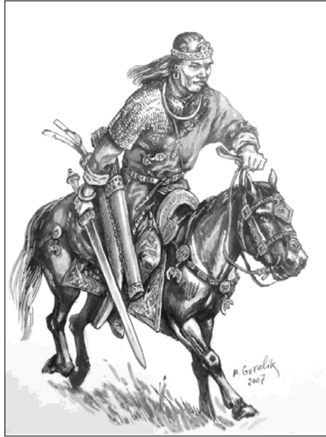
Мал. 4. Знатний гунський вершник з мечем. Реконструкція М. Гореліка

(ласо). За словами Амміана Марцелліна, „гуни обплутують ворогів кинутими з розмаху арканами, щоб, обв’язавши частини тіла тих, хто чинить опір, позбавити їх можливості всидіти верхи або піти пішки” (мал. 4) [3, XXXI, 3.8]. Інший пізньюантичний автор – Ермій Созомен, вказує, що гуни, приготувавши ласо, кидали його піднятою правою рукою, спираючись при цьому на свій щит, з наміром відтягти жертву, яка потрапила у зашморг, до себе й своїх одноплемінників [35, VIII, 25].