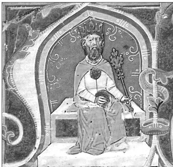
Мал. 1. Аттіла. Зображення з Угорської ілюстрованої хроніки другої половини XIV ст.

Титул „головнокомандувача” мали і Роас (Феодорит Кирський [1, V, 37.4]), і його брат Октар (Сократ Схоластик [34, IV, 34]; Кассіодор [7, Col. 1247]), і Бледа з Аттілою (Пріск Панійський [29, Fr. 3, p. 73]; Євагрій Схоластик [13, VI, 21]). Разом з тим, характер влади військових лідерів західних гунів поступово змінювався, пройшовши еволюцію від родового старійшини, який вибирався з числа інших в якості полководця лише на час набігів і воєнних дій, через вождя окремого племені й надалі Верховного (у більшості випадків номінального) вождя конфедерації племен, до монарха з необмеженою владою, класичним втіленням котрого був Аттіла ( мал. 1 ) [58, с. 235]. Саме він став, за визначенням іншого російського фахівця – С. Плетньової, „главою крупного