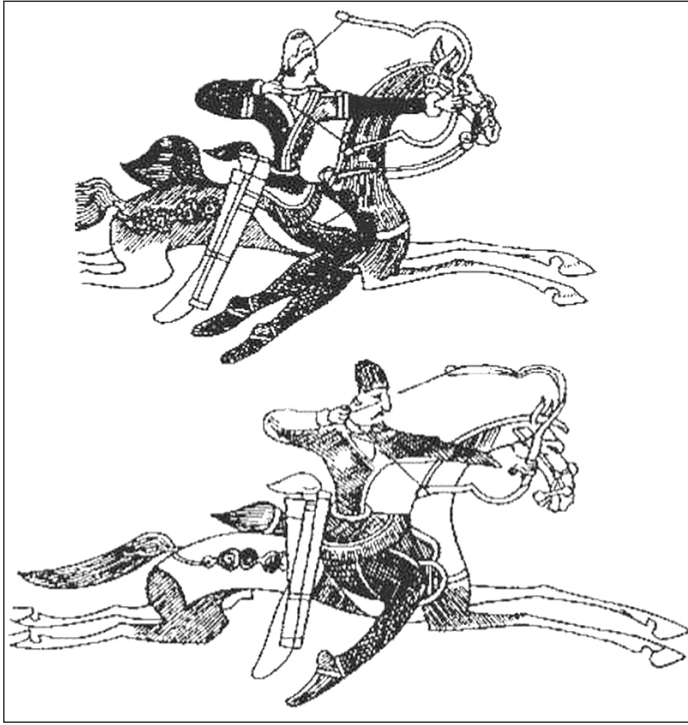
Мал. 9. Гунські кіннотники IV-V ст. Зображення на пластині з поховального комплексу „Орлатський могильник”

сутичку, вони обсіювали ворогів стрілами і, то зникаючи, то з’являючись з різних боків, доводили їх до знемоги, й врешті-решт святкували перемогу” [39, с. 68]. Завдяки саме тактиці „вимотування” гуни перемогли аланів та готів [38, V, 22.6].