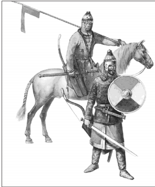
Мал. 5. Знатні гунські воїни першої половини V ст. Сучасна реконструкція

Арсенал гунського захисного озброєння, з одного боку, не був широко представлений відповідними взірцями, з іншого – така особливість повністю відповідала тактиці степової номади. Природно, що гуни широко використовували щит. Прикладом може слугувати розповідь Созомена про спробу одного з гунських воїнів під час набігу на Мезію, за допомогою ласо та застосування щита полонити Феотима, єпископа міста Томи [35, IX, 5]. Сучасні археологічні реконструкції відтворили гунський щит епохи Аттіли ( мал. 5 ). Він був порівняно невеликий, легкий та дерев'яний, обтягнутий шкірою й тому цілком придатний для застосування в кавалерії. Такий невеликий щит круглої форми