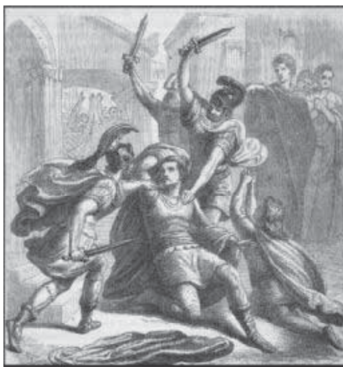
Мал. 12. Вбивство Флавія Стиліхона біля сходинок церкви. Малюнок XIX ст.

“оптиматів”-федератів особистої гвардії Стиліхона, прийнятий на службу від Радагайса. Лише алани Сара залишились вірними Риму та їхні давні союзники гуни. Події, що розгорнулись після 408 р., призвели до остаточної конфронтації між гунами та готами, і “готське питання” знайшло своє логічне розв’язання у наступній ліквідації гунською номадою готського геополітичного домінування в етнічно строкатому, ніким до кінця не кон-