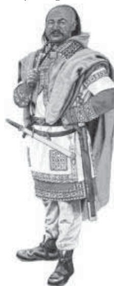
Мал. 7. Гунський воїн початку V ст. Реконструкція Г. Самнера.

Потім через нестерпну жадібність вождя Максима, спонукані голодом та непевністю, взяли за зброю, перемогли військо Валента і розвіялись по Фракії, все наповнюючи вбивствами, пожежами й грабунками. Валент