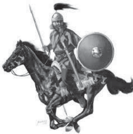
Мал. 11. Остготський вершник першої половини V ст. Реконструкція Д. Шумата

Те, що сталося в Галлії, суттєво підірвало авторитет Стилїхона. Населення Імперії, перебуваючи в тотальній кризі, яка невпинно поглиблювалась, почало шукати внутрішнього ворога, винуватця