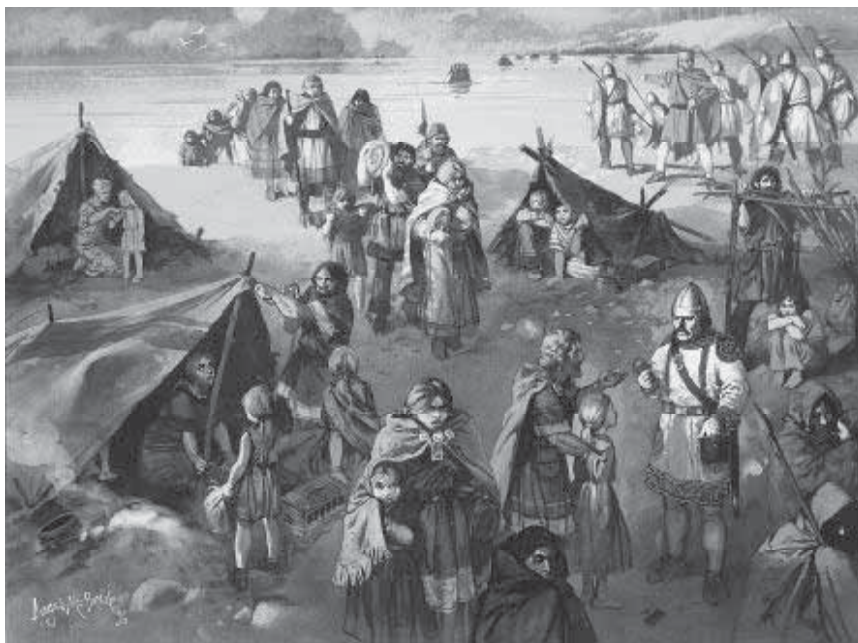
Мал. 3. Готське поселення кінця IV – початку V ст. Сучасний малюнок.

тогочасній воєнно-політичній ситуації. Він послідовно розглядає події, що відбувалися у Північному Причорномор'ї та центральноевропейському регіоні у IV – на початку V ст. (до 425 р.). З кінця III ст. тут, як відомо, відбуваються складні етнополітичні процеси, визначені проникненням сюди північних (германських) племен, з котрих чільне місце займали готи. Войовничі й пасіонарні готи залюдили Крим, Приазов'я та Причорномор'я (до Дунаю) (мал. 3), заснували, за свідченням скандинавських хронік (“Харварасага”, “Піснь про Хліду”, “Старша Едда” та ін.), власну столицю на Дніпрі – Данпарстад. Однак наприкінці IV ст. на цьому терені починається гунський період: гуні підкорили аланів, потім розгромили своїх