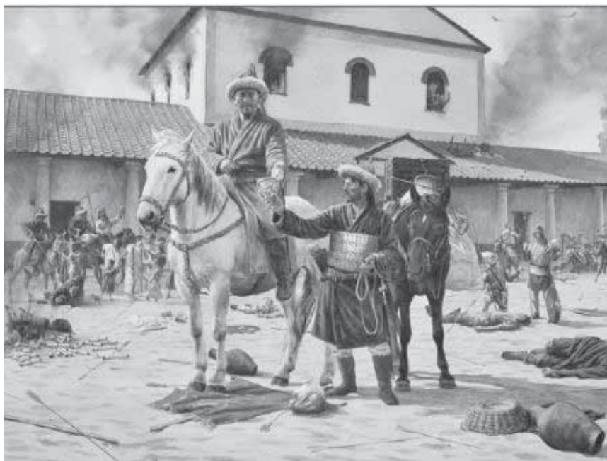
Мал. 4. Гуни у захопленому місті. Сучасний малюнок.

глядає непрості взаємини Імперії та задунайських племен, котрих, у свою чергу, тиснули гуни. Авторський погляд і трактування відповідних історичних подій подаються ним в руслі політизованої дидактики. Наприклад, у четвертій книзі твору, в §34, що має симптоматичну назву “Як готи, переможені іншими варварами, перебігли у римську область і були прийняті імператором, що спричинилось до загибелі Римської держави й самого імператора”, Сократ відзначає: “Трохи згодом, як варвари уклали між собою дружбу, знову зазнали нападу з боку інших сусідніх варварів, так званих уннів; вони, вигнані зі своєї країни, перебігли на римську землю, обіцяючи служити імператорові і виконувати все те, що звелить римський імператор” [18, с. 91; 38, с. 209].