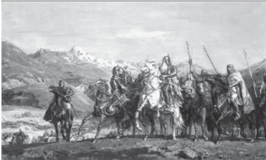
Мал. 6. Алани в поході. Сучасний малюнок.

“На одинадцятому році свого правління, констатує Орозій, Валентиніан, лаштуючись до війни із сарматами, які наповнили Паннонії і спустошили їх, біля міста Бригітіона був задушений раптовим виливом крові, званим по-грецьки апоплексією, і помер... На тринадцятому році царювання Валента... плем'я гунів (мал. 7), тривалий час відрізане неприступними горами, збурене раптовим шаленством, рушило проти готів, скрізь викликало серед них безлад і вигнало із старожитніх місць проживання. Готи перейшли Данувій і, в своєму вигнанні, були прийняті Валентом без будь-якої угоди й навіть не віддали римлянам зброї, щоб їм (варварам – Я.Я.) можна було спокійно вірити.