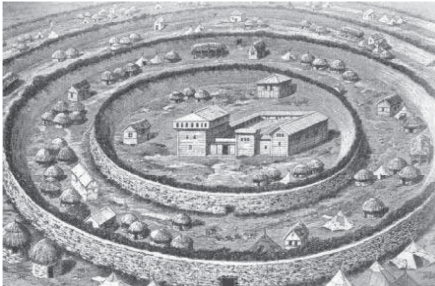
Мал. 1. Укріплене поселення гунів середини V ст. з кільцевими стінами. Реконструкція.

готського впливу й готського контролю над більшістю германських племен і зайняти їхнє місце. Так для гунів, з їх появою на території Європи й зведенням укріплених поселень (мал. 1), принципово постало “готське питання”, яке вимагало виключно мілітарного розв’язання; як виявилось надалі, лише готи не бажали змиритись із присутністю на своїх територіях жорстоких та безжальних прибульців.