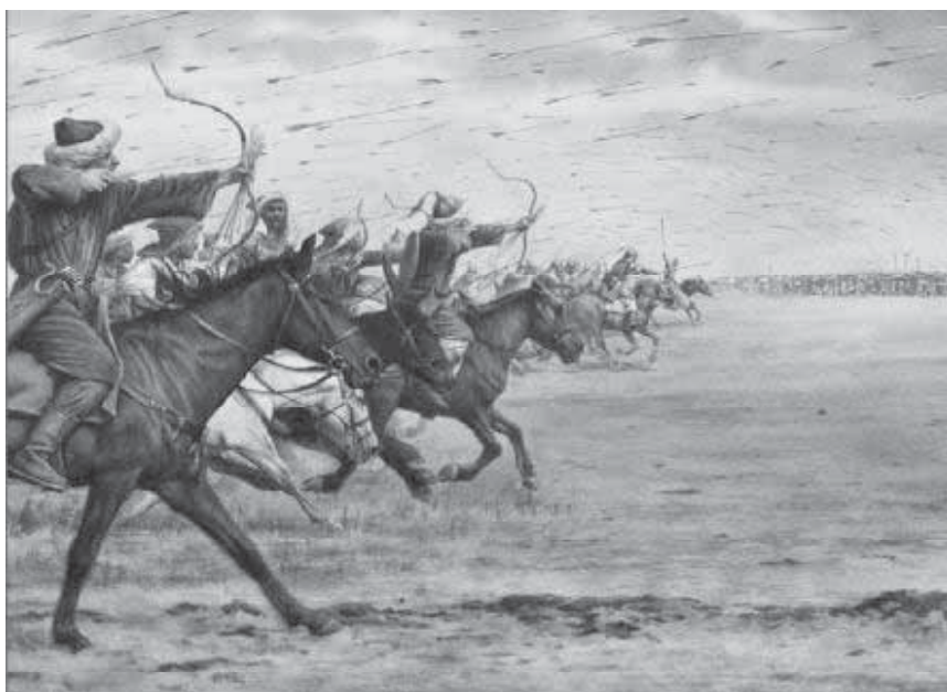
Мал. 5. Гунське військо в атаці. Сучасний малюнок.

Феодорит Кирський, уродженець Антіохії й учень Св. Іоанна Золотоустого, в “Церковній історії” теж окрему увагу приділив гунам, яких називає “кочовими скіфами”. Виклад “гунської теми” єпископ зосереджує на описі походу царя Роїла (тобто Руаса, дядька Аттіли й Бледи) під стіни Константинополя: “Коли Роїл, ватажок кочових скіфів, перейшов через Істр з величезними юрмами (мал. 5), гра-