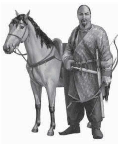
Мал. 2. Гунський вождь першої половини V ст. Реконструкція А. Шпільова

ють складні етнополітичні процеси, що мали місце в греко-римському соціумі у зв'язку зі згадуваним вище Великим переселенням народів. Прикладом слугують опуси галльського поета, письменника й церковного діяча Гая Соллія Аполлінарія Сидонія (431-486), не менш авторитетного латинського церковного письменника Св. Амвросія, єпископа Медіоланського (334-397), відомого християнського апологета й полеміста, далматинця Св. Євсевія Ієроніма (Стридонського) (348-420), де автори описують гунів та їхні