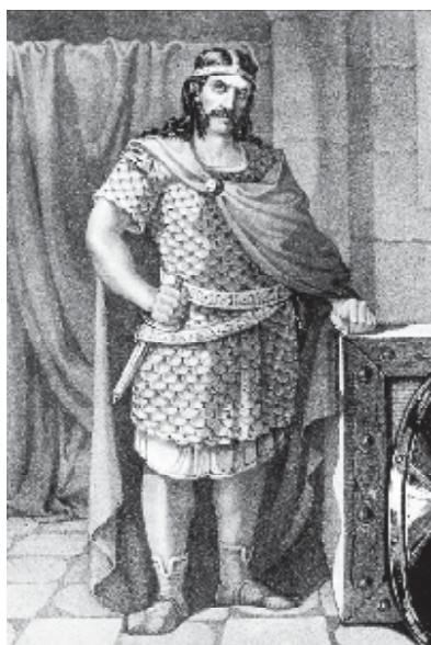
Мал. 8. Аларіх. Малюнок XIX ст.

Необхідно підкреслити, що саме Іллірик був тим “цивілізаційним” мостом, який довгі століття з’єднував латинський Захід з грецьким Сходом. Східний Іллірик з Візантією був зв’язаний адміністративно; із Заходом його контакти були обширнішими і не припинялись завдяки великій стратегічній магістралі, що з’єднувала Константинополь, Пловдив, Сердику, Наїсс, Вімінацій,