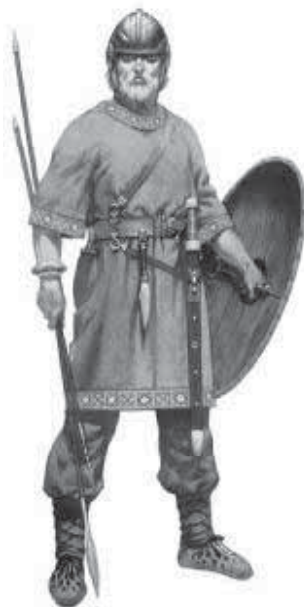
Мал. 9. Вестготський воїн часів Аларіха. Реконструкція А. Макбрайда.

політичної боротьби та зростаючих протиріч між Східною та Західною імперіями. Згідно з джерелами, поведінка Аларіха на Балканах дискредитувала Руфіна. Він був убитий солдатами вже згадуваного Гайни. Це сталося в листопаді 395 р., коли Гайна зі своїми легіонами підійшов до Константинополя. Після смерті Руфіна реальна влада над армією опинилась в руках саме Гайни. З'єднавшись із повсталими готами Трибігільда, Гайна у 399 р. здійснив спробу захопити політичну владу у Візантії, про що у подобицях розповідає Зосима. Населення візантійської столиці, кероване вожаками “антигерманської групи”, повстало проти готів і перебило декілька тисяч їх. Це, як відомо, сталося 400 р. [34, с. 42]. Розлючений Гайна розорив Фракію і мав намір перейти Геллеспонт, але був зупинений відданим імператору Аркадію готом Фравіттою [34, с. 42]. Гайні вдалося утекти за Дунай, проте там він був схоплений гунами і страчений.