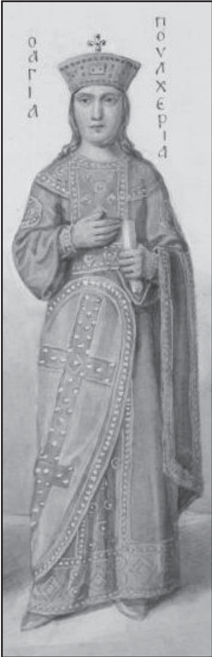
Мал.2. Пульхерія, дружина візантійського імператора Феодосія II. Малюнок Ф. Сонцева, 1869 р.

гунської держави, котрі завжди будуть з почестями прийняті при дворі. Крім того, за два неповні роки він організував загальне безперервне сполучення між кавказькими й дунайськими гунами, паралельно активізуючи сполучення між ними і проміжними пунктами. Аттіла також запровадив інститут “делегатів” при дворі дяді від білих та чорних гунів: “делегати” на практиці повинні були координувати управління між “центром” і “регіонами” [35, с. 62-63].