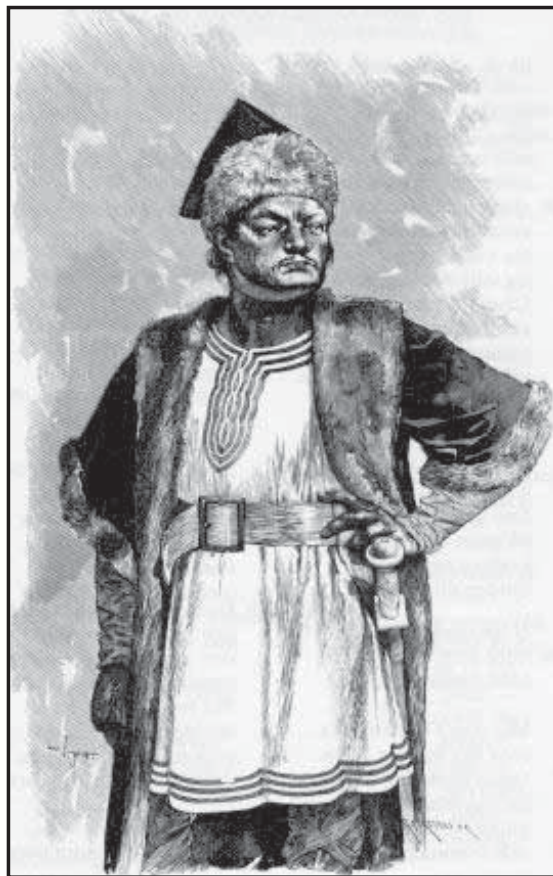
Мал.3. Аттіла (Атлі). Ілюстрація до “Старшої Едди”, 1893 р.

М. Був’є-Ажан підкреслює, що надзвичайно важко вирішити цю нескінченну суперечку науковців [35, с. 66]. Свою думку з даного приводу він висловлює наступним чином: “Припущення про 250000