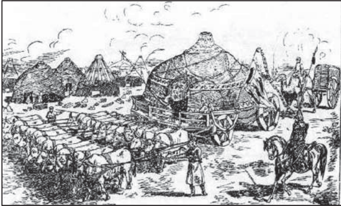
Мал.4. Гунська номада у поході. Малюнок XIX ст.

населення є нереалістичним: в умовах того часу сформувати, крім інших військ, легіон у 60000 чоловік було би неможливо. Крім того, якщо експедиційний корпус, наданий Аецію, включав до свого складу гунів, то останні, поза будь-яким сумнівом, складали вельми незначну меншість. З іншого боку, навіть якщо кочовики важко піддаються обрахуванню, їхня чисельність у будь-якому випадку не могла обмежуватись декількома тисячами, а постійний інтерес до східних ринків достатньо переконливо доводить, що там існувала давно сформована висока концентрація населення” [35, с. 66].