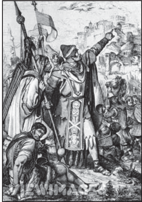
Мал.5. Аттіла готує свої війська до наступу. Гравюра кінця XVIII ст.

Сімейні відносини новий правитель гунів розпочав порівняно рано, коли 413 р. одружився з донькою вождя племені, яке не входило у сферу впливу Роаса та його родини. За переданням її звали Енга (308-417) [49, с. 246-248]. Вона, вірогідно, мала статус “наслідної принцеси” й народила сина Еллака (413-454), якого Аттіла завжди любив найбільше з усіх синів і 451 р. зробив “номінальним імператором”; але вона померла молодою. У 421 р. гунський керманіч узяв шлюб із гунською родовитою дівчиною (можливо, своєю двоюрідною сестрою [51, с. 45]), донькою “суверенного вождя” великого племінного союзу. Звали її Керка (406-448) [51, с. 47]. У 434 р., ставши повноправним королем, Аттіла зробив її королевою (дружина його брата Бледи так само одержала цей титул), а 435 р., після проголошення себе імператором, володар гунів оголосив Керку “королевою-імператрицею” [60, с. 140-141]. З усіх дружин лише