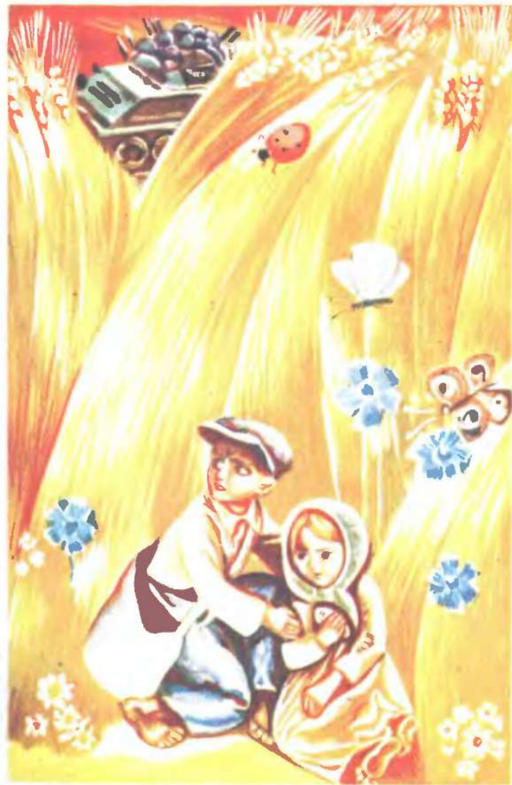
«Петрусь і Гапочка»