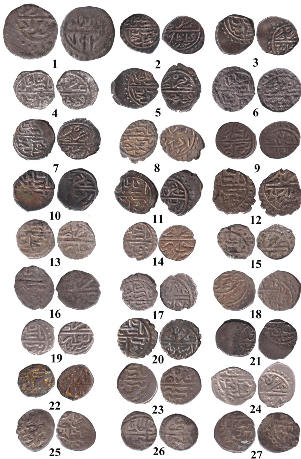
Рис. 2. Османські акче з колекції ОАМ (I)