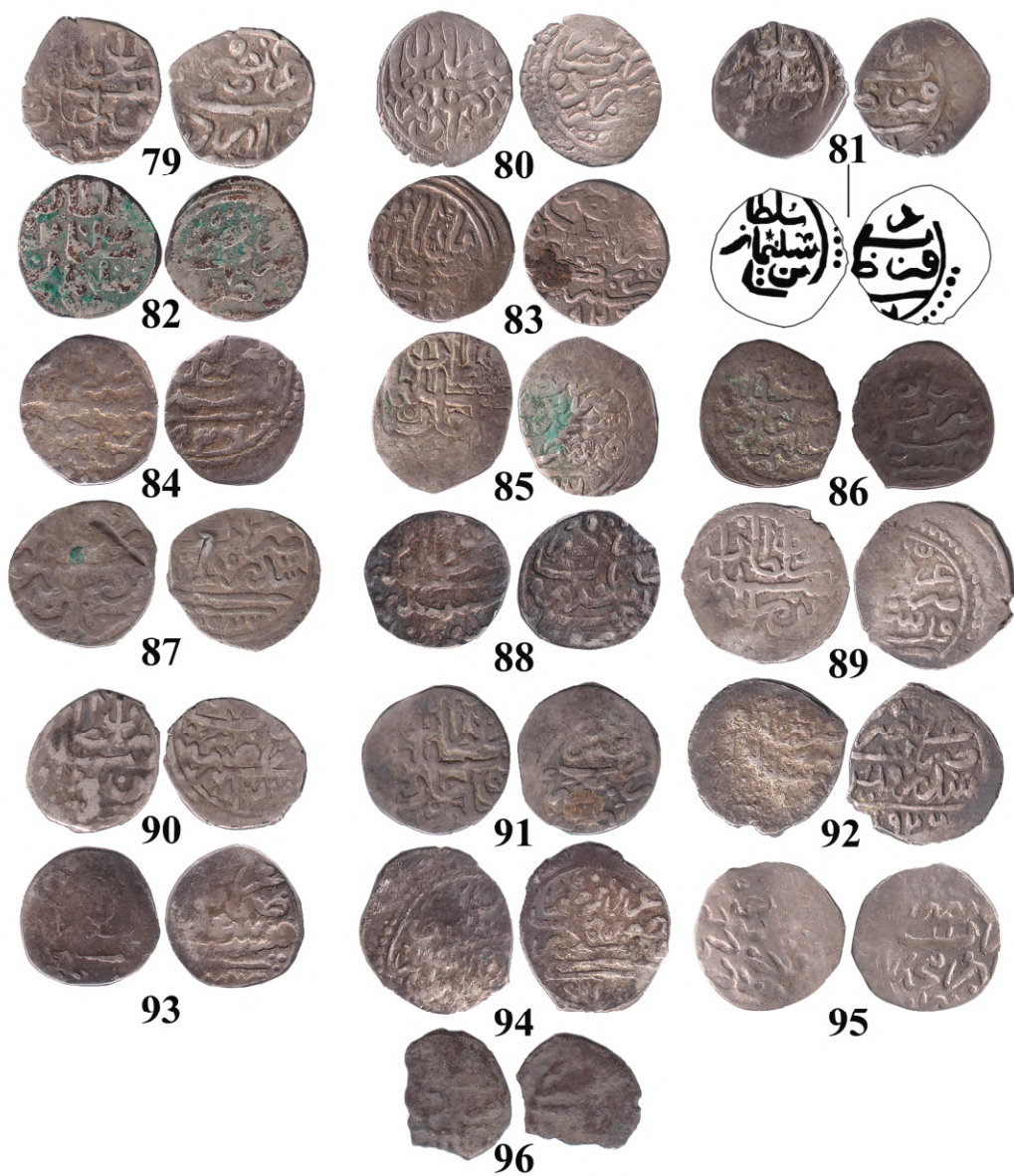
Рис. 5. Османські акче з колекції ОАМ (IV)