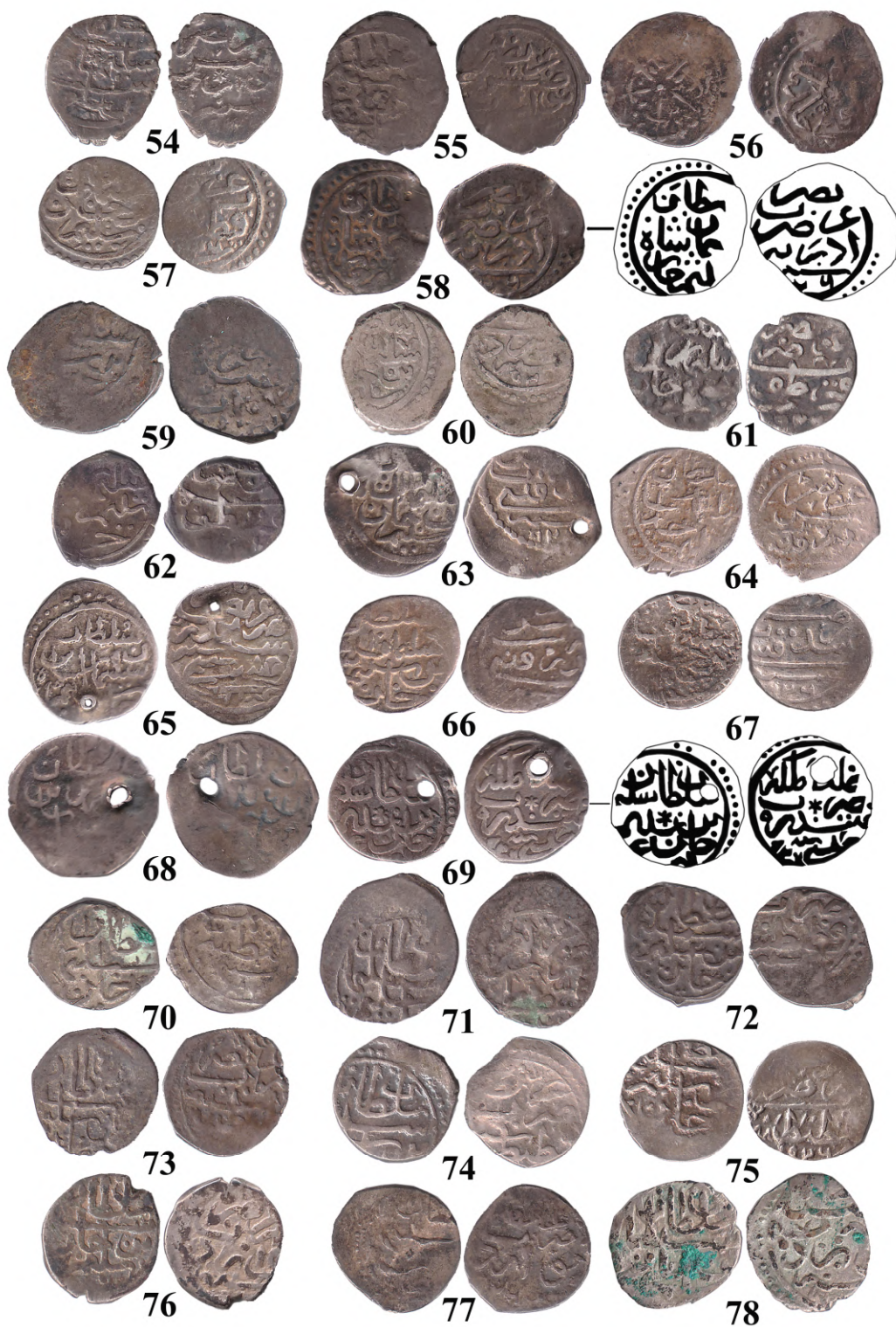
Рис. 4. Османські акче з колекції ОАМ (III)