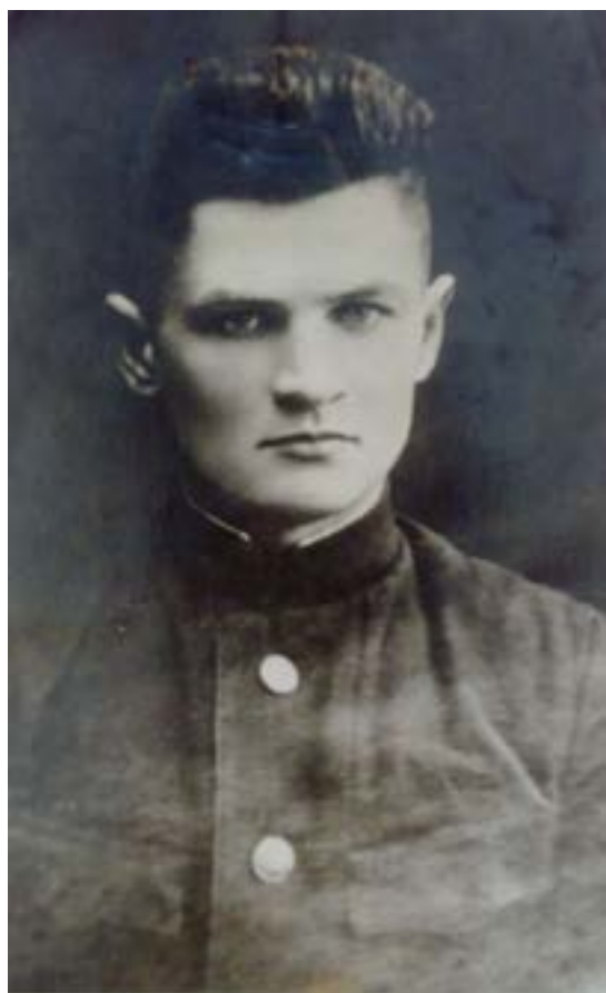
Старший лейтенант К.Ф. Ольшанський, 1943 р.