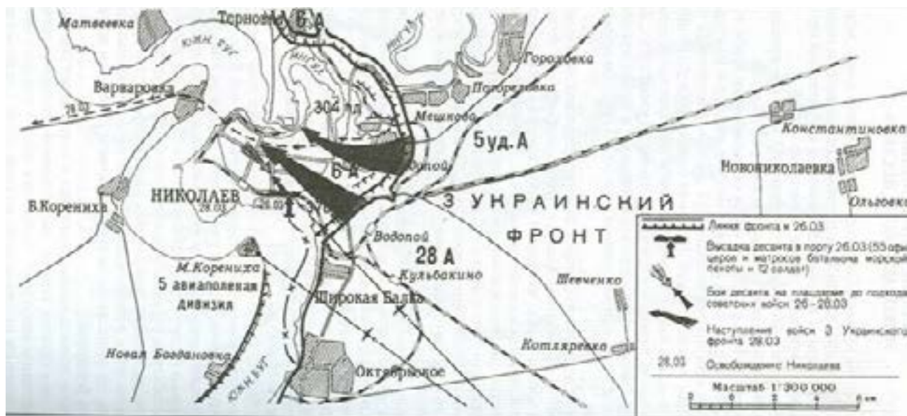
Бойові дії десантного загону 384-го ОБМП під час звільнення м. Миколаїв 26-28 березня 1944 р. [26]