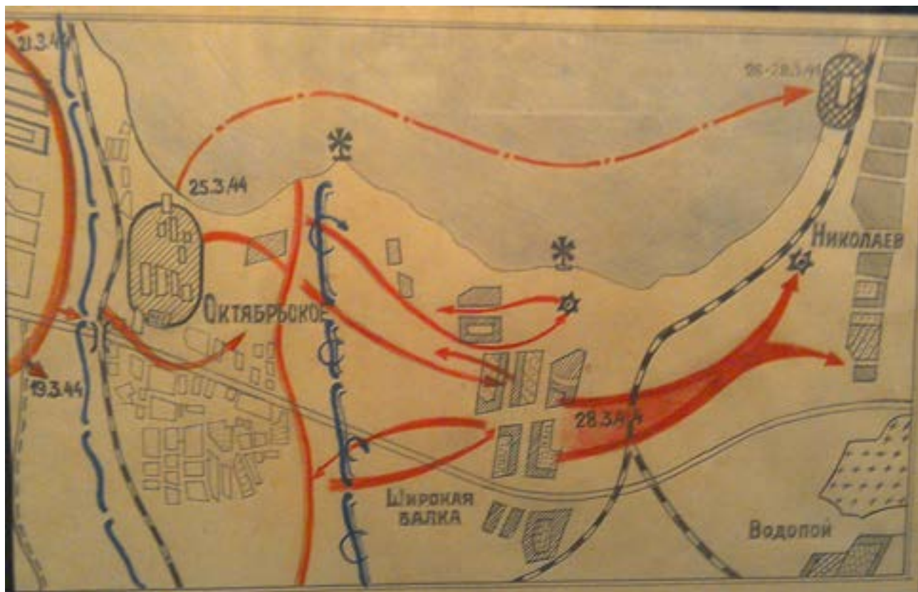
Карта-схема 15-км десантного маршруту загону К.Ф. Ольшанського 25-26 березня 1944 р. проти течії р. Південний Буг від с. Богоявленське до воріт Миколаївського морського порту (з експозиції Музею Героя Радянського Союзу К.Ф. Ольшанського, смт Приколотне Великобурлуцького району Харківської області)