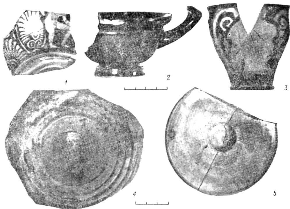
Рис. 3. Керамічні знахідки в «лавці ювеліра»:

1 — фрагмент червонофігурного кіліка; 2 — чорнолаковий глибокий кілік; 3 — червонофігурний скіфос; 4 — кришка світлоглиняної леканіди; 5 — червоноглиняне рибне блюдо.