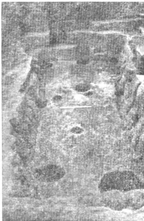
Рис. 1. Будівельний комплекс № XVIII «лавка ювеліра».

Привертають увагу знахідки з підлоги в комплексі XVIII. Вже сам факт збереженості різноманітних предметів на рівні підлоги незвичайний для Єлизаветівського городища. Як правило, у всіх досліджених будівельних комплексах на рівні підлоги знахідки відсутні. Це дало підставу вважати, що житлові і господарчі споруди не загинули раптово, під час нападу або пожежі; жителі залишили їх поступово — вони мали час зібрати свої речі. Саме тому під час розкопок in situ на рівні можна виявити лише те, що загубилося випадково. Під час розчистки комплексу XVIII, особливо в його центральній частині, трапилося вугілля, попіл, місцями материковий ґрунт пропікся на кілька сантиметрів до червоного кольору. Все це, безперечно, вказує на те, що споруда загинула від пожежі, чим і можна пояснити значну збереженість виявлених предметів.