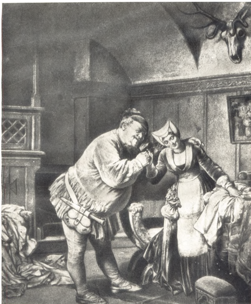
«ВІНДЗОРСЬКІ ЖАРТІВНИЦІ». ФАЛЬСТАФ У МІСІС ФОРД (з гравюри Е. Грюгнера)