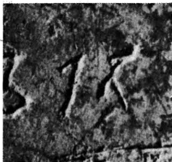
Рис. 2. Літера «К» напису про «раку»-саркофаг Андрія-Всеволода Ярославича з Софійського собору (збільшено).

На думку автора статті «побіжним аргументом на користь початкової дати», тобто 6560, є розташований поруч напис 1052 р., що нібито повідомляє про встановлення в соборі саркофага Ярослава Мудрого. Напис читається так: «В лѣто 6560, марта в 3-е розгремелось въ 9 часов дня. Было же то в 40-го святого мученика Евтропия». У першій публікації напису слово РОЗЪГРЪМЛЕ (СЯ) читалося нами як «розгром», «розорення», а не «розгремілося» 10 . В. К. Зібаров нашого нового читання, мабуть, не знав і вирішив, що це важке для розуміння та читання слово повідомляє про встановлення у соборі саркофага князя. Але, по-перше, у напису немає жодного слова про «раку»-саркофаг і, по-друге, виходить, що князь помер у лютому місяці, а поховано його у березні. До цього у нас є цікава паралель з того ж Софійського собору. Це напис про саркофаг Андрія Всеволода Ярославича, який був встановлений у соборі 14 квітня, тобто на наступний день після смерті князя 13 квітня 1093 р., про що свідчить запис у «Повісті временних літ». Суперечить висунуте читання напису й злободенності графіті, що писалися звичайно в день самої події. У напису 1052 р. подія була короткочасною і тому в ньому згадано не тільки рік, а й місяць, число й час події. І це цілком зрозуміло, бо йшлося про грім або вірніше про блискавку, що влучила в собор. Але чому у напису саме цьому явищу приділялось стільки уваги? На це питання можна відповісти так. На Русь поширились з Візантії разом з богословськими