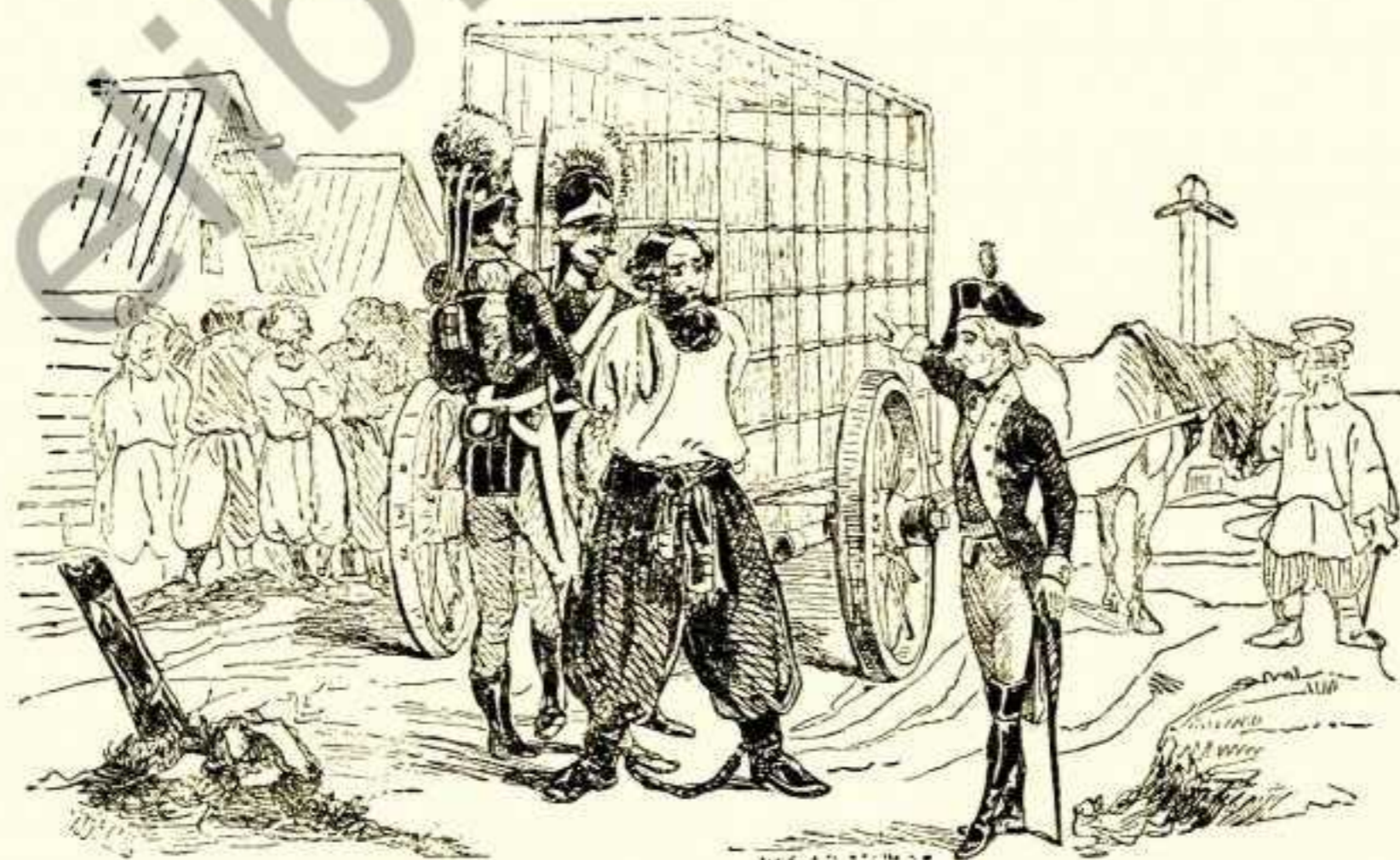
Пугачов перед Суворовим.

О, ні! Та „вільна симья“, котра виросте на руїнах старого світу, не забуде Великого провозвістника її.