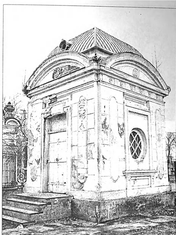
Рис. 3. Прибрамний будиночок (знаходиться у дворі).

На описовому тлі рукотворних пейзажів, архітектурно-стильових особливостей садиби загалом