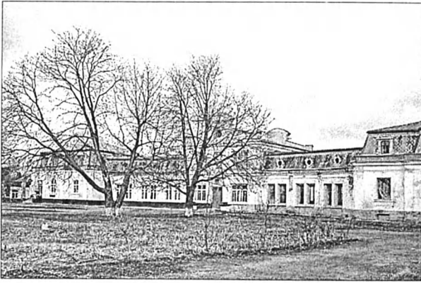
Рис. 4. Флігель – окремий будинок у дворі (зліва).

утримання життя палацового в Антонінах щорічно витрачалося 150 тис. царських рублів.