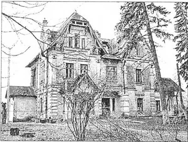
Рис. 7. Офіцина для «приятелів» над антонінським ставом.