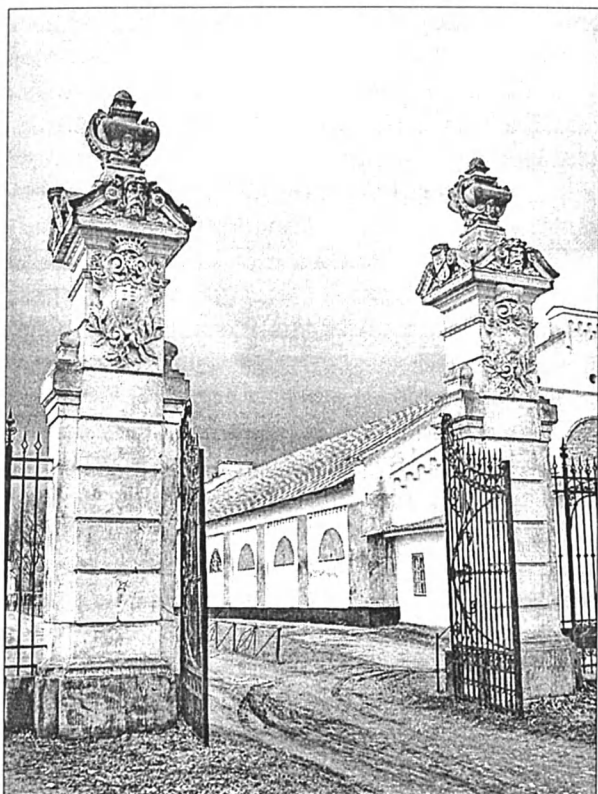
Рис. 5. Брама східна, за якою – манеж (або возовня).