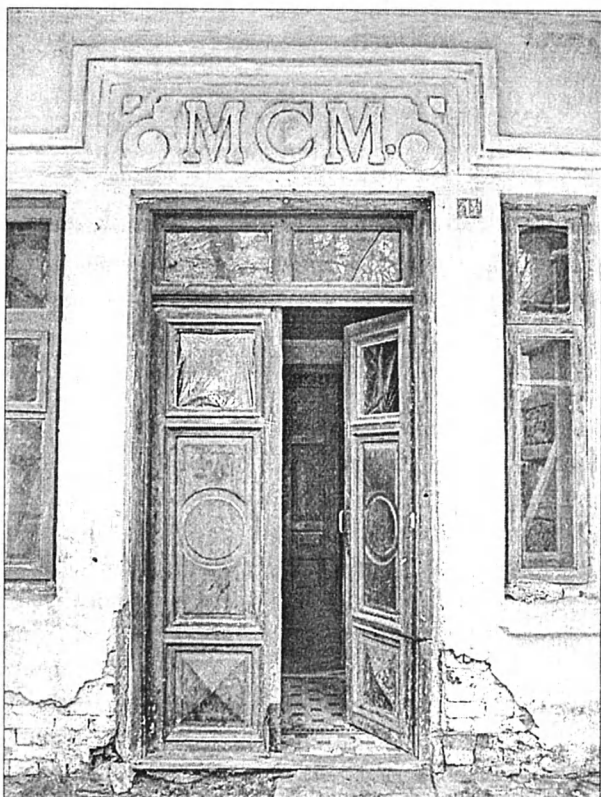
Рис. 8. Вхідні двері в цю ж офіцину з датою «МСМ».

з її пристрасті до монументального будівництва, свідчить наступне. Після смерті чоловіка вона підтвердила усі його фундації (себто заснування різних громадських споруд родинним коштом), які на ту пору залишилися недобудованими. Профінансувала ремонт заславського фарного костелу. Та найбільшою її справою було спорудження у Заславі протягом 1754–1770 рр. монументального палацу і закладення класичного у всіх відношеннях парку. Під її опікою місто набуло небувалого еко-