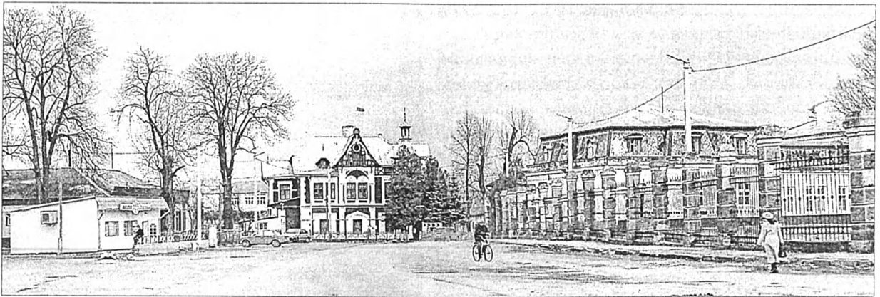
Рис. 10. Вид з центральної дороги на колишній автомобільний гараж (прямо) та флігель (справа).

стали двоповерхові. Невеликий парадний майдан-трамвай перед цим архітектурним ансамблем кн. Євстафій обніс чавунною загорожею. Вхідні ворота, котрі трималися на двох мурованих чотиригранних опорах у вигляді постаментів з чималими кулями, як видно на малюнку Н. Орди, були неподалік правої сторони палацу, вигляд якого, підкреслюємо, подається зі сторони двору або в'їзду [22, s. 15]. Зрозуміло, певних змін зазнала і південна сторона помешкання, котра виходила в парк.