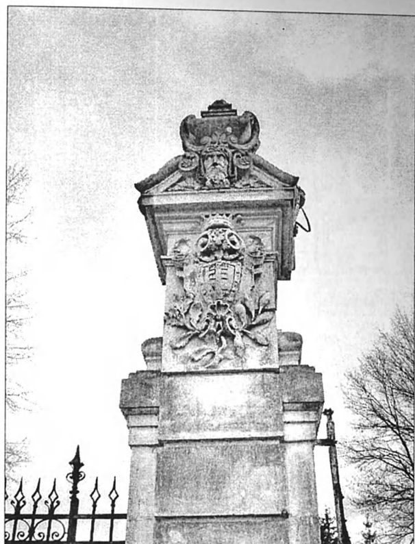
Рис. 6. Фрагмент колони східної брами.

названо саме так на честь родинного герба Потоцьких [14, с. 238]. Величезний інтерес викликав у зоологів високий науковий рівень акліматизації й утримання тварин.