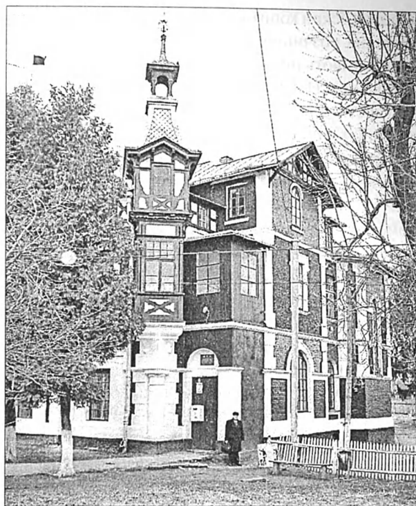
Рис. 1. Колишній гараж і майстерня автомобілів. Нині приміщення селищної ради і бібліотеки.

Варто пам'ятати, що вигляд Сангушківського родинного гнізда в Славуті – дуже імпозантної з вигляду садиби і, зокрема, палацу не йде ні в яке порівняння з красою і смаком антонінського помешкання: «Просторий тутешній (славутський.– В.В.) палац, звична резиденція дідичів – то тяжкий (масивний) двоповерховий мурований будинок без жодного стилю» [28, с. 58]. Славута віддавна звикла економити, ще з часів кн. Ієроніма, коли про його статки було сказано: «Добра були великі, але прибутки незначні; про розкоші не могло бути й мови» [31, с. IX]. І в 1881 р., через місяць після смерті великого хазяїна, кн. Романа Євстафійовича, котрий мешкав не в палаці, але в невеличких