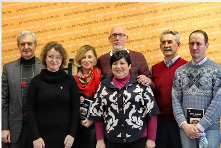
Презентація 25-го випуску історико-краєзнавчого наукового альманаху «Південний Захід. Одесика» в інформаційному агентстві «Контекст Причорномор'я» (2018 р.)