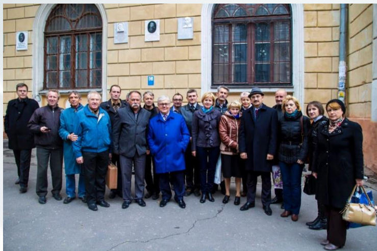
Урочисте відкриття меморіальної дошки видатному історичу козацтва Михайлу Слабченку на фасаді головного корпусу ОНУ ім. І. І. Мечникова (2015 р.)