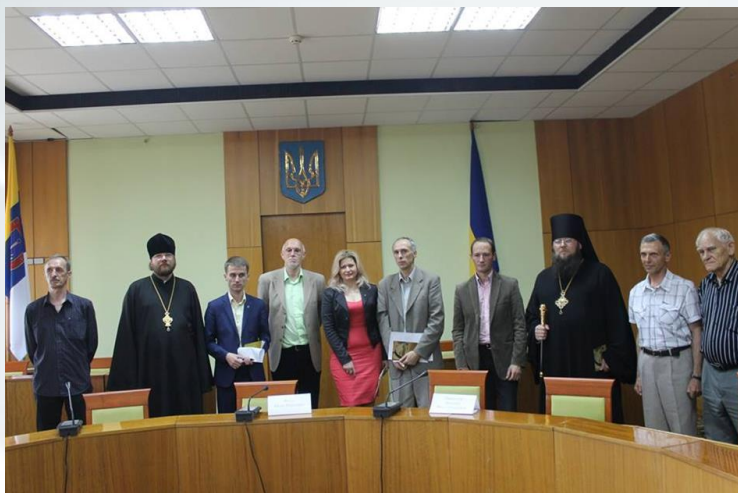
Засідання «круглого столу», присвяченого питанню встановлення на Приморському бульварі м. Одеси меморіальної дошки з інформацією про місто-фортецю Хаджибей (2016 р.)