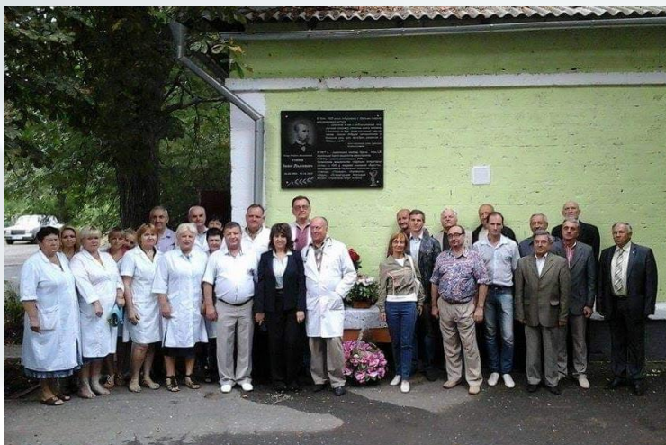
Відкриття меморіальної дошки Івану Липі в с. Дальник Одеської області (2015 р.)