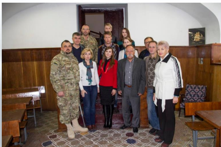
Відкриття Козацької аудиторії на кафедрі історії України ОНУ ім. І. І. Мечникова (2015 р.)