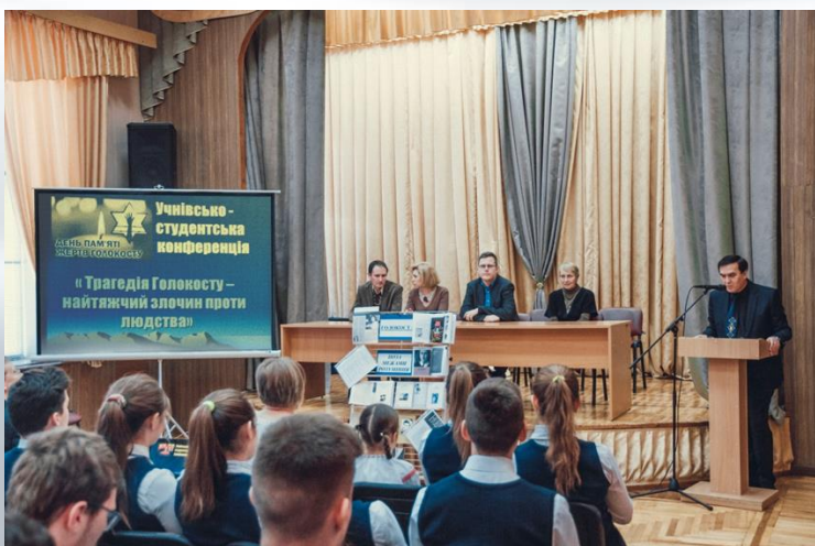
Учнісько-студентська конференція «Трагедія Голокосту – найтяжчий злочин проти людства» в ОНВК «Гімназія № 2» (2016 р.)