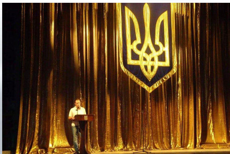
В Одеському національному академічному театрі опери та балету на заході, присвяченому 600-річчю м. Одеси (2015 р.)