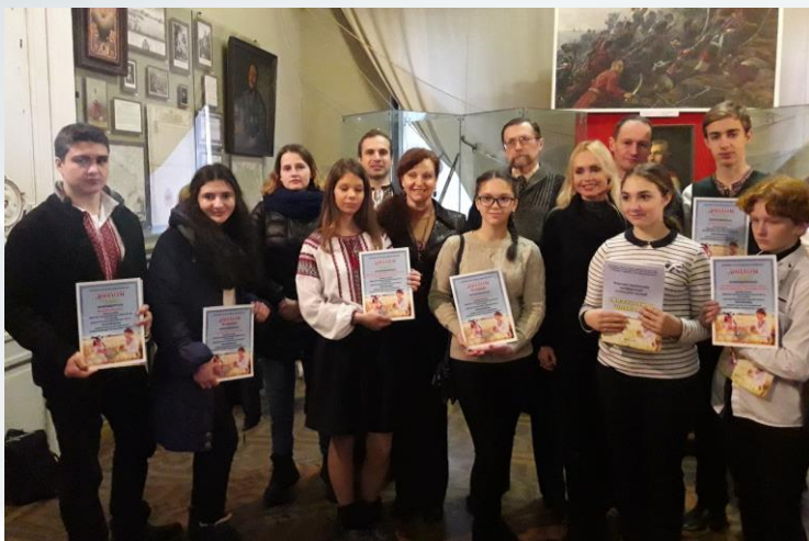
Нагородження переможців конференції учнівської молоді «Козацькими шляхами» в Одеському історико-краєзнавчому музеї (2019 р.)