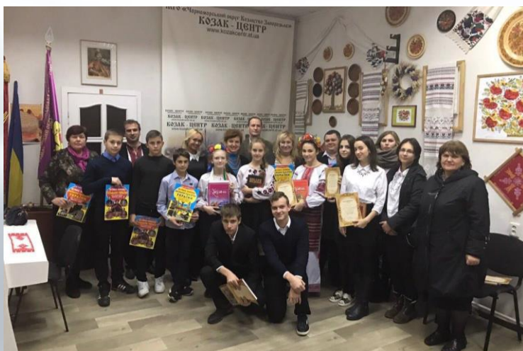
Щорічна науково-практична конференція для учнівської молоді «Козацькими шляхами» в культурно-просвітницькому центрі «Козак-центр» при Музеї історії розвитку Українського козацтва (2016 р.)