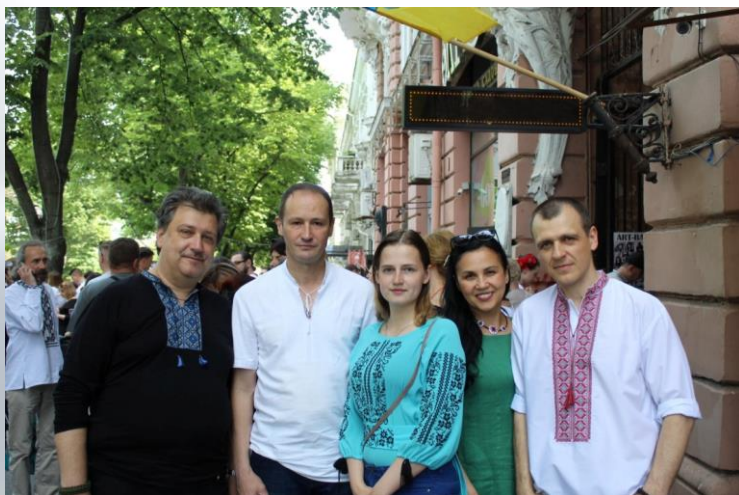
XIV мегамарш у вишиванках (2019 р.)