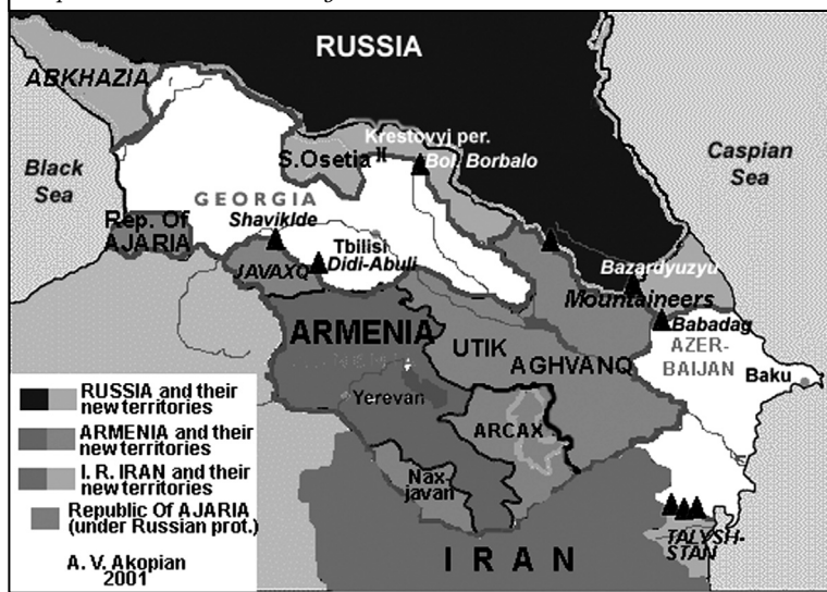
Карта Північного Кавказу

вважають, що відсутність етнокультурної спільності, політико-територіальної єдності були характерними рисами суспільного життя Північного Кавказу і Закавказзя аж до приєднання їх до Росії.