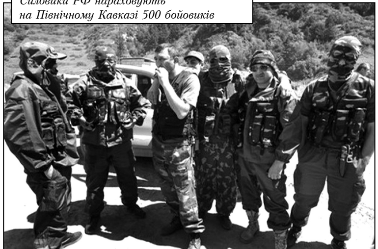
Силовики РФ нараховують на Північному Кавказі 500 бойовиків

Не спадає терористична діяльність у регіоні. Кількість терактів зараз складає 84% від загальної кількості по Росії. За останні півтора року в південному федеральному окрузі затримано 1736 лідерів і активних учасників незаконних «бандформувань» і виявлено 61 факт створення злочинних угруповань, що складає одну п'яту виявлених у Росії. Чеченська Республіка – не єдине місце, де скоюються терористичні