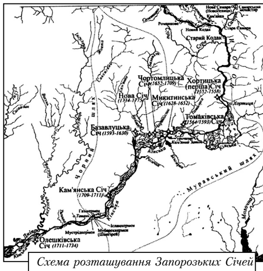
Схема розташування Запорозьких Січей

звернувся за допомогою до українського козацтва.