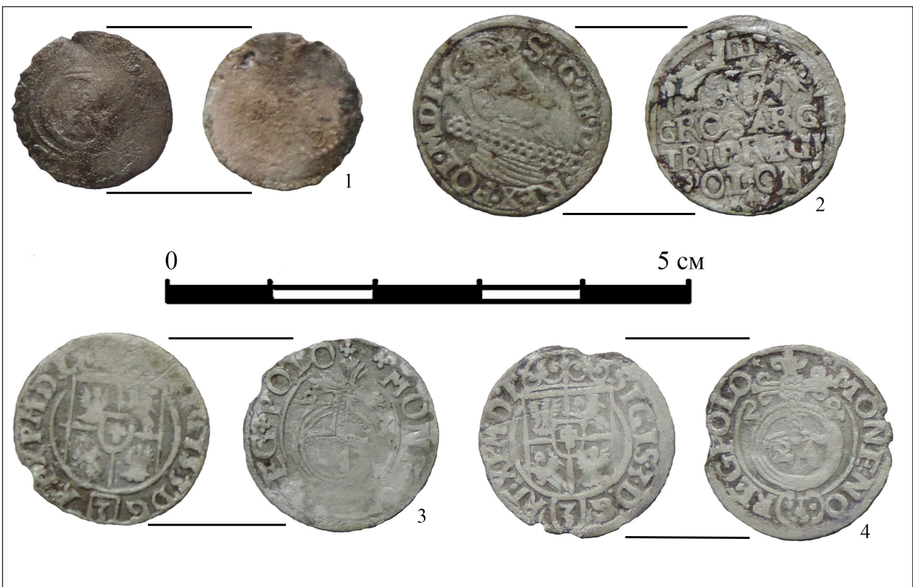
Рис. 6. Монети XVII ст. із досліджень 2015 року.

Гроші. За час експедиції 2015 року було знайдено чотири монети: три з них трапились в одному згустку й розміщувались одна