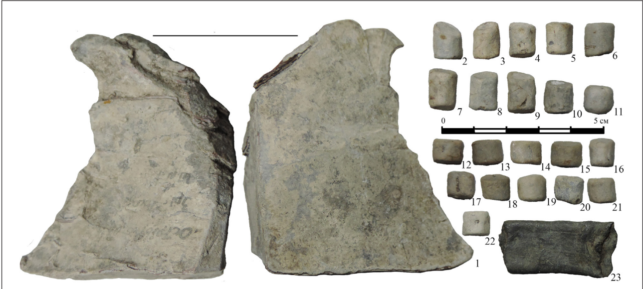
Рис. 3. Заготовки куль знайдені під час досліджень на території Національного історико-меморіального заповідника «Поле Берестецької битви» у 2015 р.

знахідок відносяться фрагменти двох щиткових перстнів. У одного щиток округлий у плані, на лицевій стороні врізана чотирипелюсткова розетка, по контуру заглиблення, дужка біля щитка потовщується, прикрашена поздовжніми лініями. Подібний перстень було знайдено під час розкопок переправи І. Свешніковим (рис. 4, 13) [9, с. 210]. У другого персня щиток