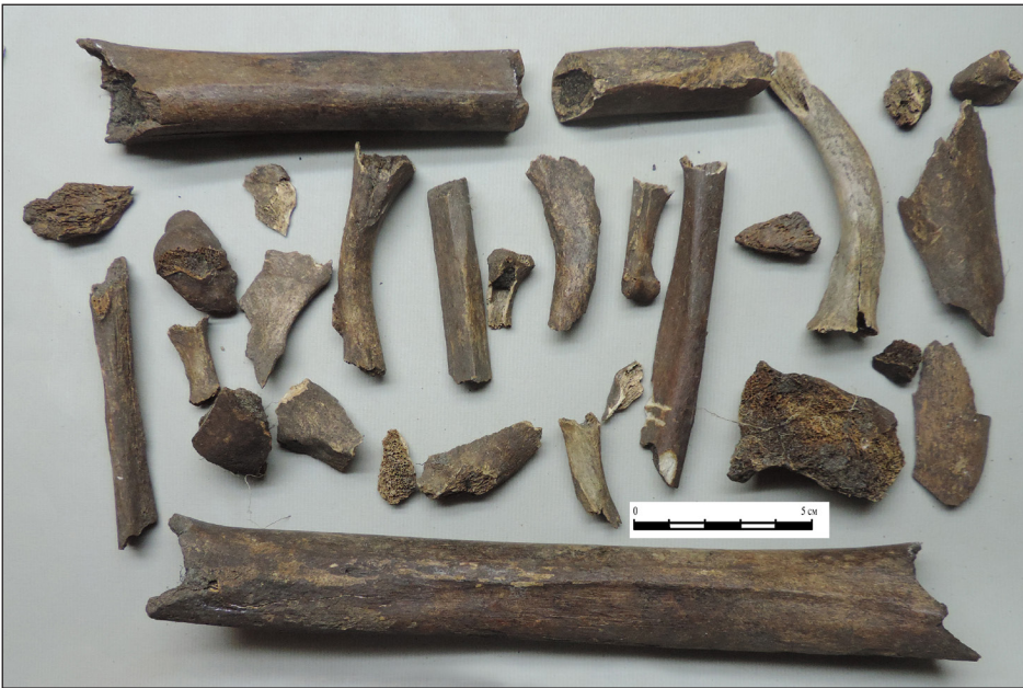
Рис. 7. Фрагменти людського кістяка знайдені під час досліджень на території Національного історико-меморіального заповідника «Поле Берестецької битви» у 2015 р.

на одній. Після застосування реставраційно-консерваційних заходів, їх атрибутовано, як три гроша Краківського чекану, 1600—1606 років, чеканена при Сигізмунді III Вазі (1588—1632) (рис. 6, 2) [5, с. 33]; Півторагрошовик коронний, чеканений у м. Бидгош 1614 р. за Яна Сигізмунда (1608—1619 рр.) (рис. 6, 3) [4, с. 53]; Півторагрошовик Ризького чекану 1620 р. чеканений за Георга Вільгельма (1619—1640) (рис. 6, 4) [4, с. 55].