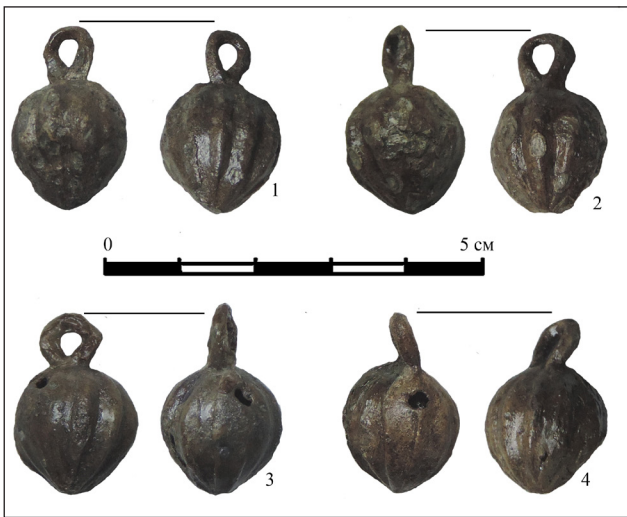
Рис. 5. Диневидні гудзики із досліджень 2015 р.

виготовлений у формі рівностороннього хреста із заокругленими раменами, по контуру обведений двома виступаючими лініями, перехрестя чотирикутне (рис. 4, 14). Щиток розділений подвійною лінією на чотири поля, по контуру центрального щита подвійна лінія з перемичками, дужка виходить із двох протилежних рамен.