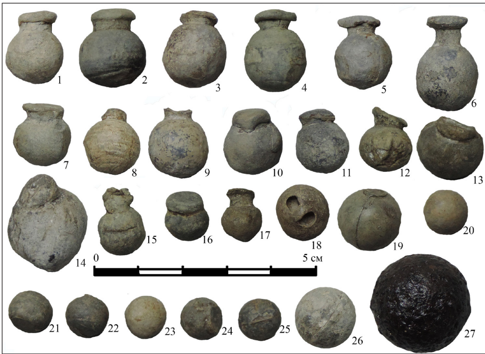
Рис. 2. Кулі до вогнепальної зброї знайдені під час досліджень на території Національного історико-меморіального заповідника «Поле Берестецької битви» у 2015 р.

козаків); ур. За Фосою (місце козацької переправи, дослідженої І. Сवेशніковим) (рис. 1).