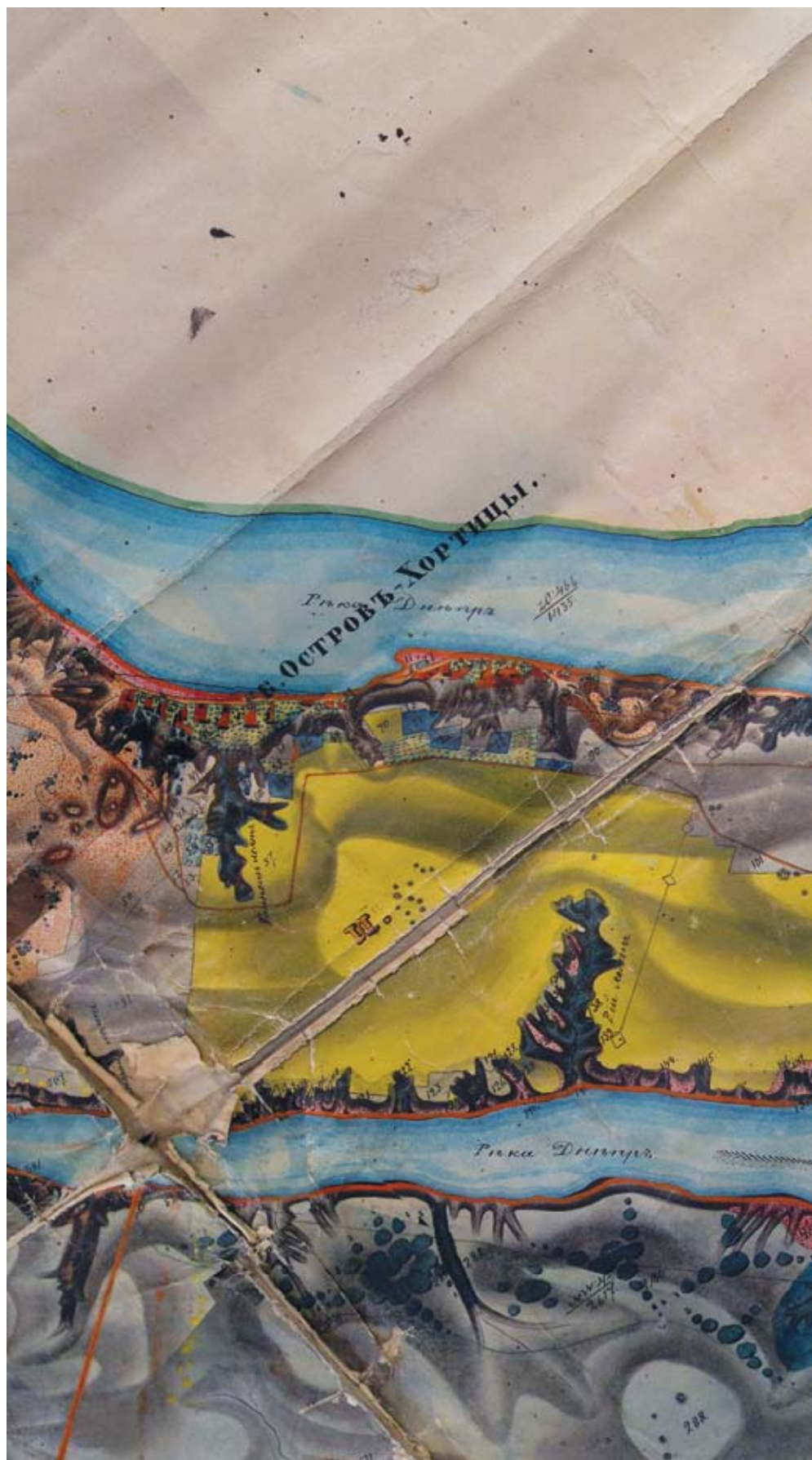
«План дачі колонії Хортиці ...». Фрагмент 2