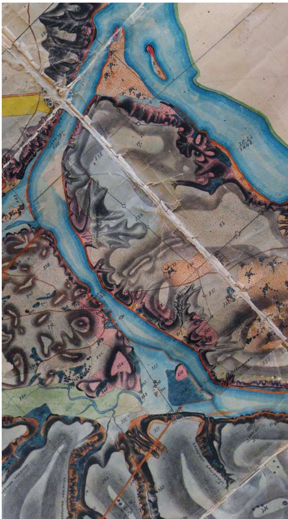
«План дачі колонії Хортиці ...». Фрагмент 1