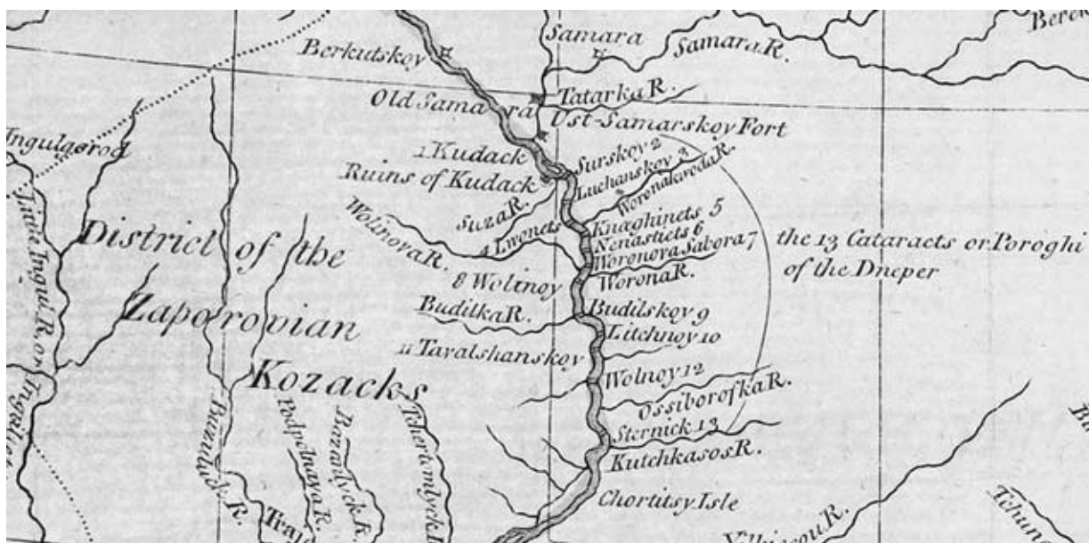
Рис. 1. Фрагмент карти Джона Лоджа 1769 р.

Ненаситець, Вовницький, Будильський, Лишний та Вільний. Пороги Knaghinets, Wogonowa Sabora, Tawalshanskoj — це відомі за багатьма джерелами Княгинець, Воронова Забора й Таволжанський. Серед близького за часом до карти Джона Лоджа картографічного матеріалу, де показані ці пороги, як приклад, можна назвати рукописний «Геометричний план Дніпровським порогам від Усть Самари до Олександрівської фортеці...» 1771 року та друківану «Карту кордонів Польщі ...» Джованні Антоніо Річчі Заноні 1772 року [7, д. 5051; 8]. Поріг Княгинець, який у XIX — XX ст. називався заборю Тягинською, знаходився у 5,5 км нижче порогу Дзвонецького, між правим берегом Дніпра та островом Кізлевим, поряд з сучасним лівобережним селом Запорожець Синельниковського району Дніпропетровської області [9, арк. 8; 10, с. 36]. Поріг Воронова Забора у XIX — XX ст. був відомий під тою самою назвою, але вже не вважався порогом. Він знаходився 4 км нижче порогу Ненаситецького, північніше острова Піскуватого, поряд з сучасним правобережним селом Військове Солонянського району Дніпропетровської області [9, арк. 10; 10, с. 36]. Поріг Таволжанський, який у XIX — XX ст. називався Таволжанською або Смольською заборю, лежав між однойменним островом та правим берегом Дніпра, 7 км нижче порога Будилівського, на південь від сучасного правобережного села Федорівка Запорізького району Запорізької області [9, арк. 11; 11, с. 329; 10, с. 38].