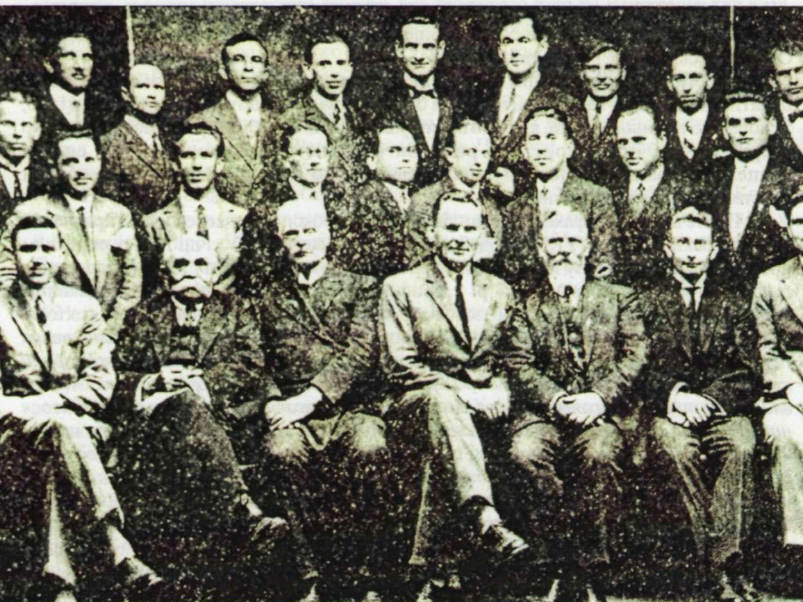
С.П.Тимошенко серед професорів та студентів Української господарської академії. Подєбради. 1928 р.