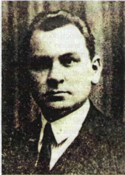
С.П.Тимошенко. Фото 1927 р.