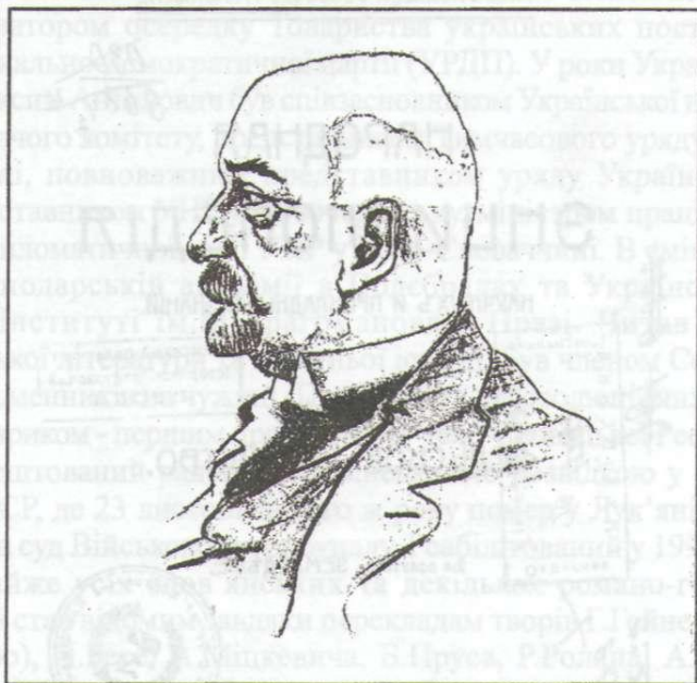
Портрет К.Мацієвича. 1920-ті роки. За І.Фещенко-Чопівським

Кость Адріанович Мацієвич (1873-1942) - відомий фахівець у галузі сільськогосподарської науки, громадської агрономії, учасник українського національно-визвольного руху початку ХХ ст., товариш генерального секретаря земельних справ за часів Української Центральної Ради, міністр закордонних справ Української Народної Республіки періоду Директорії, соратник Симона Петлюри, голова Надзвичайної дипломатичної місії УНР у Румунії, професор українських вищих шкіл у Чехословаччині, голова кількох громадсько-політичних і фахових організацій та наукових установ 1 .