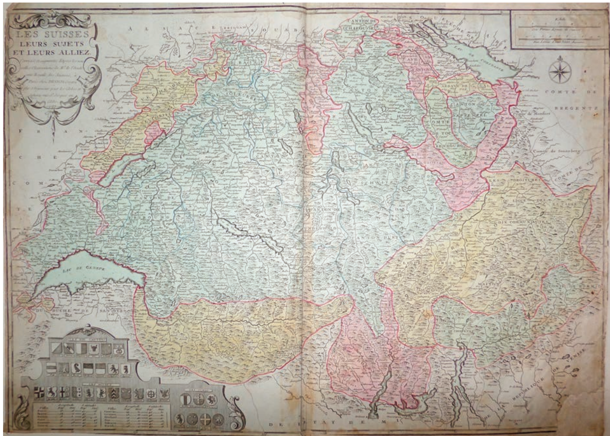
Рис. 8. Дено, Луї Шарль. Карта «Швейцарія, її піддані та союзники», Франція, Париж, 1785 р.