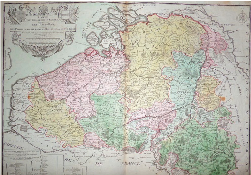
Рис. 10. Дено, Луї Шарль. «Карта Театру воєнних дій, що включає Нідерланди та частину об'єднаних провінцій Голландії та єпископство Льєжське», Франція, Париж, 1784 р.

«Карта Театру воєнних дій, що включає Нідерланди та частину об'єднаних провінцій Голландії та єпископство Льєжське» (ГРЛ-5031) (рис. 10) 1784 р. авторства Дено Луї Шарля представляє території, на яких відбувались події, ймовірно, під час Батавської революції, про яку вже згадувалось в повідомленні. Льєжське єпис-