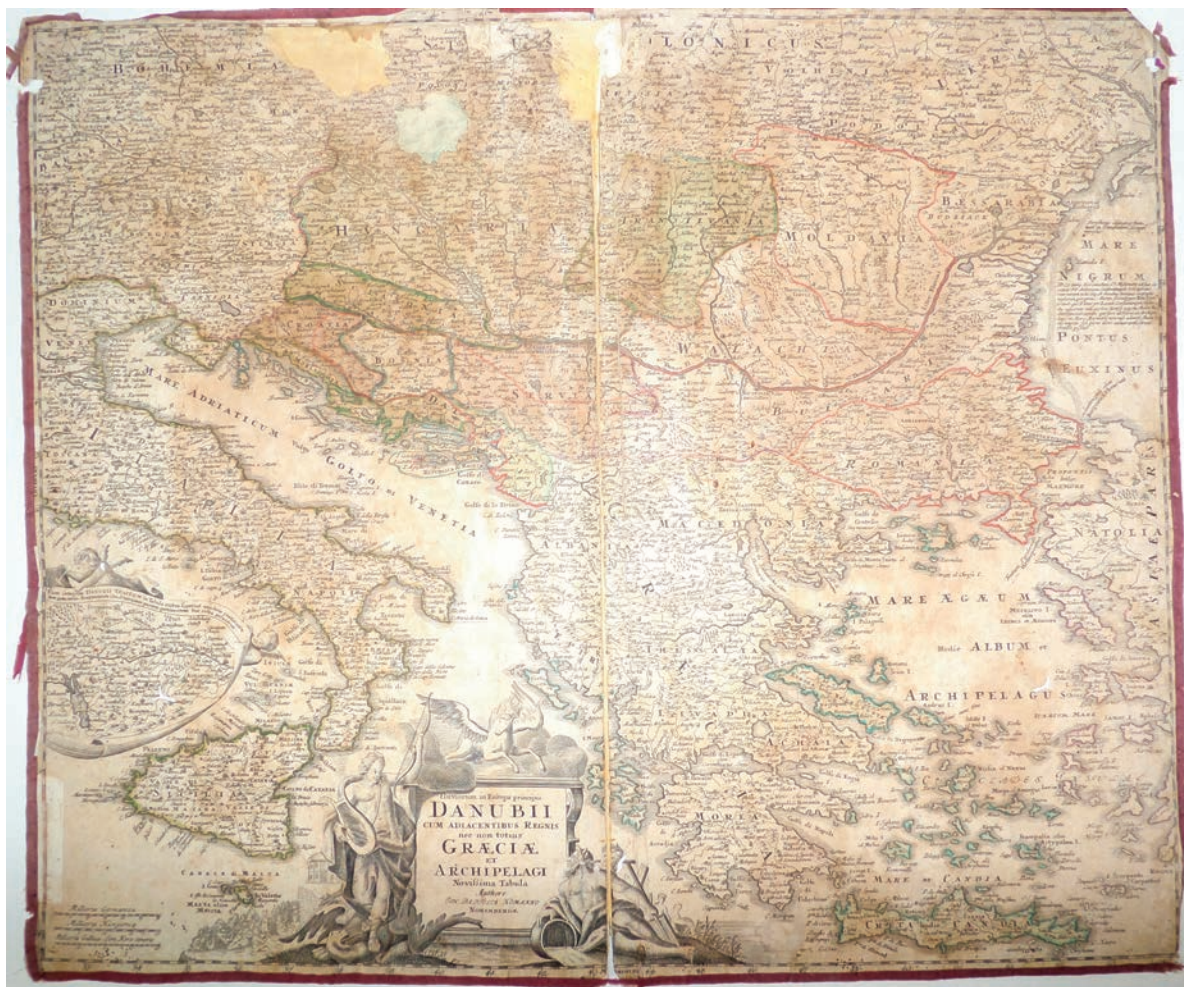
Рис. 4. Гоманн, Йоганн Баптист. Карта «Річка Дунай, що бере початок в Європі, разом з іншими королівствами і напевне навіть усією Грецією і Архіпелагами», Німеччина, Нюрнберг, між 1713-1716 рр.