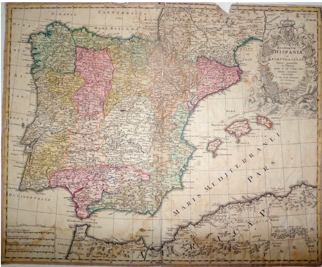
Рис. 2. Гоманн, Йоганн Баптист. Карта «Королівства Іспанія та Португалія. Карта генеральна збільшена із використанням новітніх знань пристосована Йоганом Баптистом Гоманом, головним географом кайзера Священної Римської імперії. Нюрнберг». Німеччина, Нюрнберг, після 1716 р.

М. Оксеніч висловлює думку, що карта походить з першого тому «Atlas Novus Terrarum Orbis Imperia Regna et Status Exactis Tabulis Geographico demonstrans. Opera Iohannis Bapstiae Homanni. Norimbergae» 1746 р. У різних інтернет-джерелах вказуються різні дати створення карти. Це ускладнює встановлення точної дати. Вдалося визначити ще один атлас, в якому опублікована вищевказана карта – «Atlas factice of 32 maps and 1 distance table, produced by the Homann Erben firm» (Збірний атлас з 32 карт та 1 таблиці відстаней, виданий фірмою «Спадкоємці Гоманна») 1701–1760 рр. Створення карти для цього атласу датується 1728 роком 7 . Тобто карту слід датувати 1-ю половиною XVIII ст., після 1716 року.