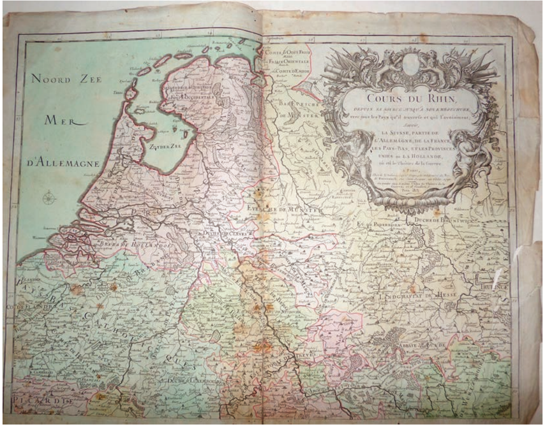
Рис. 6. Дено, Луї Шарль. Карта «Курс Рейну від його витоків до гирла з усіма місцевостями, які він перетинає і з якими межує, Швейцарія, частина Німеччини, Франція, Нідерланди, об'єднані провінції Голландії, де знаходиться театр воєнних дій», Франція, Париж, 1790 р.