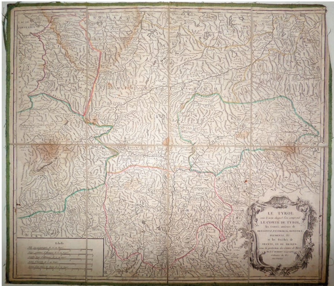
Рис.1. Вогонді, Жіль Робер де. Карта «Тироль, під ім'ям якого мається на увазі графство Тироль, приєднані графства Брегенц, Фельдкірк, Монфор, Плуденц та інші, і єпархії Трент і Бріксен, які під протекцією Тироля». Франція, до 1757 р.

та герцога Лотарингії і Бара, а також члена Королівської академії наук в Нансі. З Королівським привілеєм, 1757) 5 .