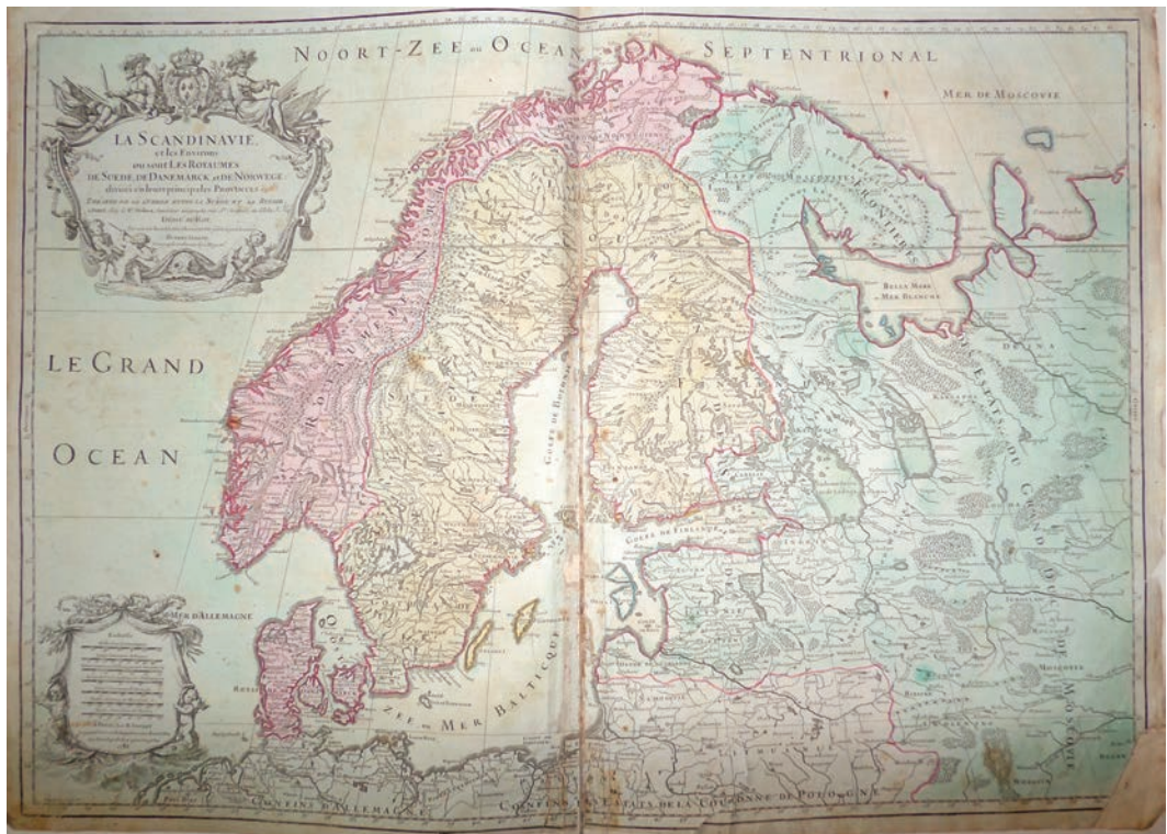
Рис. 7. Дено, Луї Шарль. Карта «Скандинавія та околиці, де знаходяться королівства Швеції, Данії та Норвегії. Містечко війни між Швецією та Росією», Франція, Париж, 1788 р.