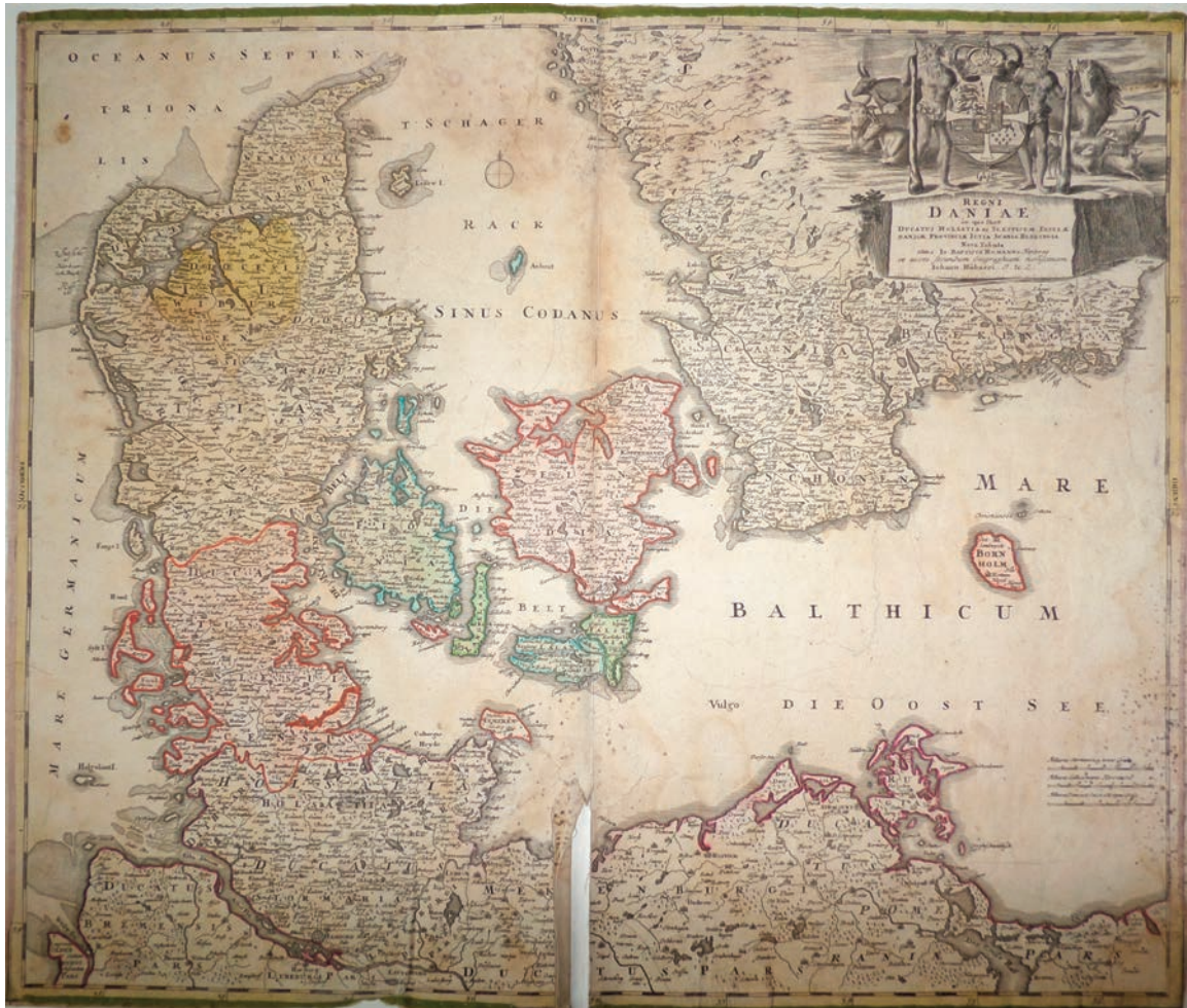
Рис. 3. Гоманн, Іоганн Баптист; Гюбнер, Іоганн. Карта «Королівство Данії, до якого входять князівства Гольштінії та Шлезвігу, Датські острови, провінція Ютландія, Сконе, Блекінге». Німеччина, Нюрнберг, до 1716 р.

Наступна карта «Річка Дунай, що бере початок в Європі, разом з іншими королівствами і напевне навіть усією Грецією і Архіпелагами» (ГРЛ-5024) (рис. 4) за авторством Йоганна Баптиста Гоманна створена в проміжок часу між 1713 р. та 1716 р. В 1716 р. Гоманн отримав привілей, який надалі і вказував на своїх картах. Оскільки ця ознака відсутня в картуші, а дата «1713» вказана в пояснювальному тексті на самій карті, цим самим і обумовлюється датування карти. У верхній частині зображена течія річки Дунай (Danubii – латинською мовою), яка проходить через території Баварії (сучасна територія Німеччини), Угорщини, князівств Трансильванії, Валахії та Молдавії (сучасна територія Румунії), Болгарії,