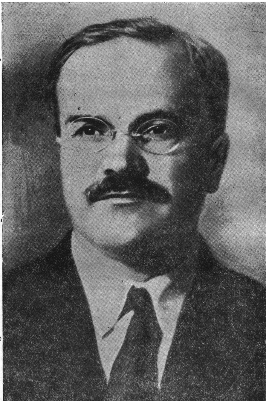
ВЯЧЕСЛАВ МИХАЙЛОВИЧ МОЛОТОВ