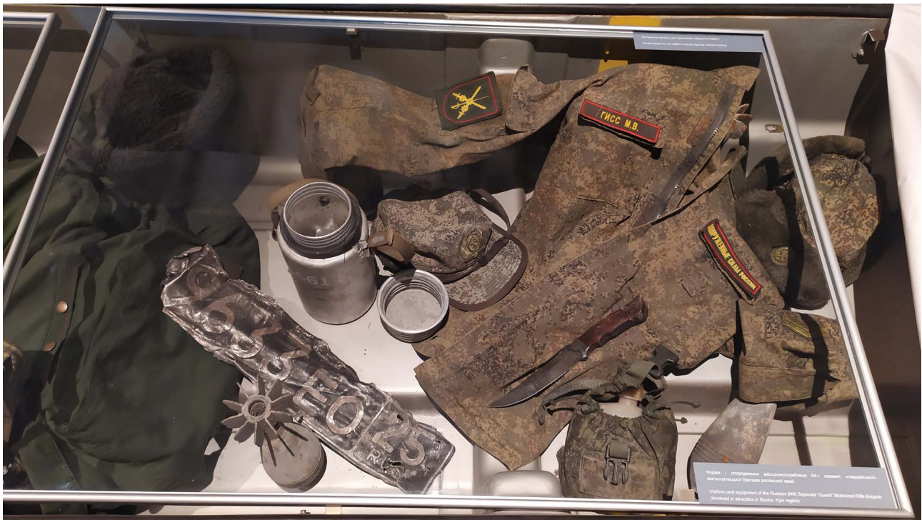
Додаток 3. Літня польова куртка військовослужбовця Збройних сил Російської Федерації Гісса М.В. 2022 р.

В експозиції вже згаданої виставки «Україна – розп'яття» представлені форма і спорядження одного з військовослужбовців 64-ї окремої гвардійської мотострілецької бригади, на прізвище Гісс, знайдені під час музейної експедиції 10 квітня 2022 р. до місць боїв на північних околицях смт Макарів Бучанського району Київської області [36] (Додаток 3).