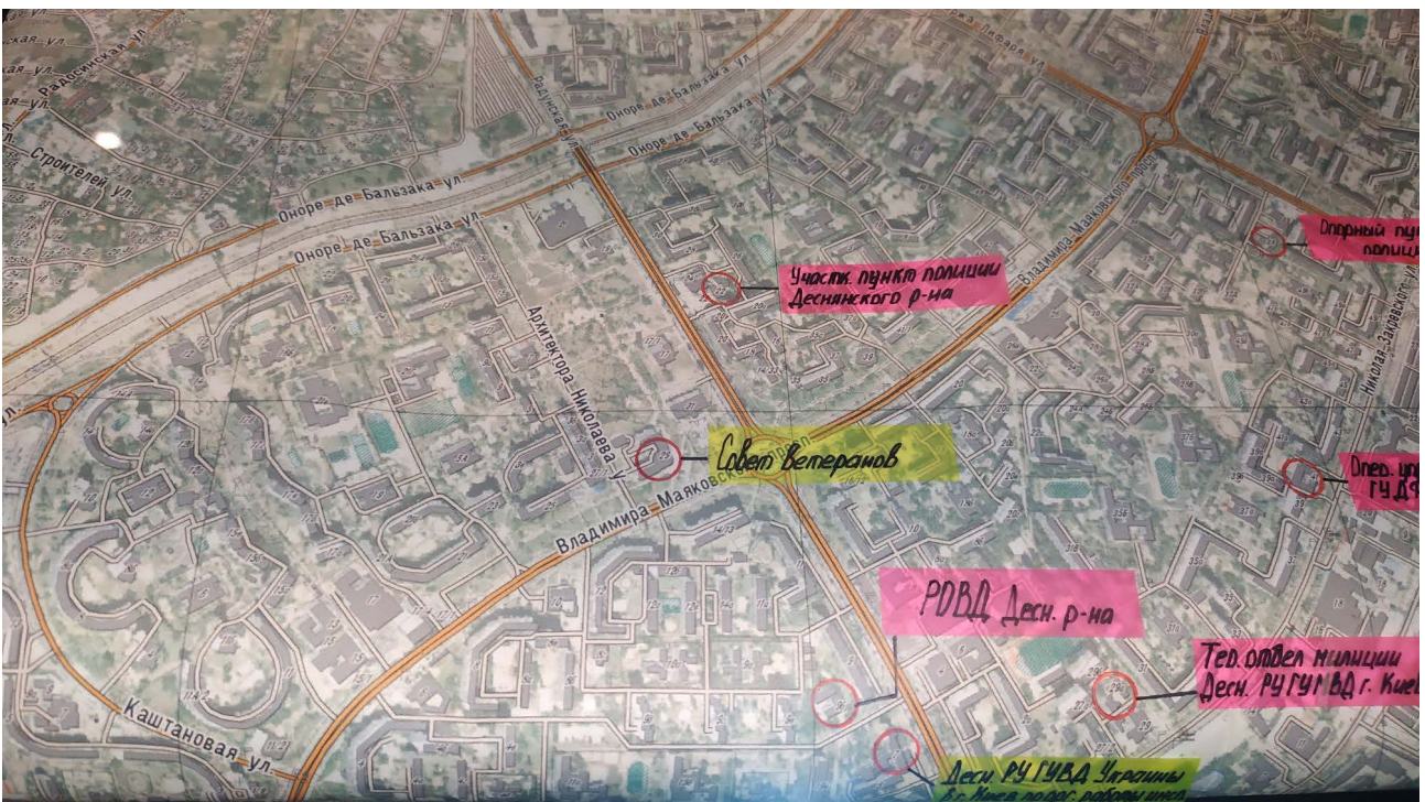
Додаток 2. Робоча карта Дарницького району, яку використовували диверсійно-розвідувальні групи. м. Київ. 2022 р.