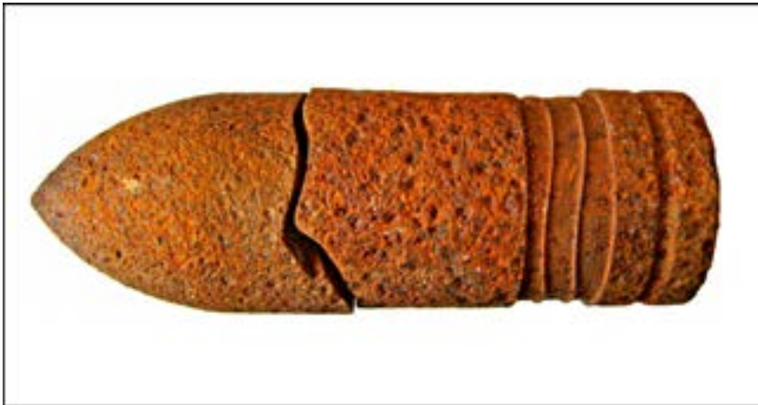
Бронебійний снаряд калібру 57 мм [51].

(«Черчилль»), Matilda («Матільда») і Valentine («Валентайн»). За програмою ленд-лізу певну кількість цих танків було надано Червоній армії. Чимало з них справді брали участь у боях за Київщину восени 1943 р.