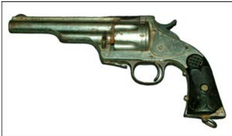
Револьвер Merwin & Hulbert Frontier 4th Model [14].

Серед інших цікавих зразків цього періоду, які використовували афганці в боротьбі з радянськими військами, був американський револьвер Merwin & Hulbert Frontier 4th Model, виготовлений між 1887 та 1891 рр. Це доволі рідкісна зброя, ціна якої на сучасних аукціонах сягає 1000 доларів США.