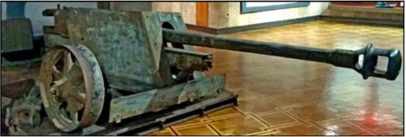
75-мм протитанкова гармата PaK 40. Зал № 12 [40].