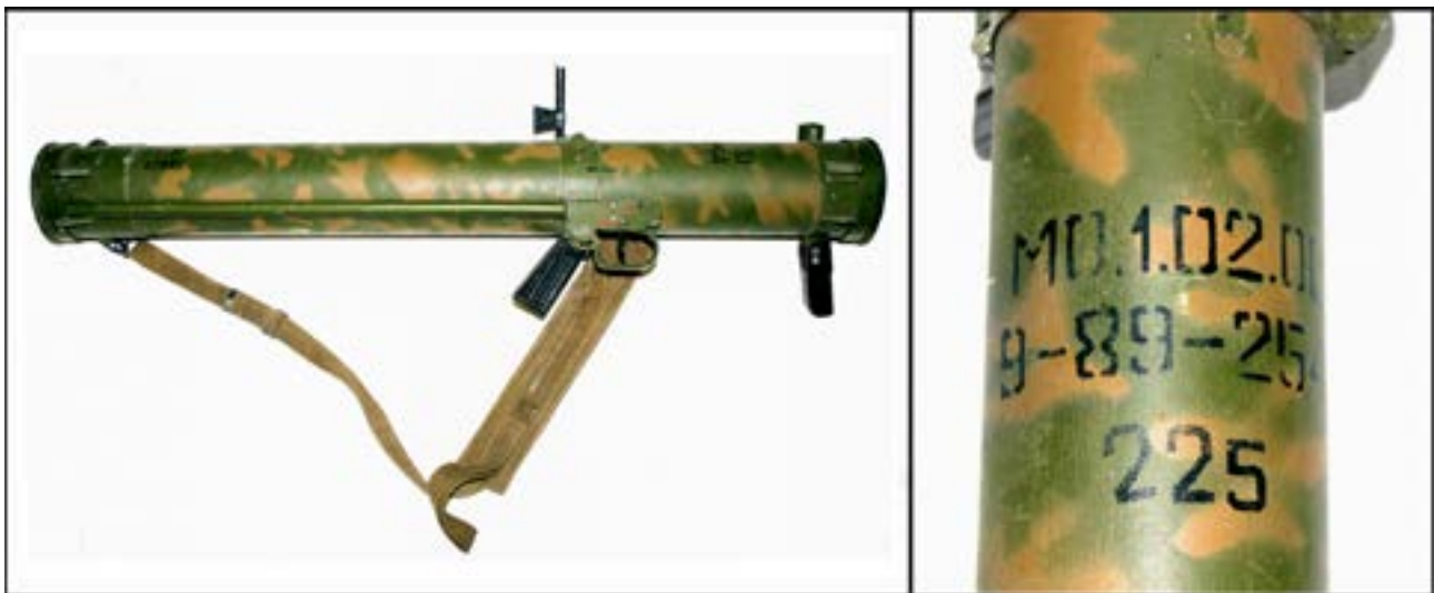
Пусковий пристрій ручного піхотного вогнемета РПО-А «Шмель» [34].

Наразі у фондозбірні є три вогнемети «Шмель», привезені з місць боїв на Сході України. Зображений нижче вогнемет був скомплектований співробітниками Музею під час відрядження до зони бойових дій. Він виготовлений у 1989 р., що підтверджує маркування.