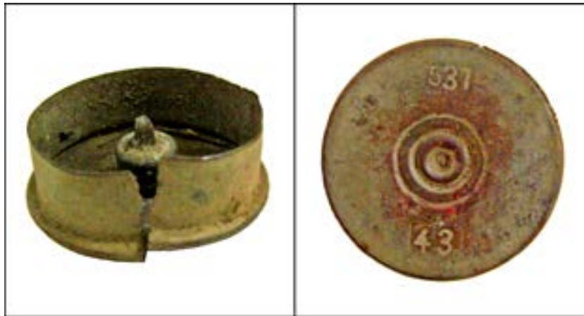
Фрагмент гільзи від патрона до сигнального пістолета калібру 26 мм [49].

Те саме можна сказати і про гільзу калібру 14,5 мм, яка була складником патрона до протитанкових рушниць Дегтярьова та Симонова: «3» – позначення Ульяновського патронного заводу, «42» – рік випуску.