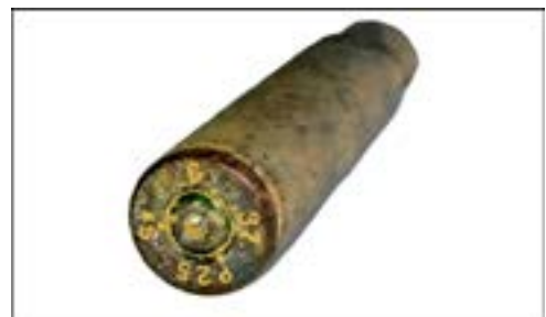
Гільза калібру 7,92 мм [48].

На денці гільзи, зображеної на знімку нижче, міститься маркування у вигляді символів «P25», «S*», «6» і «37». «P25» – це позначення заводу «Зебальдусгоф» у м. Троєнбрицен (нині – федеральна земля Бранденбург), «S*» – підтвердження того, що гільза повністю виготовлена з латуні, «6» – номер партії, «37» – рік випуску.