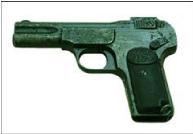
Пістолет Browning M1900 [26].