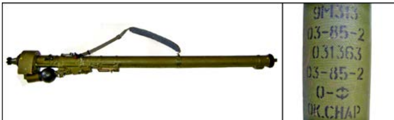
Пускова труба 9П322 переносного зенітно-ракетного комплексу 9К310 «Игла-1» [32].

На відбитих у проросійських бойовиків позиціях були вилучені й ПЗРК «Игла-1». Цю зброю постачали терористам із території РФ. Зокрема, відомо, що нею було збито кілька українських вертольотів та сумнозвісний Іл-76Д в Луганському аеропорту. Цей комплекс перебуває і на озброєнні ЗСУ, проте на Донбасі не застосовувався через відсутність достойних цілей. На фото нижче – екземпляр, вилучений під час спецоперацій у районі м. Дебальцеве. Принцип розшифрування маркування цього зразка такий самий, як і гранатометних пускових пристроїв: «9М313» – індекс ракети, «03» – номер партії ракети, «85» – рік виготовлення ракети, «2» – індекс заводу – виробника ракети, «031363» – обліковий номер ракети. Нижче вказані складальні дані, а також тип і стан бойової частини: «03» – номер партії складання, «85» – рік складання, «2» – індекс складального заводу, «О-Ф» – осколково-фугасна дія бойової частини, «ОК СНАР» – «окончательно снаряжённый», тобто готовий до застосування боеприпас.