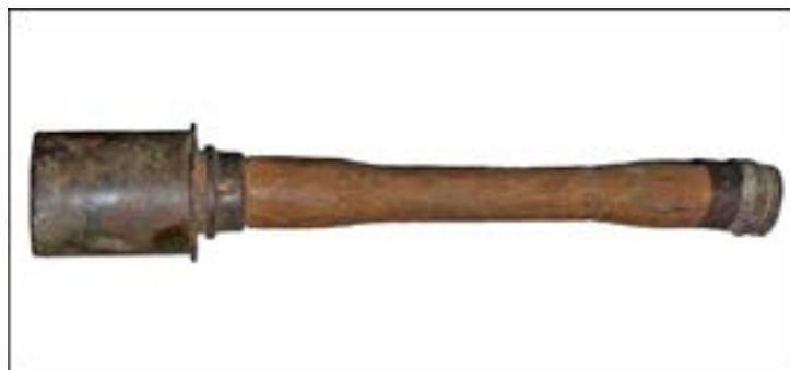
Ручна граната Stielhandgranate M24. Зал № 1 [30].

У німецькій армії найпоширенішою була граната з довгим дерев'яним руків'ям – Stielhandgranate M24. Вона хоч і не була потужною, проте її можна було кинути значно далі, ніж інші гранати. Один солдат військ СС установив рекорд, метнувши її на 70 м [57, 55]. Застосовували у Вермахті й гранату Eihandgranate M39, у перекладі – «яйцеподібна граната». Обидва зразки представлено в залі № 1 Музею.