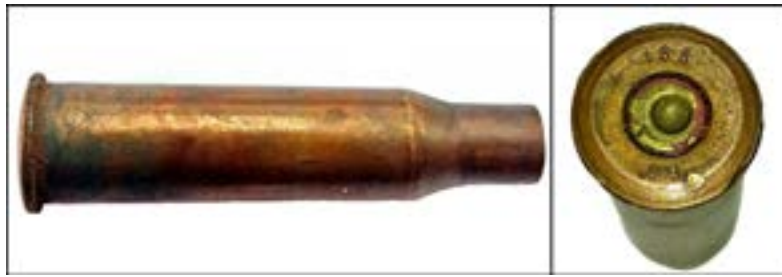
Гільза калібру 7,62 мм [54].

Автоматні гільзи калібру 5,45 мм так само легко описати. Наприклад, «270» – позначення Луганського патронного заводу, «82» – рік випуску.