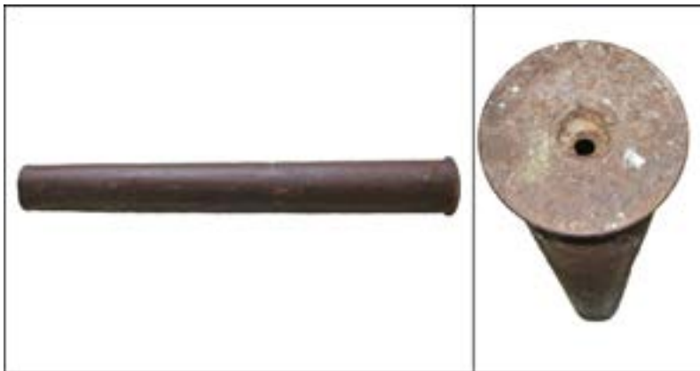
Гільза артилерійського боеприпасу калібру 75 мм [47].

Нерідко на опис потрапляють залишки озброєння та боеприпасів, на яких маркування розібрати вже неможливо або ж воно взагалі відсутнє. У цьому випадку доцільно порівняти форми й розміри з можливими аналогами. Одного разу до Музею на опис надійшла гільза артилерійського боеприпасу без будь-яких маркувань, позначень. Її було знайдено на місцях боїв між Червоною армією та Вермахтом, що тривали восени 1943 р. західніше м. Київ. Відмірявши діаметр, вдалося встановити калібр – 7,5 см. Зрозуміло, що знахідку можна було б сплутати з гільзами для радянської гармати ЗІС-3, яка мала приблизно такий самий калібр – 76 мм. Але така продовгувата форма для них не характерна – вони значно коротші. Довжина цієї гільзи становила 71,5 см, а діаметр фланця – 10 см.