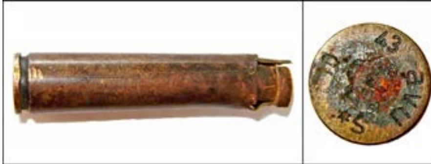
Гільза калібру 7,92 мм [52].

На денці гільзи воєнного періоду на світлині нижче помічаємо символи «ави», «S*», «10» і «43», де «ави» – позначення металообробного товариства «Зільва» в м. Гентін (нині – федеральна земля Саксонія-Ангальт), «S*» – підтвердження того, що гільза повністю виготовлена з латуні, «10» – номер партії, «43» – рік випуску.