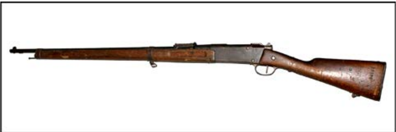
Гвинтівка Lebel M1886 [16].

Солдати Угорської королівської армії під час Другої світової війни користувалися гвинтівкою свого вітчизняного виробництва – FEG 35М. Італійські війська під час війни мали різні варіанти гвинтівки системи Манліхера – Каркано. Серед них варто відзначити карабін Mannlicher-Carcano M1891 da Cavalleria, призначений саме для кавалеристів. І угорську, й італійську гвинтівки можна бачити в експозиції залу № 13 Музею.