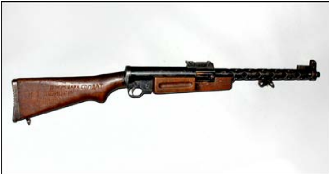
Пістолет-кулемет ZK-383 [29].

Дуже часто зброя різних періодів випусків має свої конструктивні особливості. Відповідно ранні зразки дещо відрізняються від пізніших. Це можна продемонструвати на прикладі доволі цікавого незвичного чехословацького пістолета-кулемета ZK-383, який зберігається у фондозбірні. На музейному зразку на кожуху ствола є кільце для встановлення двоногої сошки. Ця особливість відрізняє зброю ранніх випусків. Пізніші зразки сошок не мали. Пістолет-кулемет ZK-383 почали виготовляти для армії Чехословаччини в 1938 р. Відомо, що із захопленням цієї країни Вермахт узяв на озброєння й певну кількість таких пістолетів-кулеметів [7, 234]. Очевидно, під час німецько-радянської війни нинішній музейний зразок був захоплений як трофей військовослужбовцем Червоної армії. Вирізьблені слова російською на прикладі «11 німецьких солдатів і один офіцер знищив М С» та 12 зарубок на зворотному боці свідчать про результативність бійця.