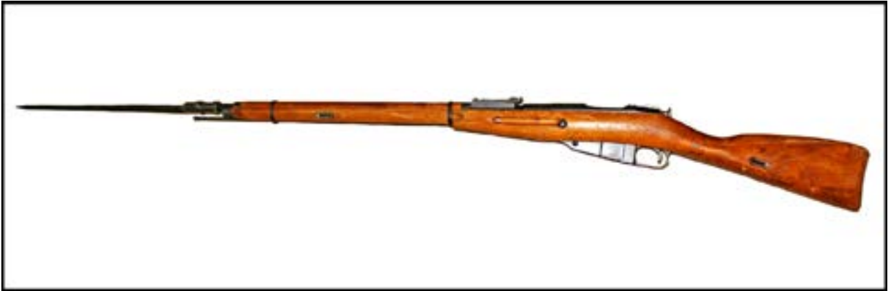
Гвинтівка системи Мосіна зразка 1891/1930 рр. [18].

У Червоній армії зброєю звичайного бійця була гвинтівка системи Мосіна зразка 1891/1930 рр., або «трюхлінійка». Їй притаманні тонкі ложе та приклад без виступу для правої руки. У Вермахті такою зброєю був карабін Mauser 98k. Його дуже легко відрізнити від гвинтівок інших систем завдяки круглому диску на прикладі. Варто зауважити, що з десятих бійців німецького піхотного відділення сім були озброєні саме цим карабіном. Тому типовий образ німецьких солдатів, які в повному складі озброєні автоматами чи кулеметами, – це не більше ніж витвір кінематографа пізніших років.