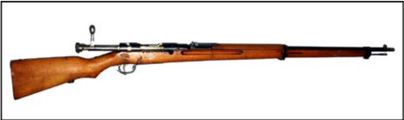
Гвинтівка Arisaka Type 38 [19].

Японська імператорська армія була озброєна гвинтівкою Arisaka Type 38. На фото нижче – трофей, захоплений у Квантунської армії.