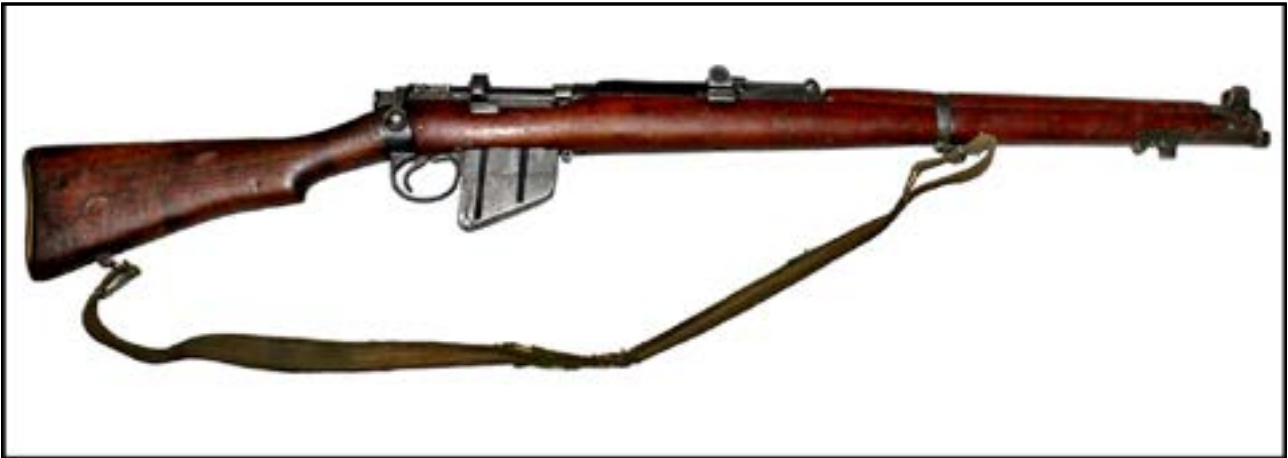
Гвинтівка Lee-Enfield No.1 Mk.III [10].