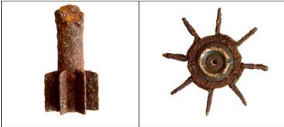
Стабілізатор для німецької міни Wgr.36 калібру 50 мм [44].

Так само і в стабілізатора для німецької міни Wgr.36 калібру 50 мм на денці вибивного патрона є символи «RWS», «28», «38». «RWS» – це позначення акціонерного товариства «Rheinisch-Westfälische Sprengstoff» у м. Нюрнберг, «28» – діаметр вибивного патрона в калібрах, «38» – рік випуску.