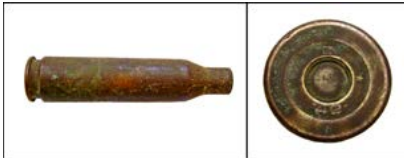
Гільза калібру 14,5 мм [46].

Те саме можна сказати і про гільзу калібру 14,5 мм, яка була складником патрона до протитанкових рушниць Дегтярьова та Симонова: «3» – позначення Ульяновського патронного заводу, «42» – рік випуску.