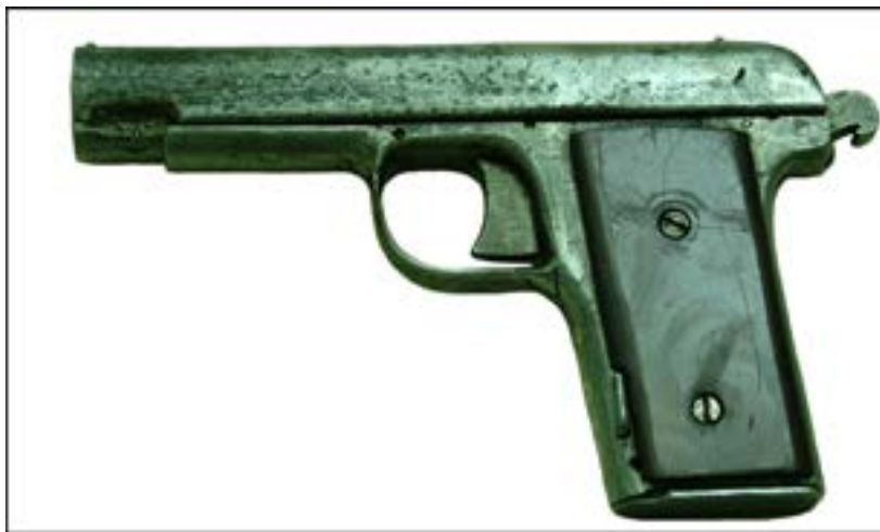
Саморобний пістолет [35].

Фондозбірня багата й на інші зразки таких артефактів. Зокрема, в ній є саморобний пістолет, який видається спробою скопіювати пістолет системи ТТ (Тульський Токарева). Уміщене нижче фото дає яскраве уявлення, наскільки просто виконаний зразок.