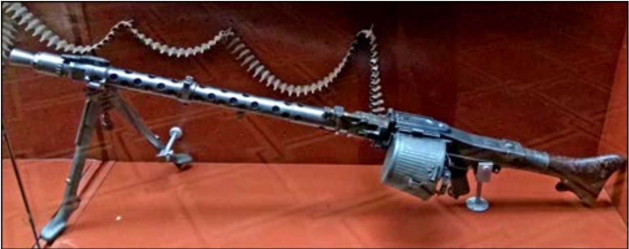
Кулемет MG-34. Зал № 11 [28].