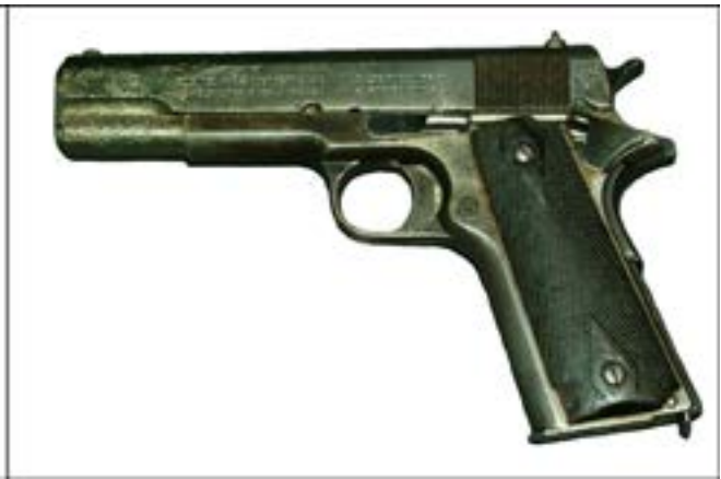
Пістолет Colt M1911 [22].

Тулський збройовий завод лише поступово освоїв технологію виробництва напівавтоматичних пістолетів. Тож добре помітною є різниця між доволі простим виглядом ТТ зразка 1930 р. (на фото нижче – ліворуч) і вельми технологічним – ТТ зразка 1933 р. (на фото нижче – праворуч). Якщо перший мав дерев'яні щічки руків'я, то останній уже виготовлявся з пластмасовими [7, 194–195].