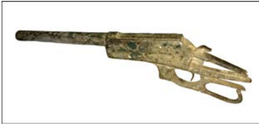
Фрагмент гвинтівки Winchester M1895. Зал № 3.