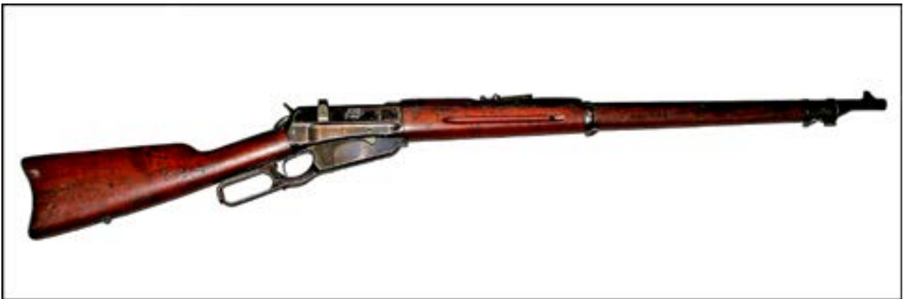
Гвинтівка Winchester M1895 [20].

Таку зброю більшість людей бачила зазвичай в американських вестернах. До речі, ця гвинтівка має досить цікаву історію появи на теренах України та бойового застосування тут. У роки Першої світової війни американська компанія Winchester уклала контракт на постачання цієї зброї для Російської імператорської армії під патрон калібру 7,62 мм. Після завершення війни й повалення монархії в Росії ці гвинтівки тривалий час зберігалися на складах Червоної армії [3, 26]. Із початком німецько-радянської війни «вінчестери» надійшли до частин народного ополчення й застосовувалися в боях, зокрема й на підступах до м. Київ.