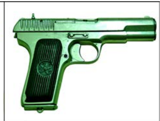
Пістолети системи Токарева зразка 1930 р. (ліворуч) і зразка 1933 р. (праворуч) [37; 9].

Досить важливо детально ідентифікувати рештки боєприпасів, зокрема гільзи. При цьому слід звертати увагу на форму, розміри і, звичайно ж, маркування. Така проста, на перший погляд, річ, як гільза, завдяки маркуванню дає важливу інформацію про місце й час виготовлення боєприпасу.