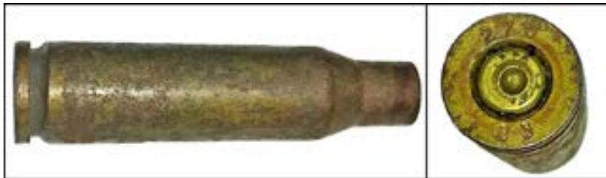
Гільза калібру 5,45 мм [55].

На гільзах, які виготовлено у ХХІ ст., маркування року випуску теж складається із двох цифр. Наприклад, на зображеній нижче гільзі позначення «03» означає 2003 р.