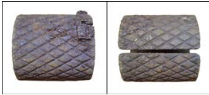
Осколковий оборонний чохол (сорочка) для ручної гранати РГД-33 [43].

Під час Другої світової війни бойове хрещення пройшла й широковідома граната Ф-1, створена на основі однойменної французької гранати часів Першої світової. Завдяки своїй надійності й простоті вона досі перебуває на озброєнні багатьох країн світу.