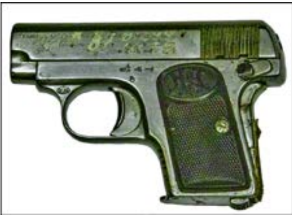
Пістолет Premier 1913 cal. 6,35 [23].