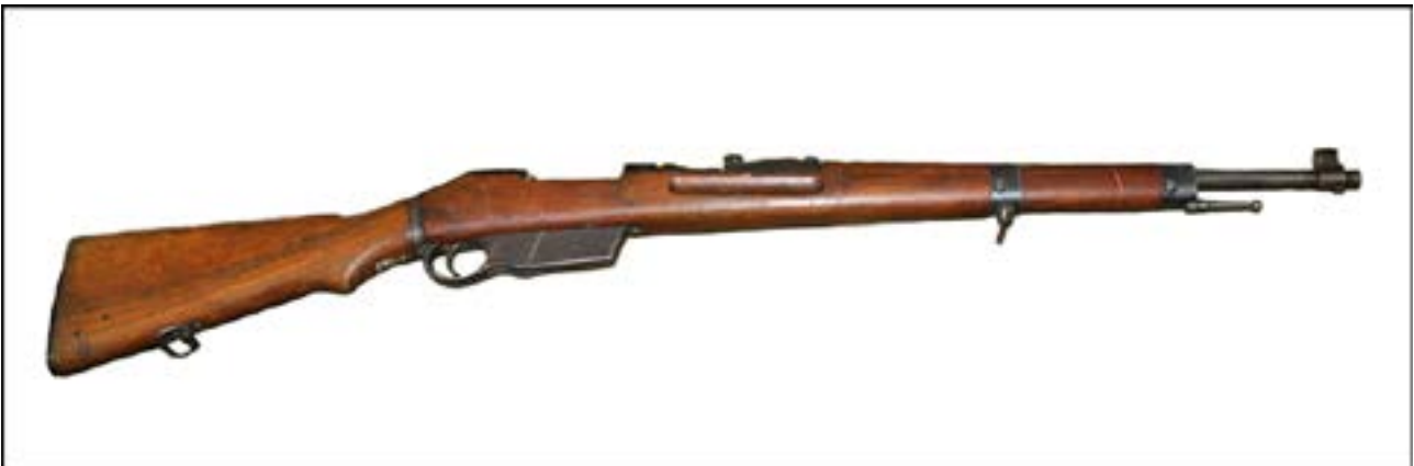
Гвинтівка FEG 35М. Зал № 13 [24].

Солдати Угорської королівської армії під час Другої світової війни користувалися гвинтівкою свого вітчизняного виробництва – FEG 35М. Італійські війська під час війни мали різні варіанти гвинтівки системи Манліхера – Каркано. Серед них варто відзначити карабін Mannlicher-Carcano M1891 da Cavalleria, призначений саме для кавалеристів. І угорську, й італійську гвинтівки можна бачити в експозиції залу № 13 Музею.