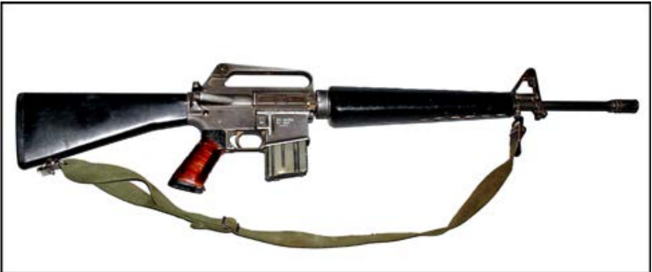
Штурмова гвинтівка M16 [13].