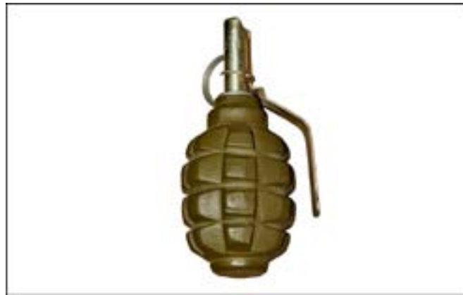
Ручна граната Ф-1 [36].

Під час Другої світової війни бойове хрещення пройшла й широковідома граната Ф-1, створена на основі однойменної французької гранати часів Першої світової. Завдяки своїй надійності й простоті вона досі перебуває на озброєнні багатьох країн світу.