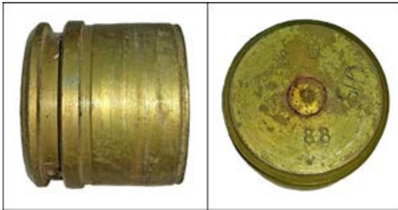
Гільза калібру 30 мм від боєприпасу до автоматичного станкового гранатомета АГС-17 [53].

Досить часто дату створення можна розібрати й на фрагментах боєприпасів, вилучених на місцях артобстрілів. Так, на носовій частині з детонатором від реактивного снаряда РСЗО БМ-27 «Ураган», знайдений на місці обстрілу українських позицій у 2018 р. поблизу смт Луганське на Донеччині, помітно маркування «3-88», де «3» – номер партії, а «88» – рік випуску. Таку потужну смертоносну зброю, як БМ-27 «Ураган» застосовували обидві сторони. Лише після Мінських домовленостей установки були поступово відведені з позицій.