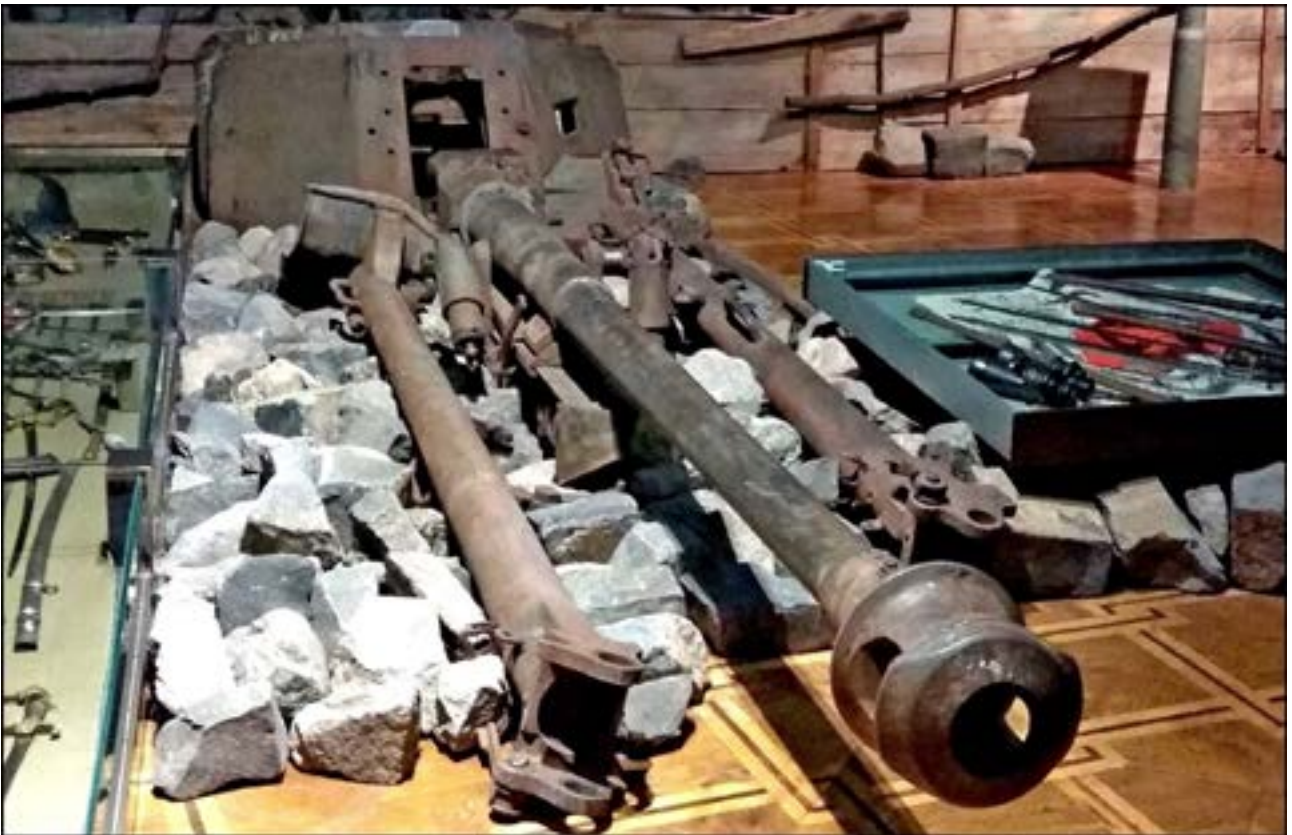
75-мм протитанкова гармата PaK 40. Зал № 13 [41].

Ще один приклад – 57-мм бронебійний снаряд, який було знайдено на місцях боїв між Червоною армією та Вермахтом, що тривали восени 1943 р. поблизу смт Гостомель Київської області. Установлення калібру спершу дало змогу припустити, що це боеприпас до радянської протитанкової гармати ЗІС-2. Та виявилось, що її снаряди мають зовсім іншу форму. А напрямний поясок знайденого предмета мав хвилясті лінії, що характерно для англійських боеприпасів. У процесі дослідження було з'ясовано, що це снаряд британської протитанкової шестифунтової гармати QF, яку встановлювали в башти танків Churchill