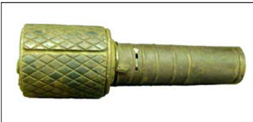
Ручна граната РГД-33. Зал № 3 [39].

У Червоній армії однією з найпоширеніших була РГД-33 – ручна граната Дьяконова зразка 1933 р. Досить часто на ці гранати встановлювали так званий оборонний чохол (інша назва «сорочка»). Це металева насадка з помітними ромбоподібними поділками для утворення якомога більшої кількості осколків під час вибуху. Досить значна кількість цих сорочок були скомплектовані співробітниками, і нині вони представлені в експозиції або зберігаються у фондах.