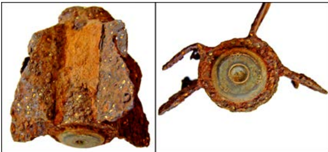
Стабілізатор для радянської міни О-832 калібру 82 мм [45].

Наприклад, у зображеного нижче стабілізатора для радянської міни О-832 калібру 82 мм помітні маркування у вигляді цифр «58», «20» і «39». Цифра «58» – це позначення Московського дроболиварного патронного заводу ім. К.Є. Ворошилова, «20» – діаметр вибивного патрона в міліметрах, «39» – рік випуску.