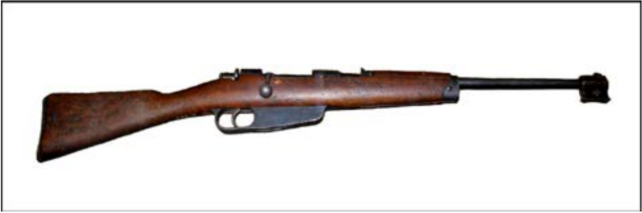
Карабін Mannlicher-Carcano M1891 da Cavalleria. Зал № 13 [25].

Японська імператорська армія була озброєна гвинтівкою Arisaka Type 38. На фото нижче – трофей, захоплений у Квантунської армії.