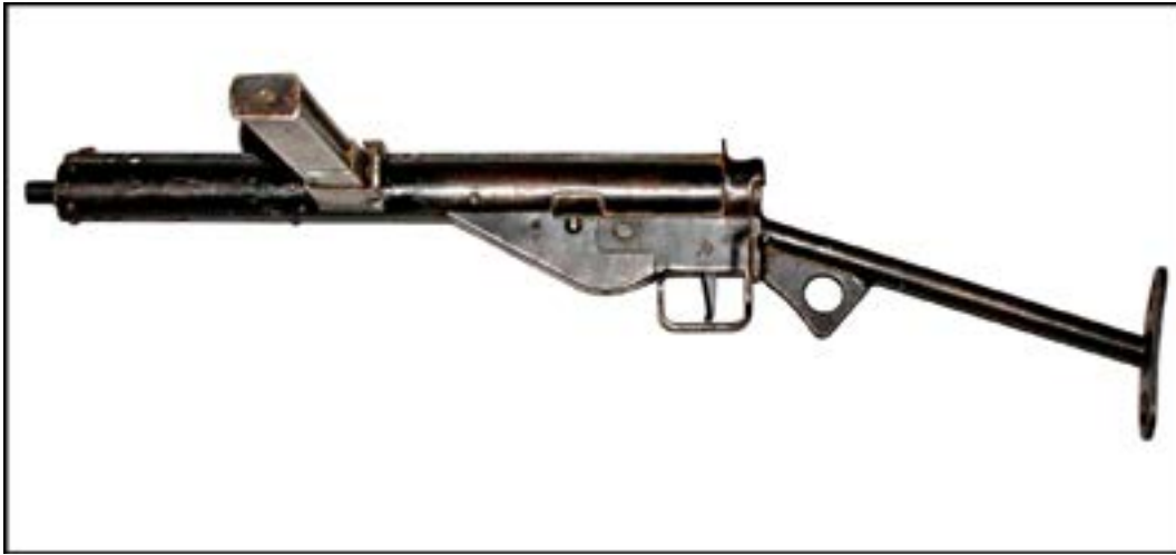
Пістолет-кулемет Sten Mk.III [11].

Фондозбірня багата й на інші зразки таких артефактів. Зокрема, в ній є саморобний пістолет, який видається спробою скопіювати пістолет системи ТТ (Тульський Токарева). Уміщене нижче фото дає яскраве уявлення, наскільки просто виконаний зразок.