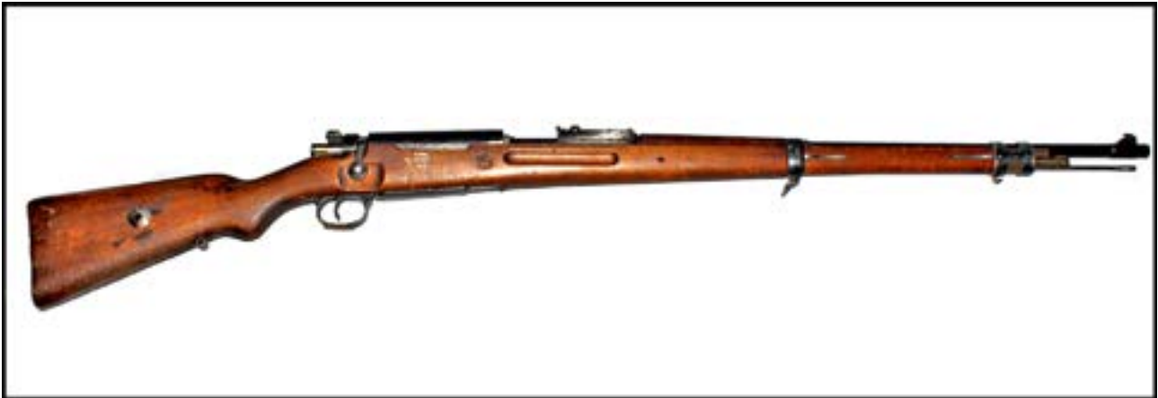
Карабін Mauser 98k [21].

Британська армія в Першій та Другій світових війнах застосовувала гвинтівку Lee-Enfield. Так само і французи в першій половині ХХ ст. використовували свою гвинтівку Lebel M1886. Цікаво, що обидва зразки надійшли до Музею як трофеї, захоплені в бійців збройної опозиції в Афганістані.