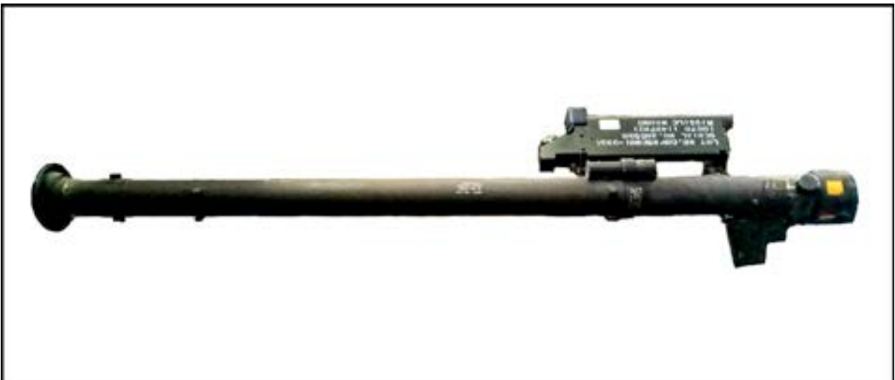
Пускова труба переносного зенітно-ракетного комплексу FIM-92 Stinger [17].

Як відомо, до Музею надходить велика кількість залишків озброєння та боєприпасів, пов'язаних із подіями сьогодення, а саме війною на Сході України. По суті, його співробітникам випала нагода способом детального дослідження предмета вкотре підтвердити російську присутність на Донбасі. Адже у фондозбірні є предмети, які не перебували на озброєнні українських формувань, натомість відомо, що такі зразки використовуються в російській армії. Серед них – ручний протитанковий гранатомет РПГ-26 «Аглень». Гранатомет виготовляється від 1985 р., але на озброєнні української армії не перебуває. Його основний виробник – це завод № 254 у м. Челябінськ, також відомий як Виробниче об'єднання «Сигнал». На маркуванні зображеного нижче гранатомета, знайденого в районі с. Гранітне Волноваського району Донеччини, помітні символи: «РПГ-26». Нижче – «254», це і є позначення вже згаданого заводу-виробника пускового