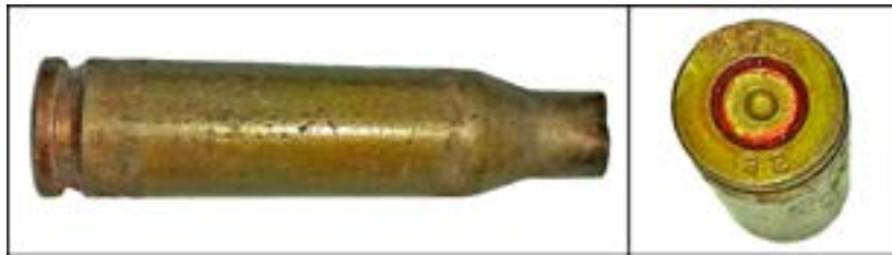
Гільза калібру 5,45 мм [56].

Автоматні гільзи калібру 5,45 мм так само легко описати. Наприклад, «270» – позначення Луганського патронного заводу, «82» – рік випуску.