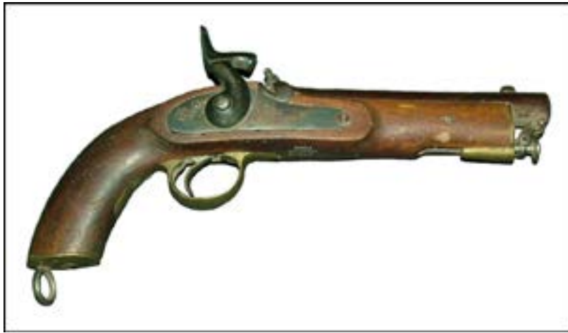
Пістолет Enfield з ударно-капсульним замком [15].

Серед інших цікавих зразків цього періоду, які використовували афганці в боротьбі з радянськими військами, був американський револьвер Merwin & Hulbert Frontier 4th Model, виготовлений між 1887 та 1891 рр. Це доволі рідкісна зброя, ціна якої на сучасних аукціонах сягає 1000 доларів США.