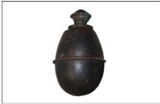
Ручна граната Eihandgranate M39. Зал № 1 [31].

Загалом цікаво, що завдяки наявним у фондах зразкам озброєння та боеприпасів ми можемо висвітлити чи не кожен військовий конфлікт ХХ ст. Зокрема, чимало трофеїв надійшло з Афганістану. Вражає як кількість, так і різноманіття зразків озброєння бійців афганської опозиції. Це зброя різних епох та країн-виробників, що стала цінними експонатами фондової колекції. Насамперед варто відзначити зразки часів британської колоніальної експансії, такі як карамультук з ударно-капсульним замком другої половини ХІХ ст., а також пістолет Enfield, що має той самий принцип дії і виготовлений також у другій половині ХІХ ст.