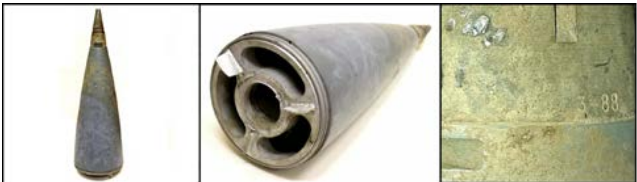
Носова частина з детонатором від реактивного снаряда РСЗО БМ-27 «Ураган» [50].

Досить часто дату створення можна розібрати й на фрагментах боєприпасів, вилучених на місцях артобстрілів. Так, на носовій частині з детонатором від реактивного снаряда РСЗО БМ-27 «Ураган», знайдений на місці обстрілу українських позицій у 2018 р. поблизу смт Луганське на Донеччині, помітно маркування «3-88», де «3» – номер партії, а «88» – рік випуску. Таку потужну смертоносну зброю, як БМ-27 «Ураган» застосовували обидві сторони. Лише після Мінських домовленостей установки були поступово відведені з позицій.