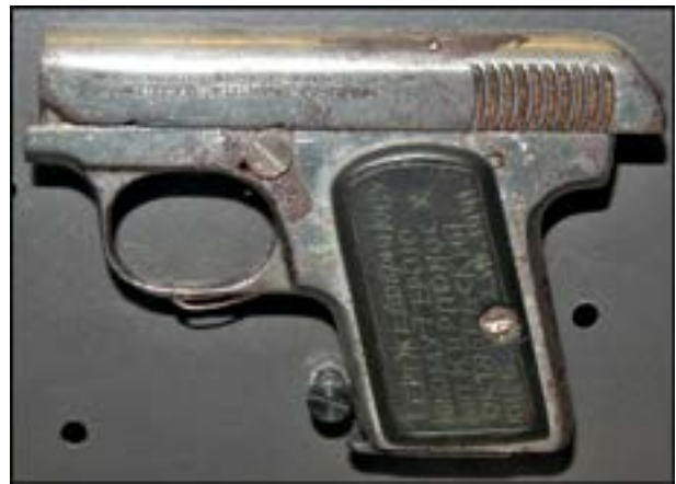
Пістолет Browning M1906. Зал № 3 [38].

Дуже часто зброя різних періодів випусків має свої конструктивні особливості. Відповідно ранні зразки дещо відрізняються від пізніших. Це можна продемонструвати на прикладі доволі цікавого незвичного чехословацького пістолета-кулемета ZK-383, який зберігається у фондозбірні. На музейному зразку на кожуху ствола є кільце для встановлення двоногої сошки. Ця особливість відрізняє зброю ранніх випусків. Пізніші зразки сошок не мали. Пістолет-кулемет ZK-383 почали виготовляти для армії Чехословаччини в 1938 р. Відомо, що із захопленням цієї країни Вермахт узяв на озброєння й певну кількість таких пістолетів-кулеметів [7, 234]. Очевидно, під час німецько-радянської війни нинішній музейний зразок був захоплений як трофей військовослужбовцем Червоної армії. Вирізьблені слова російською на прикладі «11 німецьких солдатів і один офіцер знищив М С» та 12 зарубок на зворотному боці свідчать про результативність бійця.