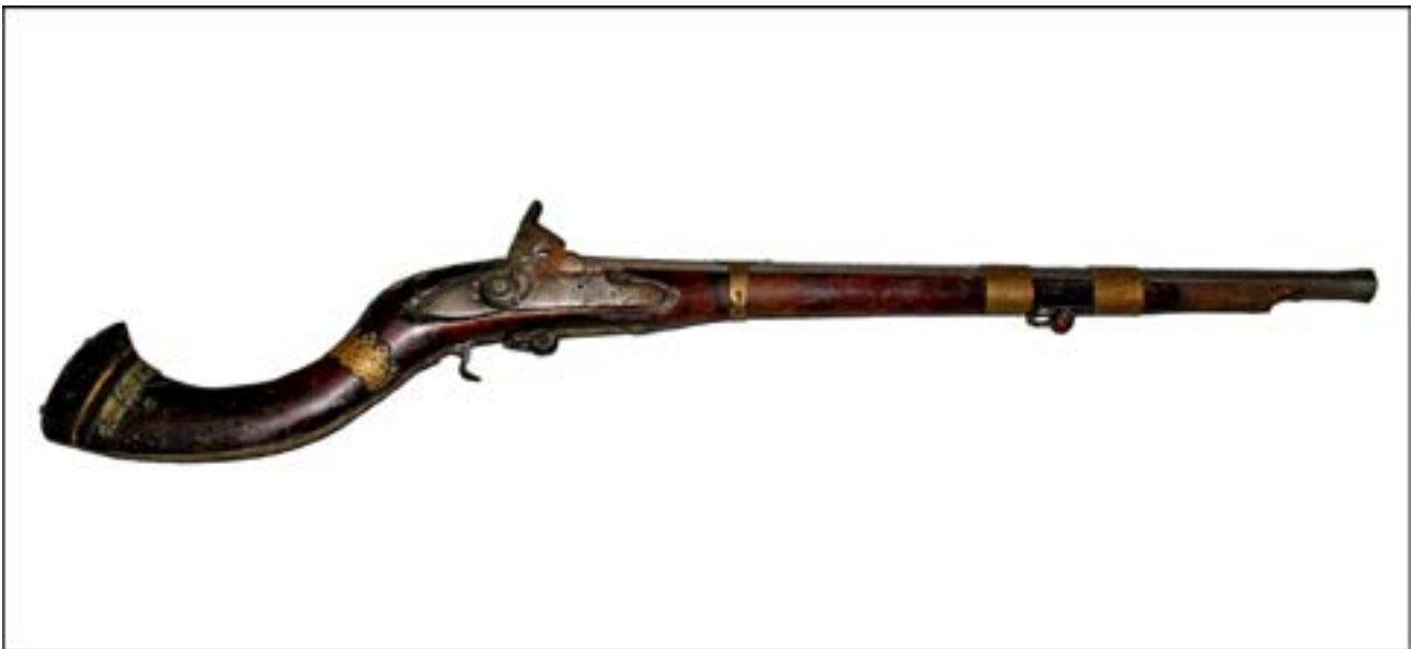
Карамультук з ударно-капсульним замком [12].

Загалом цікаво, що завдяки наявним у фондах зразкам озброєння та боеприпасів ми можемо висвітлити чи не кожен військовий конфлікт ХХ ст. Зокрема, чимало трофеїв надійшло з Афганістану. Вражає як кількість, так і різноманіття зразків озброєння бійців афганської опозиції. Це зброя різних епох та країн-виробників, що стала цінними експонатами фондової колекції. Насамперед варто відзначити зразки часів британської колоніальної експансії, такі як карамультук з ударно-капсульним замком другої половини ХІХ ст., а також пістолет Enfield, що має той самий принцип дії і виготовлений також у другій половині ХІХ ст.