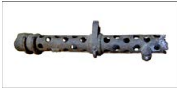
Фрагмент кожуха ствола кулемета MG-34 [42].