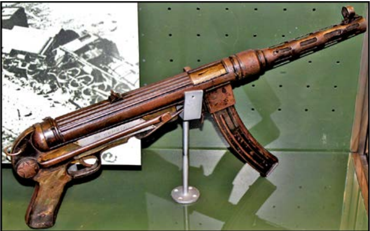
Саморобний пістолет-кулемет Героя Радянського Союзу Давида Бакрадзе [27].

У фондах є як заводські зразки вогнепальної зброї, так і екземпляри, що їх виготовляли власноруч деякі учасники бойових дій, зокрема представники руху Опору. Якщо для перших характерні маркування, висока якість матеріалу, хороше виконання, то останнім, навпаки, зазвичай притаманні грубе виконання, відсутність будь-яких маркувань у вигляді клейм, інших позначень, низька якість деталей, які часто доводилося створювати кустарним способом у польових умовах. У фондозбірні Меморіалу зберігається пістолет-кулемет, що був виготовлений білоруськими партизанами й подарований Герою Радянського Союзу Давидові Бакрадзе – командирові полку 1-ї Української партизанської дивізії. Ця зброя є симбіозом підручних засобів. Ствол був узятий із пошкодженої гвинтівки, кожух ствола – з велосипедної труби, задня частина ствола – з водопровідної труби, пружини – з підбитого літака тощо. Хоча слід зауважити, що в умовах масового воєнного виробництва на збройних заводах і СРСР, і багатьох інших країн – учасниць війни теж застосовувалися такі конструктивні рішення. Випуск продукції мав на меті створення якомога більшої кількості зброї при найменших затратах коштів і матеріалів. Відомий британський пістолет-кулемет Sten, який є у фондах Меморіалу, причому в кількох екземплярах, теж виготовлявся з англійських водопровідних труб. Конкретно з них робили затворну коробку, що поступово переходила в кожух ствола, а також приклад [5, 29–30].