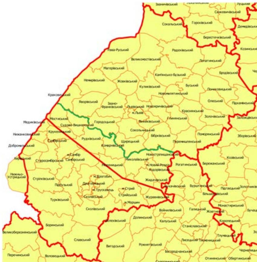
Невідповідність межі Львівської та Дрогобицької областей (червона лінія – хибна межа, нанесена програмістами, зелена – справжня межа).