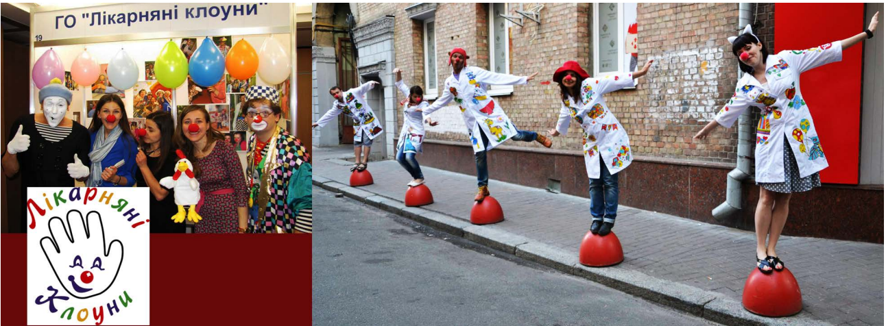
Додаток 3. Некомерційна ГО «Лікарняні клоуни України». Для роботи клоуном потрібні високий потенціал креативності, комунікабельність, вміння знаходити нестандартний вихід у складних ситуаціях [20; 21].