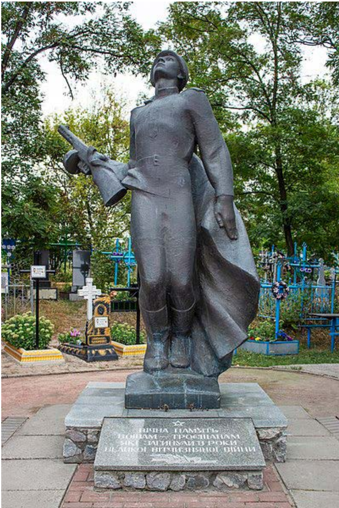
Пам'ятник «Вічна пам'ять воїнам-тросщанам, які загинули в роки Великої Вітчизняної війни».