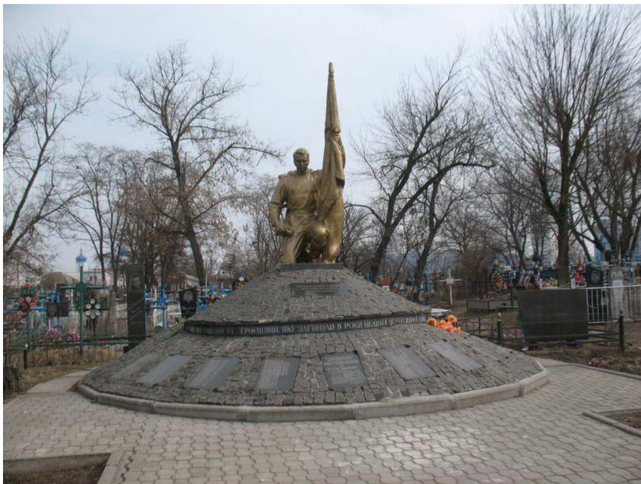
Пам'ятник «Сини Вигурівщини та Троєщини, які загинули в роки Великої Вітчизняної війни 1941–1945 рр.».