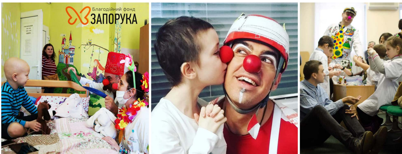
Додаток 4. Групові та індивідуальні форми роботи з хворими дітьми [21;23].