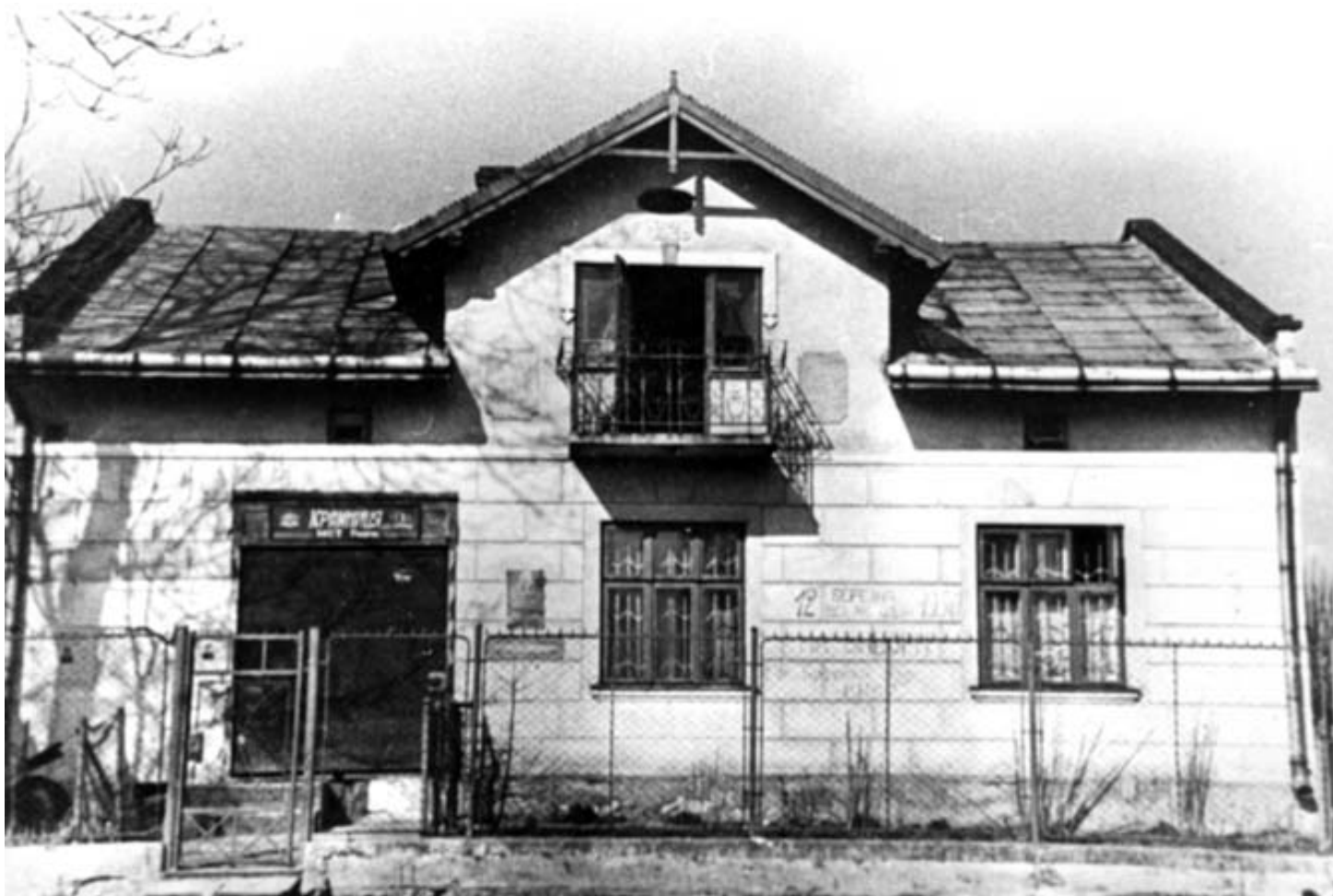
Будинок у с. Білогорща, місце загибелі Романа Шухевича (тепер музей)

наслідків Оранжевої революції, звернення Президента нашої держави В.А. Ющенка, держави, що вперше за свою 900-літню історію встає з колін і оновлюється, — подати один одному руку для загальнодержавного примирення, — я вирішив викласти свої думки в пресі» 20 . З подальших слів Гнапа з'ясуємо, що шукати місце захоронення останків Романа Шухевича він почав 1998 р. Ще до зустрічі з Болдіним йому вдалося дізнатися про те, що тіло було спалене за межами Західної України. Після цього Гнап розпочав пошук «конкретних виконавців цього акту вандалізму». Він зазначає, що перевірів велику кількість архівних справ, опитав сотні свідків. Чомусь його активна пошукова діяльність залишилася непомітною для СБУ, котра здійснювала паралельні пошуки. В кінці 1999 р. від полковника І. К. Бабенка він дізнався про склад групи, яка проводила кремацію Шухевича. Слід нагадати: в розмові з працівниками СБУ в березні 2004 р. Бабенко твердив, що нічого про це не знає.