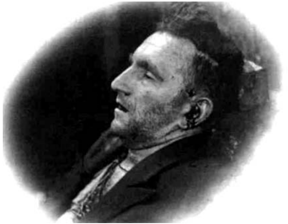
Посмертне фото Романа Шухевича

ше повідомити бодай щось: від часу отримання заяви Болдіна минуло вісім місяців. Більше того, здійснена за той час перевірка не дала додаткових аргументів. Тобто не було об'єктивних підстав вважати, що отриманий СБУ матеріал вичерпує проблему місця поховання Шухевича. Тому висуваємо припущення, що відповідь було