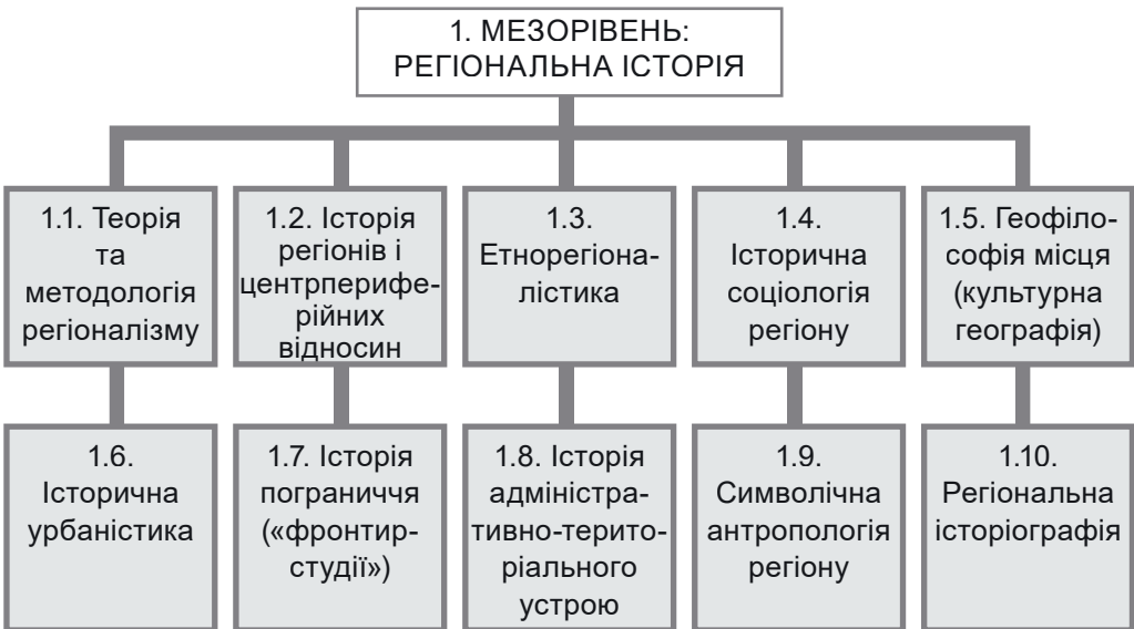
Схема 2. Історична локалістика: ієрархія субдисциплін і наукових напрямів

Зрозуміло, що така схема значною мірою умовна і не може претендувати на вичерпність. Її можна конкретизувати – адже і традиційна історична географія, і щойно сконструйована як окремий дослідницький напрям сільська історія, як і ціла низка інших підсистем локального історичного знання, можуть претендувати