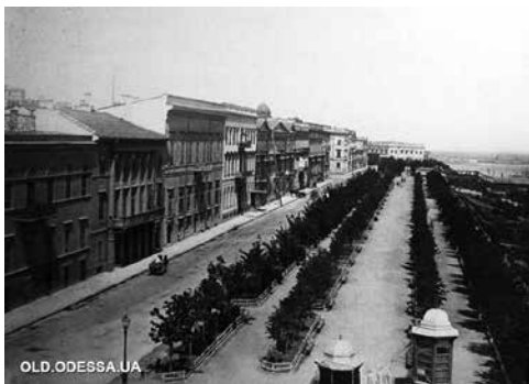
Бульвар в Одесі у 1880-ті).

Проте взимку 1882 року спільна робота розпочалася; вона тривала аж до від'їзду Іллі Юхимовича з Москви і була завершена в 1883 році,