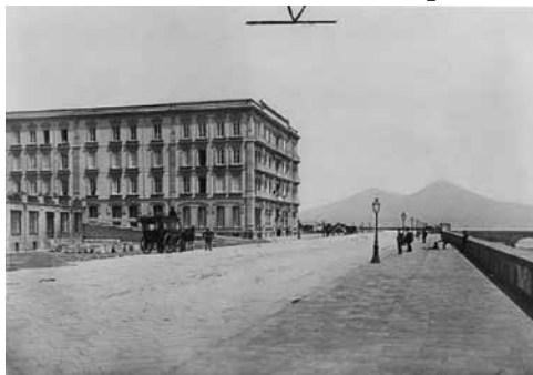
Набережна у Неаполі,

рішення моря, відчувається пленер. Фігура лежачого і набережна написані в протирання, можливо через поспішність і бажання якнайшвидше передати загальне враження.