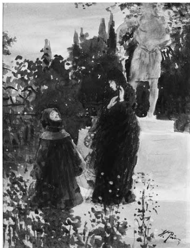
«Одеський» етюд до картини «Дон Жуан і донна Анна» (1887-1896 рр.), що зберігається у Музеї ім.О.С. Пушкіна. С.-Петербург).