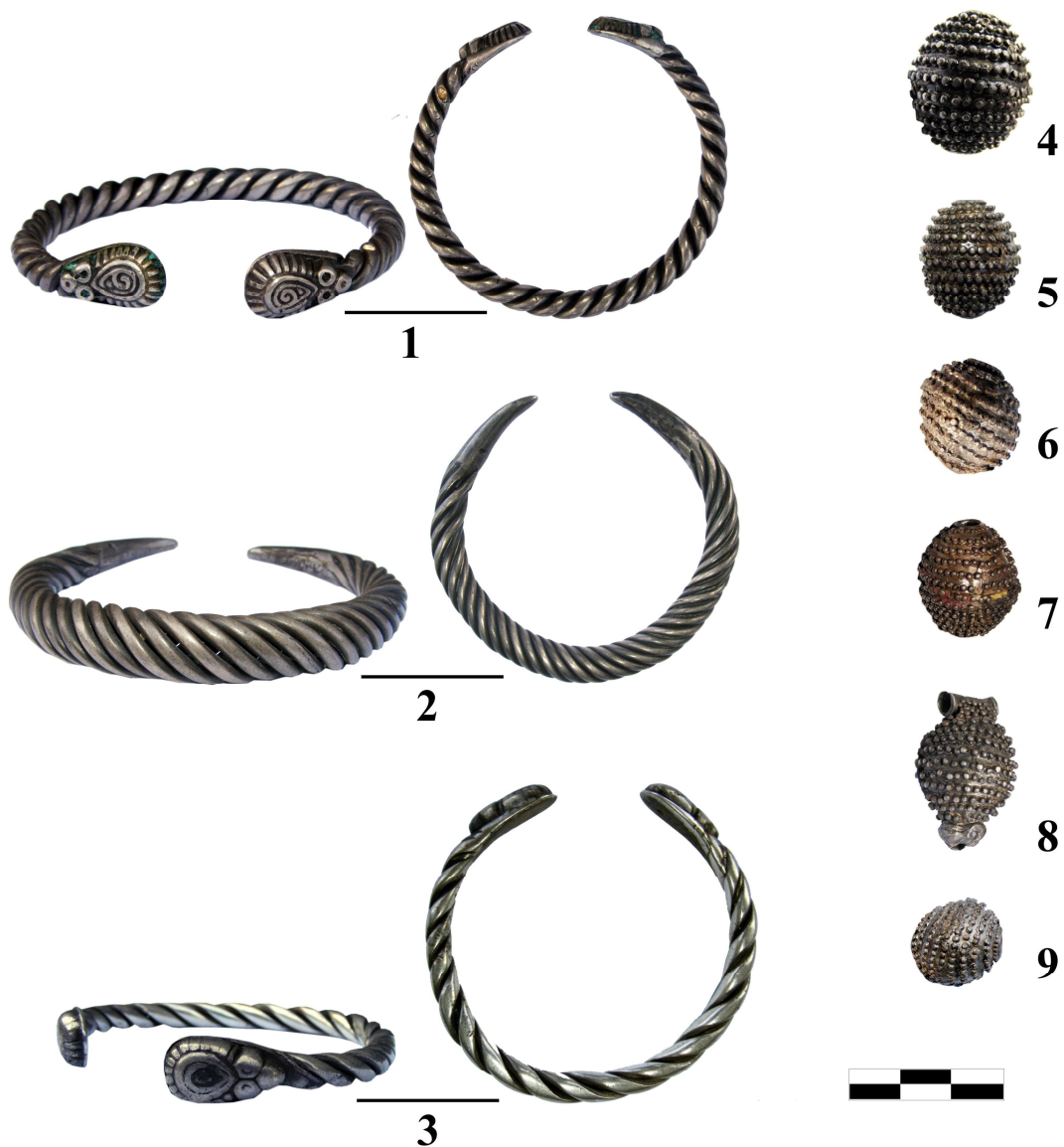
Рис. 1 (початок). Городищенський скарб 27 . 1-3 – браслети, 4-9 – намистини