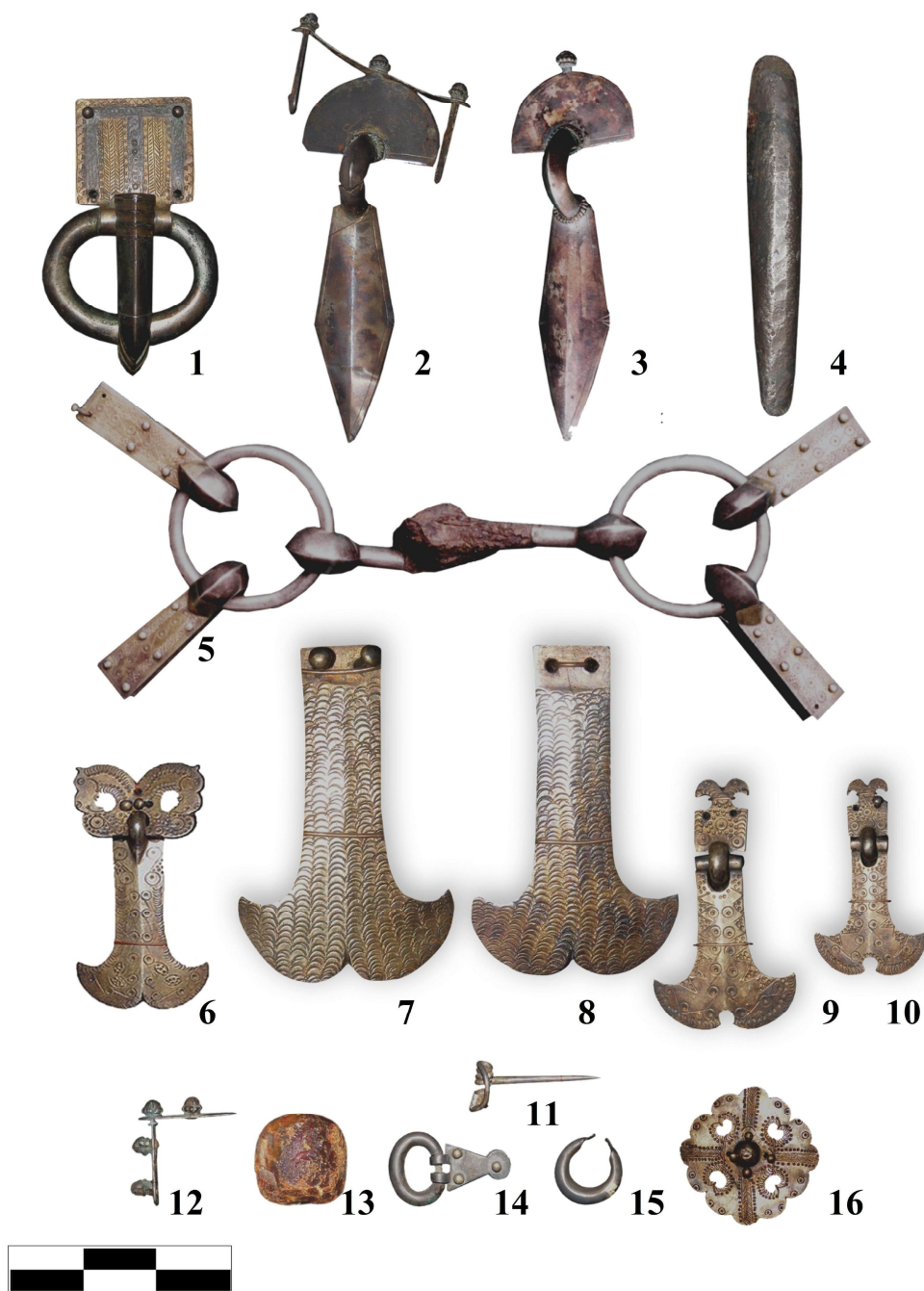
Рис. 2. Качинський скарб 28

1, 14 – пряжки, 2, 3 – фібули, 4 – гривна, 5 – вудила, 6-10, 16 – накладки, 11-12 – фрагменти фібул, 13 – намистина, 15 – сережка